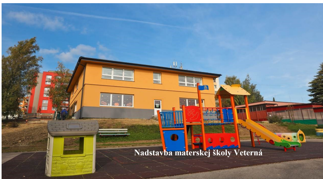
Nadstavba materskej školy Veterná