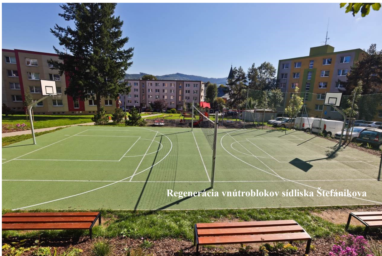
Regenerácia vnútroblokov sídliska Štefánikova