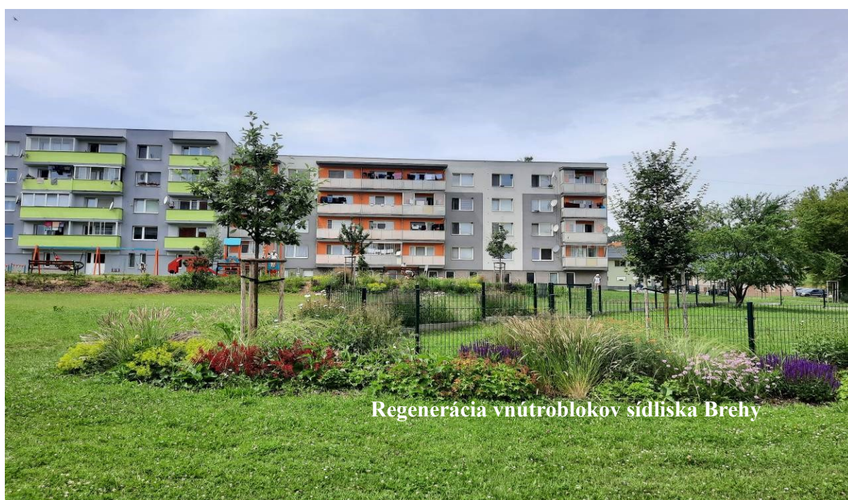
Regenerácia vnútroblokov sídliska Brehy