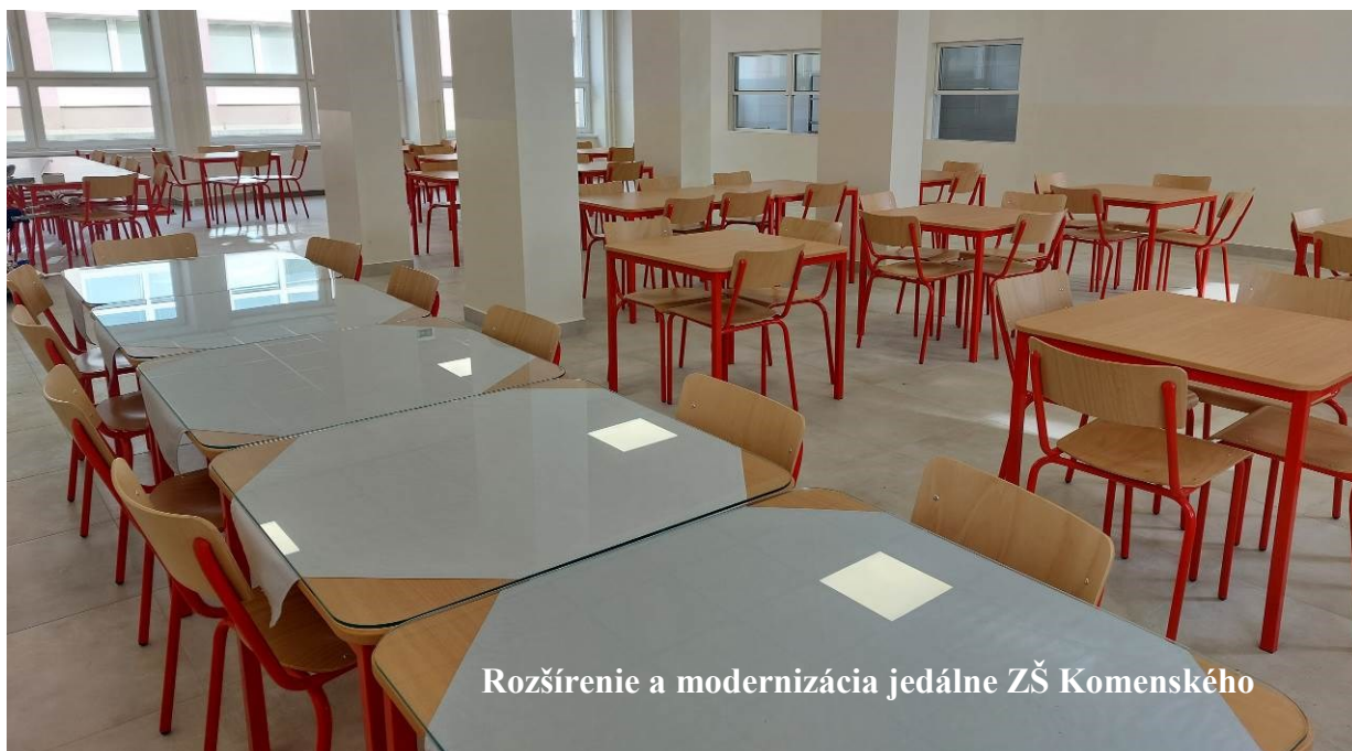
Rozšírenie a modernizácia jedálne ZŠ Komenského