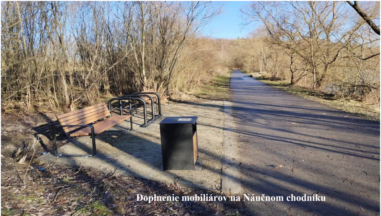
Doplnenie mobiliárov na Náučnom chodníku