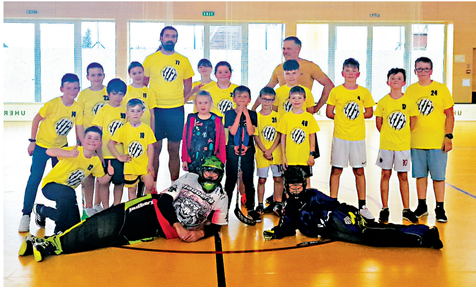
Deti po zápase florbalového krúžku.