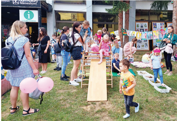
Hravosť a radosť vládli na Dni detí aj tento rok.

koťmi z Labkovej patry. Práve tento filmový megahit sme premietali v Kine Kultúra ako záver programu, ako inak, za špeciálnu sviatočnú cenu. Dovoľte nám, ešte raz sa poďakovať týmto ľuďom, ktorí nám pomohli s