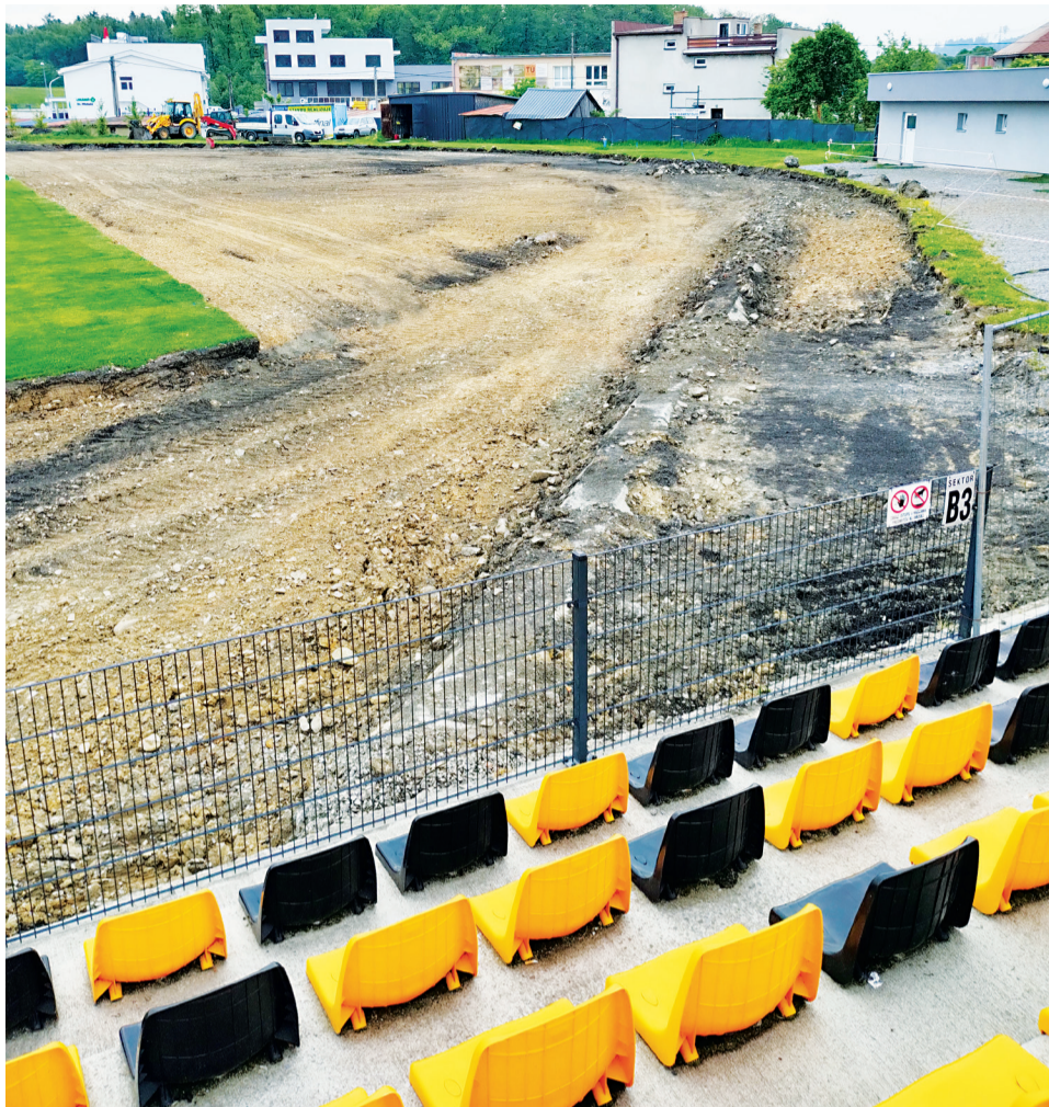
Pôvodná dažďová kanalizácia zasahovala do povrchu atletickej dráhy, preto ju bolo nutné znížiť.