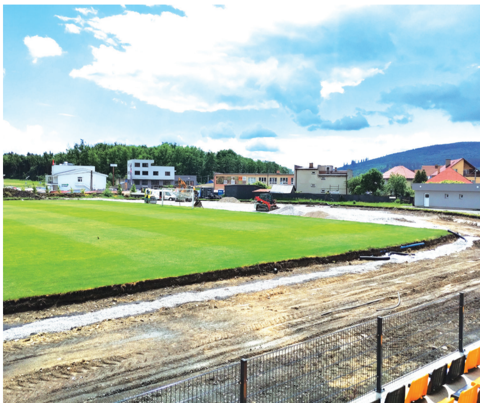
Práce na modernizácii atletického ihriska pokračujú.

Počas odstraňovania jestvujúcich vrstiev atletickej dráhy sa v mieste južného oblúka atletickej dráhy obnažilo betónové potrubie DN 800, ako pôvodná dažďová kanalizácia. Zistilo sa, že betónová rúra výškovo zasahuje do finálnych vrstiev atletickej dráhy a je nutné jej zníženie. Preto bolo potrebné nájsť rieše-