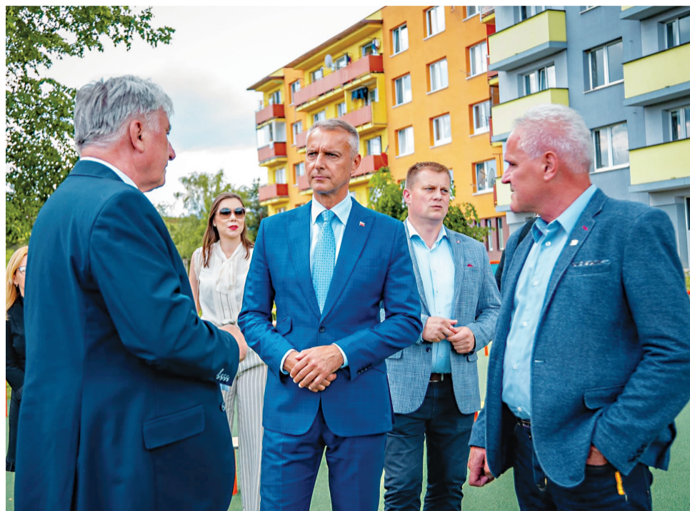
Minister Richard Raši v sprievode vedenia mesta pri prehliadke vynoveného detského ihriska a ostatných aktivít na Brehoch v rámci projektu regenerácia vnútroblokov.

podporené nenávratnými finančnými prostriedkami z Integrovaného regionálneho programu (IROP). Najskôr nadstavbu Materskej školy na Brehoch, potom regeneráciu vnútroblokov medzi bytovkami tiež na Brehoch. Návšteva ďalej pokračovala v Oravskej poliklinike, vo vybudovaných nových priestoroch ambulancií na 3. podlaží budovy polikliniky a tiež v zostavaných priestoroch na 4. a 5. podlaží, na ktoré potrebuje poliklinika získať ďalšie financie. Poslednou zastávkou bola prehliadka „perly Námestova“ - Nábrevia s amfiteátrom. Minister prezradil, že je u nás prvý-