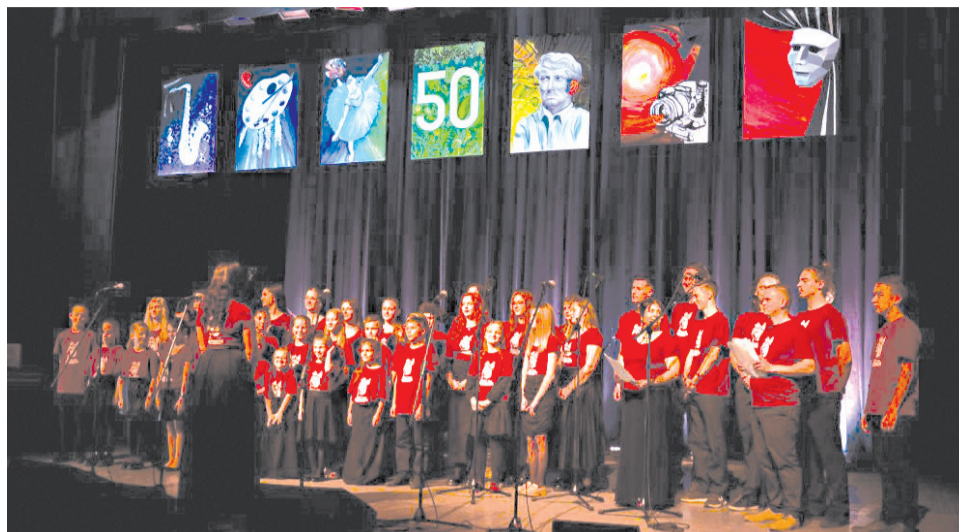
Spievací zbor Altebasso na slávnostnom koncerte pri príležitosti 50. výročia vzniku ZUŠ Ignáca Kolčáka.

Naším hlavným cieľom je, aby žiaci svoje nadanie a talent prezentovali hlavne na verejnosti, či už počas rôznych kultúrnych podujatí alebo na umeleckých súťažiach. V ponuke máme aj bohatú mimoškolskú činnosť. Deti navštevujúce ktorýkoľvek odbor našej ZUŠ si môžu zapievať v školskom zbere Altebasso . Repertoár zboru je rôznorodý, pričom zahŕňa ľudové piesne, chrámovú hudbu, populárne piesne, gospel, ale aj autorské piesne. Chceme, aby kvalita zboru rás-