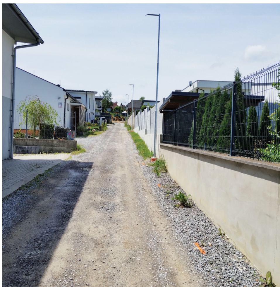
Nová Strojárska ulica je v poradi 43. ulicou v našom meste. Aktuálne sa tu buduje verejné osvetlenie, nasledovať budú ďalšie práce na jej dobudovaní.

Mesto pristúpilo k vybudovaniu ulice Strojárska. Zrealizujú sa tu nové konštrukčné vrstvy, ďalej odvodnenie komunikácie a tiež