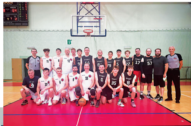
Družstvá mužov BK Dolný Kubín a BK Oravan Námestovo

Napriek prehrám sa veľmi tešíme na spoluprácu s iný-