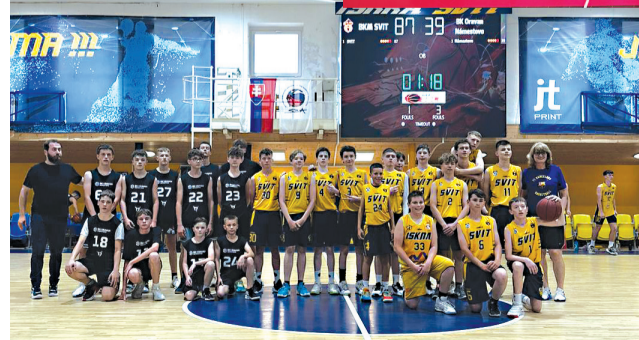
Družstvá chlapcov BK Oravan Námestovo a Iskra Svit kategórie U15.