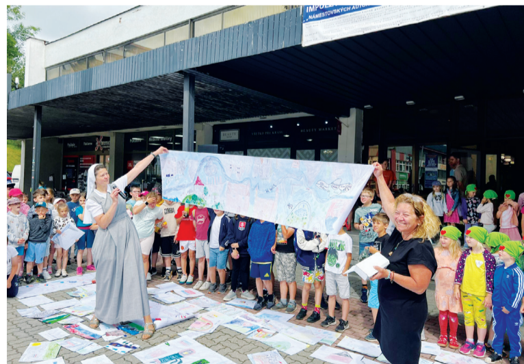
Záverečné hodnotenie tvorivých dielní v rámci Gorazdovho výtvarného Námestova.

prichádzajú, my ich evidujeme, menujeme porotu, porota ich vyhodnotí, následne víťazné diela naištalgujeme a potom prizveme všetky školy v našom meste, miestne ZUŠKY, pána primátora i pána dekana, aby sme spoločne, za prítomnosti všetkých detí a v slávnostnom duchu otvorili výstavu a odovzdali ocenenia. Tento rok nám pri tvorivých dielňach na námestí pomáhala CZŠ sv. Gorazda, ktorá si, mimochodom, odniesla aj ocenenia – gratulujeme!