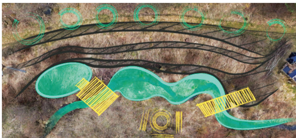
Grafické spracovanie návrhu: Martina KURTULÍKOVÁ

ské sady, ktorý premení zanedbanú plochu vodného toku Klince na nepoznatie. Riešené územie sa nachádza v blízkosti Mlynskej ulice. Revitalizácia so sebou prinesie vyčistenie potoka, vytvorenie dvoch prírodných jazier a komplexnú revitalizáciu priľahlých brehov. Po vyčistení koryta vzniknú v brehoch prírodné terasy, rybník a jazero prispôbené na osvieženie či otužovanie. Následne