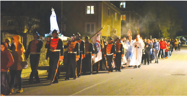
Sochu Fatimskej Panny Márie niesli v sprievode ulicami mesta členovia Dobrovoľného hasičského zboru.