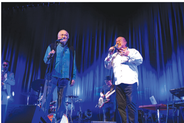
Mnohé zvučné mená, ako Peter Lipa Band, Milan Lasica a mnohí ďalší hudobníci vystúpili na 10. ročníku OravaJazz.

Najväčším lákadlom festivalu je kvalitná hudba. Každoročne pozývame vynikajúcich svetových aj domácich umelcov. Častokrát nezáleží na mene. Naši návštevníci sa tak môžu spoľahnúť na kvalitu, pretože každý koncert na