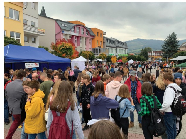
Do tisícky žiakov si prišlo do Námestova pozrieť prezentáciu 28 stredných škôl Žilinského kraja.