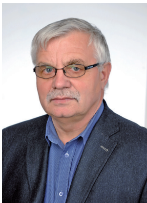
Marián Grigel' st.

zdroje, v poplatku za rozvoj obmedziť jeho čerpanie len na úhradu kapitálových výdavkov súvisiacich s výstavbou.