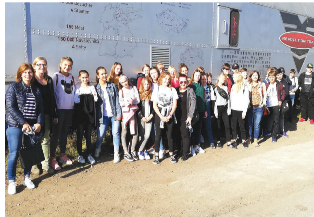
Osvetový program v protidrogovom vlaku absolvovali žiaci ôsmeho ročníka.

Počas prvého týždňa, keďže návrat do školských lavíc po prázdninách je náročný, pripravili pani učiteľky pre žiakov prvého stupňa didaktické hry. Na nábreží Oravskej priehrady mohli žiaci vidieť názorné ukážky hasičského a záchranného zboru a tiež ukážky činnosti mestskej polície.