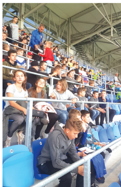
Na ihrisko mali naši športovci skvelý výhľad.