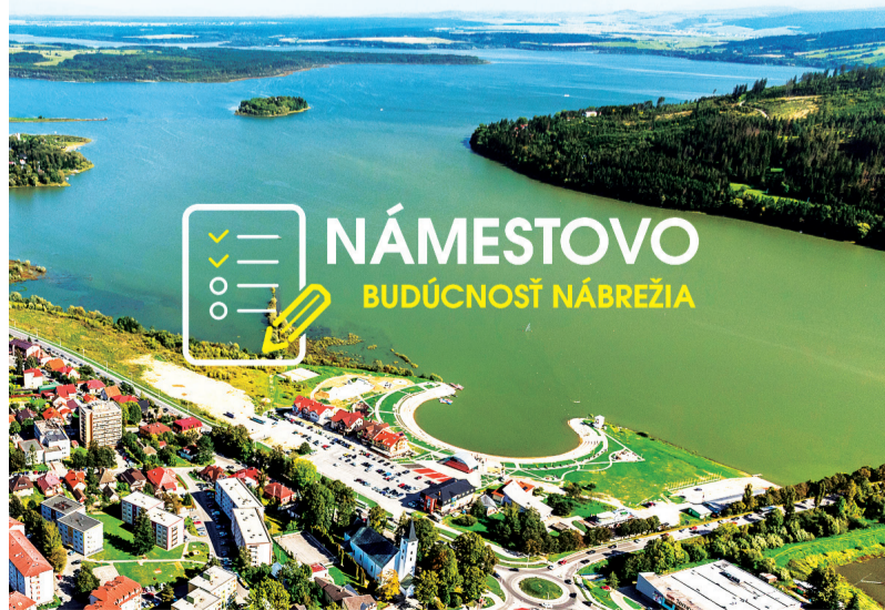
V priestore nábrežia by ľudia podľa ankety privítali mestský park a plaváreň.

Dotazník vytvorili projektívni zamestnanci mesta, tvorilo ho celkovo 9 otázok, šírny bol prostredníctvom mestského webu, sociálnych sietí a osobného zberu. Na naprogramovanie a vyhotovenie výsledkov si mesto predplatilo program transform. Marián Kasan