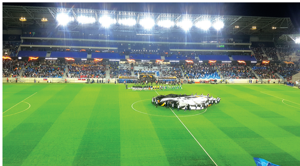
Aj napriek prehre Slovana to bol nezabudnuteľný zážitok.