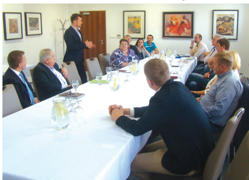
Zástupcov oravských samospráv prezentácia novej inovatívnej technológie spracovania odpadu zaujala.

menej ako 4% už sterilizovaného odpadu pre uloženie na skládky, vedenie mesta Námestovo oslovilo firmu Bioelektra Group. Tá, po skúsenosti s už dlhodobejšou spoluprácou s vedením mesta Tvrdosín v tejto oblasti, zorganizovala v polovici októbra prezentáciu spomínaného riešenia pre primátorov a ďalších pracovníkov samospráv všetkých štyroch oravských miest.