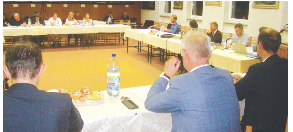
Hoci išlo na rokovani mestského zastupiteľstva o „suché čísla“, diskusia k nim bola mimoriadne emotívna.

re si, aj podľa vyjadrenia primátora, môžu na úrade zistiť bežne mimo rokovania zastupiteľstva, resp. v danej problematike, ktorá im nie je jasná, sa dozvedieť individuálne. Poslanci oponujú, argumentujú, že potrebné informácie nedostávajú včas, niektoré prichádzajú rovno na rokovací stôl... Tentoraz dĺžku rokovania natiahlo i to, že poslanci – predsedovia komisií MsZ v rámci bodu rôzne predkladajú na