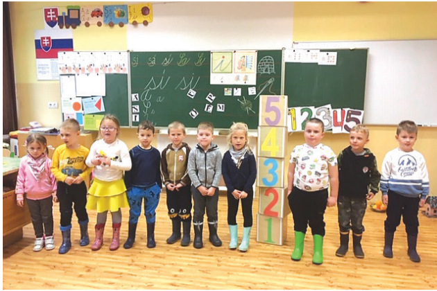
Predškoláci zašli do triedy za prvákmi.

Ďakujeme za návštevu, milí škôlkari! (zš k)