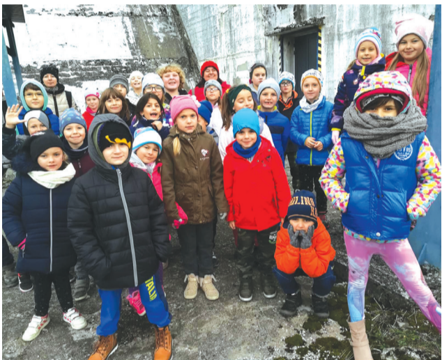
Mali ochranári sa počas návštevy priehradného múru dozvedeli mnoho zaujímavostí.

Počas jesenných prázdnin zorganizovalo Centrum voľného času Maják dvojdňový tábor spojený s nocovačkou pre všetky deti, ktoré majú pozitívny a ohľaduplný vzťah k našej spoločnej planéte Zem. Naši mladí ochranári už dobre vedia, že ak sa o životné prostredie budeme starať a ochraňovať ho, odmenou nám bude šanca žiť ekologický život. V priebehu dvoch dní deti získali mnohé znalosti ako sa správať k prírode, čo všetko by mal vedieť správny ochranár, zahrli sme si spoločne envirohry, zajazdili na koňoch, či hľadali indicie smerujúce k nájdeniu pokladu, ktorý