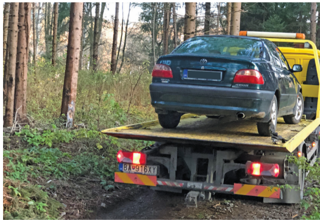
Odťahové vozidlo postupne odvážalo autá rybárov do Žiliny. Rybári ich už medzičasom dostali späť – dovezli si ich sami.