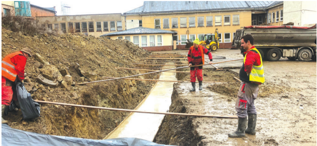
Práce na budovaní parkoviska sú v plnom prúde.