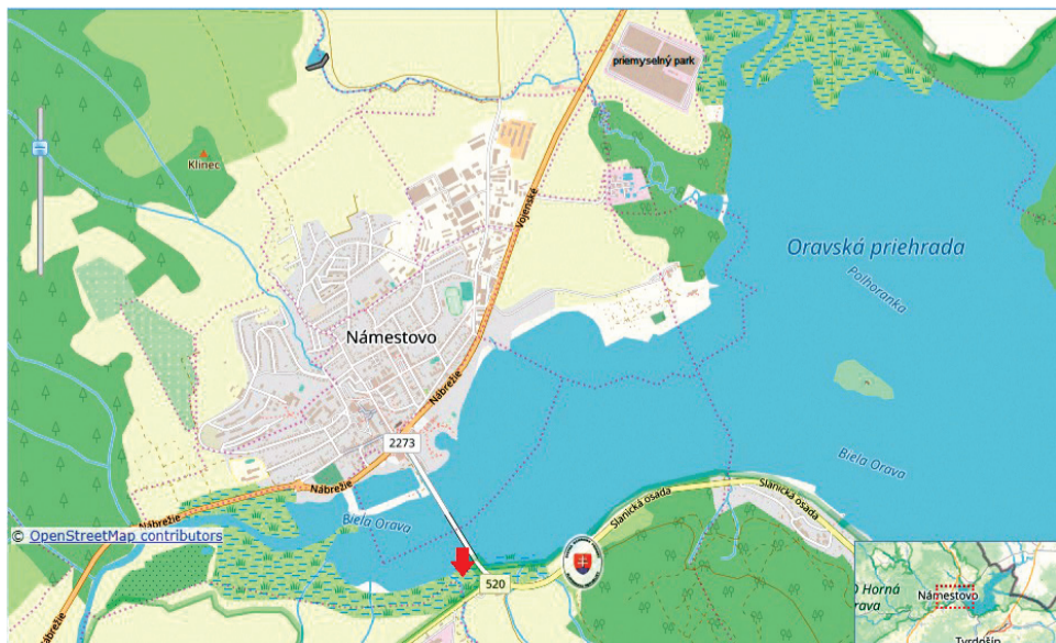
Mapa oravskej priehrady a okolia, vpravo označenie zonácie tohto územia.