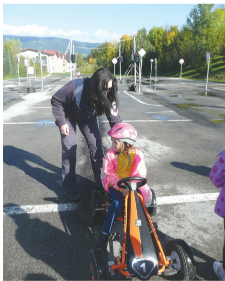
Deťom sa na dopravnom ihrisku páčilo.