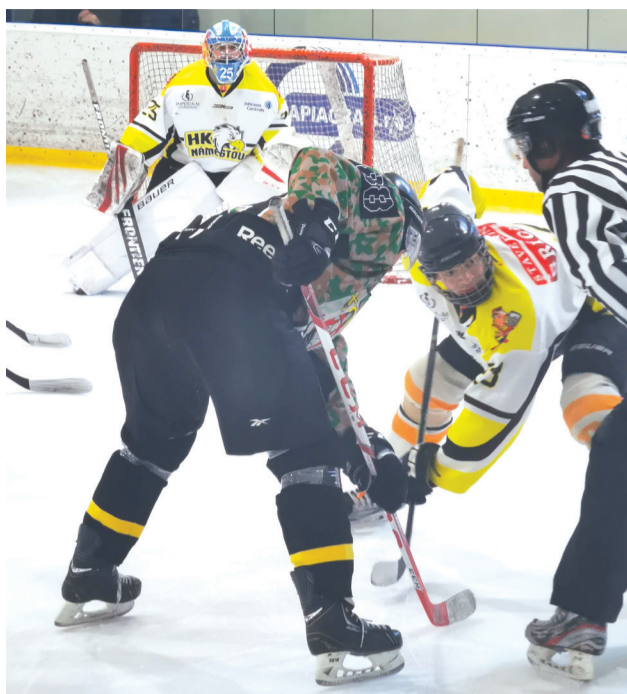
Hneď úvodný zápas proti Liesku bol mimoriadne kvalitný a atraktívny.