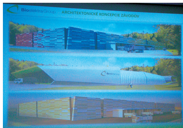
Aj takto by mohol vyzerat' na Orave nový závod na spracovanie odpadu.

linka vyseparuje frakcie podľa potreby trhu – výsledným produktom sú rozličné druhotné suroviny (napr. kovy, plasty, sklo, ale aj stavebný materiál...), organická frakcia a tuhé alternatívne palivo. Vyseparované produkty sú určené na ďalšie využitie v procesoch a výrobkoch. Produkty na ďalšie využitie tým, že sú sterilizované a čisté, už nemusia prechádzať ďalším procesom. Sú sklado-