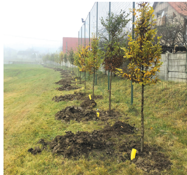
Stromy vysadené v areáli MŠK.