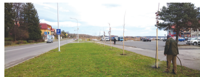
20 javorov červených bude skrášľovať ostrovček medzi priedahom a parkoviskom ICN.

seli byť vyrúbané na Slanickom ostrove umenia. Okrem spomínaných dvoch projektov sa nám ešte podarilo získať financie z externých zdrojov aj na výsadbu pôdopokryvných okrasných drevín, ktoré boli vysadené na valy v areáli skateparku. Z mestských zdrojov bolo zakúpených 100 kusov hrabov obyčajných, ktoré boli umiestnené v areáli ZŠ Slnečná a v blízkosti 12-poschodových bytoviek na sídlisku Brehy. Dreviny budú v budúcnosti upravované ako živý plot. Pred penziómom Magura si našlo miesto aj päť javorov poľných. (mk)