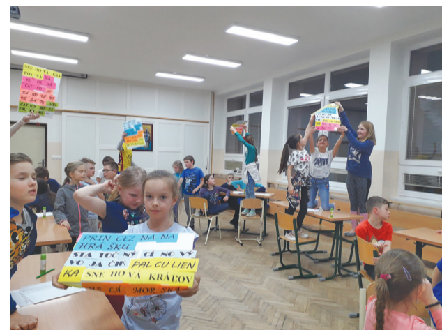
Družstvá žiakov mali za úlohu aj poskladať názvy rozprávok H. Ch. Andersena.

V úvode si žiaci pozreli prezentáciu o svetoznámom rozprákarovi, potom boli rozdelení do zmiešaných družstiev, spoločne skladali názvy rozprávok, obrázkové puzzle, pomáhali Jankovi Hraškovi prejsť suchou nohou cez rozvodnenú rieku, riešili tajničku, v ktorej sa dozvedeli výrok H. CH. Andersena: „Niet krajšej rozprávky ako tá, ktorú napíše sám život.“ Po