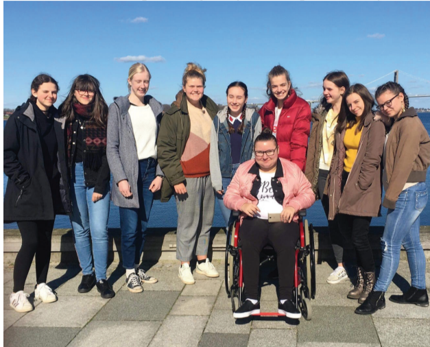
Pri mori v Dánsku.

a tak mohli naučiť prítomných Európanov slovenský pozdrav ahoj! či „čarovné“ slovíčko ďakujem! Úspech malo aj učenie našej regionálnej piesne Na Orave dobre, pri ktorej