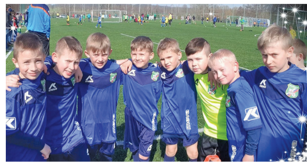
Chlapci z MŠK vo výbere Oravy.