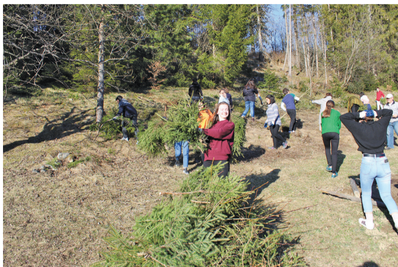
Aj čistenie miest považovaných za prírodné dedičstvo bolo v programe pobytu študentov z EÚ na Orave.

Následne v dňoch 25. – 29. marca sme privítali 13 pedagógov a 32 študentov všetkých partnerských škôl u nás na Gymnázium Antona Bernoláka v Námestove. Počas celého týždňa sme ich sprevádzali prírodnými a kultúrnymi pamiatkami Oravy a blízkeho okolia, keďže témou nášho projektu HERCULES je kultúrne a prírodné dedičstvo Európy. Po 2 mobilitách na Cypre (november 2018) a v Bulharsku (február 2019) sme sa stali treťou hostujúcou školou v rámci dvojročného školského partner-