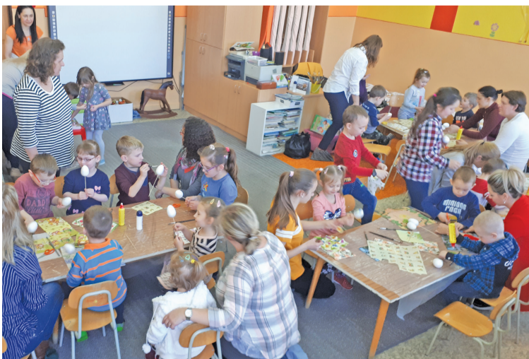
Deti mali radosť zo zdobenia veľkonočných kraslic, ktoré ich budú tešiť i doma počas celých sviatkov Veľkej noci.