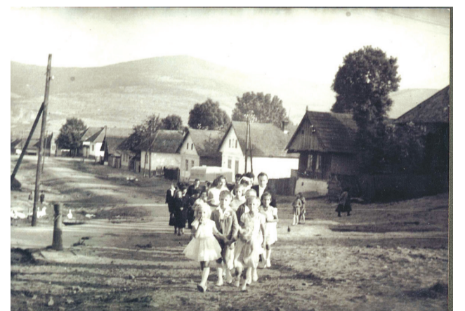
Svadba na Štefánikovej ulici v roku 1961.