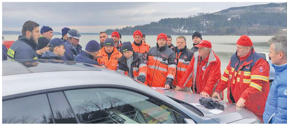
Porada záchrannárov pred pátracou akciou.