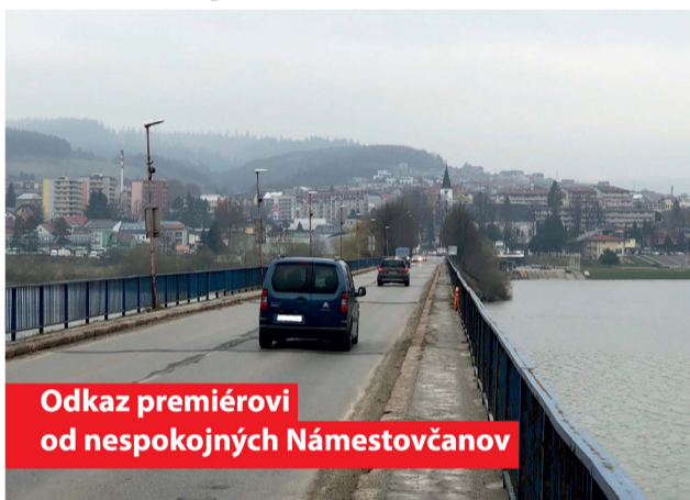
Odkaz premiérovi od nespokojných Námestovčanov

Aj keď Námestovo neleží na trase budúcej rýchlostnej cesty, problémy so zhrustenou dopravou sa týkajú aj nášho mesta. Tranzitná doprava neraz komplikuje dopravnú situáciu mnohým ľuďom, ktorí sa potrebujú presúvať v rámci mesta. Do akcie sa preto už čoskoro aktívne plá-