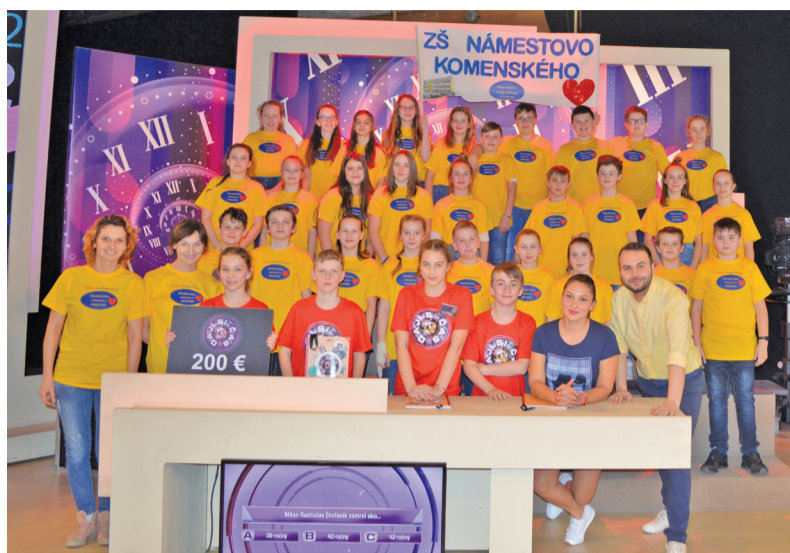
Radosť z víťazstva.

Atmosféra pri nakrúcaní bola výborná, plná napätia, zábavy a radosti. Za podporu ďakujeme aj nášmu „žltému“