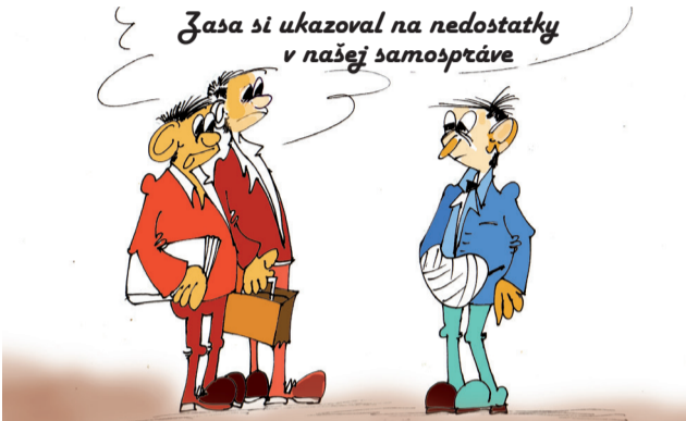
Kresby: Anton Lajmon