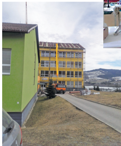
Rekonštrukcia strechy - škola má 6 blokov, 1. etapa bola realizovaná v marci 2016 na bloku A a F, v 2. etape na bloku E, ktorá prebehla v marci 2019 (na foto), momentálne sa realizuje 3. etapa blok C a D (telocvičňa) a ostáva dokončiť posledný blok B - jedáleň.

volebného obdobia. Rozpočet, projekty, výkresy, peniaze z eurofondov a ministerstva, cestičky, ako sa k nim dostať,