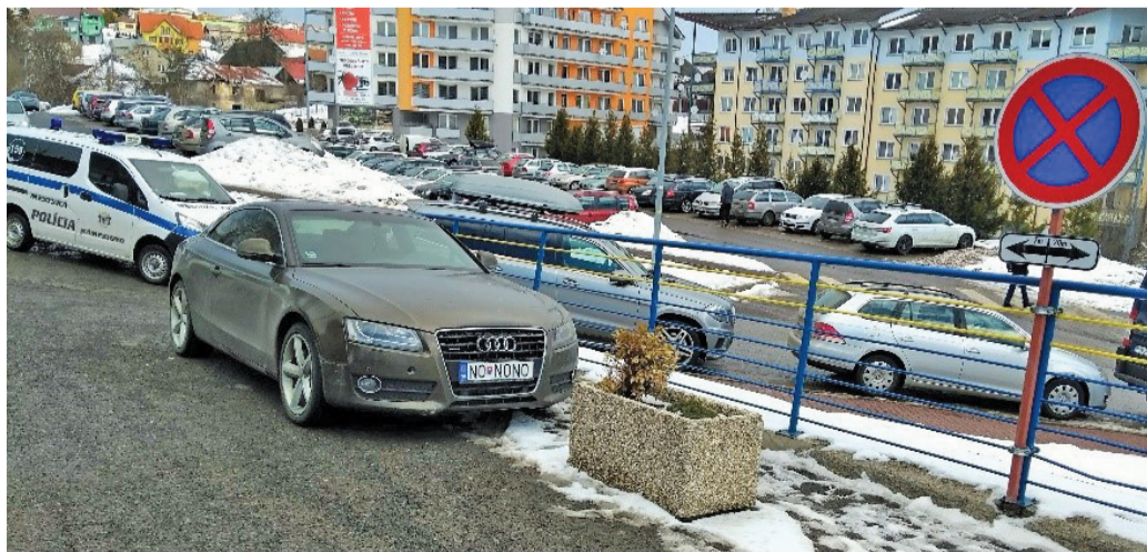
Nesprávne parkovanie vozidiel si verejnosť všima a upozorňuje naň Mestskú políciu.