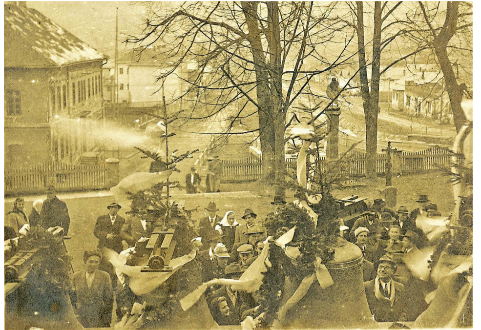
Slávnostné vyťahovanie nových zvonov do veže kostola v roku 1924.

cich pribudli do kostola nové zvony, zrekvirované pred siedmimi rokmi. Ich slávnostná vysviacka sa konala 8. 9. 1924. Bola veľkou udalosťou pre veriacich z Námestova a okolitých farností.