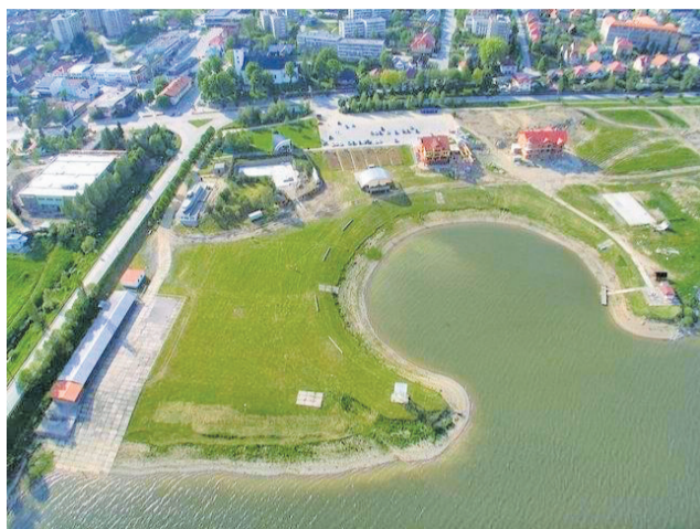
V okolí Účka sa plánuje vybudovanie zelenej oázy, ale aj ďalšie aktivity mesta, s ktorými sa uvažuje v priestore nábrežia.

Reagovali sme aj na výzvy ministerstva financií, z ktorého dotačných prostriedkov sa sna-