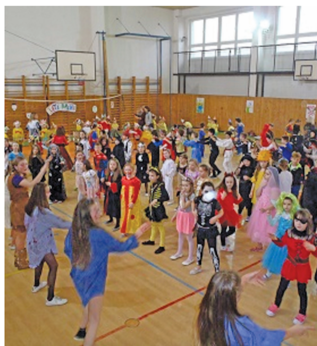
S deťmi zo ZŠ Slnečná sa schuti zabávali aj škôlkari z blízkej materskej školy.