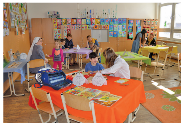
Celkom prvý, zápisový deň v škole, bol príjemný i zábavný.

Tento školský rok sa zápis niesol v pokojnom duchu Dobrého pastiera a jeho ovečiek. Pre budúcich prváčikov sme mali pripravené pestré aktivity, ktorými si overili svoju školskú zdatnosť. Ovečky sprevádzali budúcich žiakov pri modlitbe, speve, písaní, kreslení a matematike. Po splnení všetkých úloh si žiaci odniesli darčeky, ktoré im od septembra budú veľkými pomocníkmi. Sladkou odmenou im bola mafinka