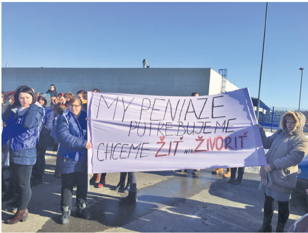
Protestné zhromaždenia zamestnancov dopomohli k zvýšeniu plátov vo firmách Visteon a Yanfeng.

Viac ako štyri mesiace sa snažili zamestnanci firiem Visteon Electronics Slovakia s.r.o a Yanfeng dohodnúť na zvýšení miezd a vyjednaní novej kolektívnej zmluvy. V marci sa vyjednanie skončilo úspešne. Zamestnanci oboch firiem majú mať od apríla 2019 vyššie platy.