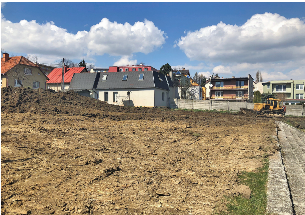
(mk) V spomínanej lokalite aktuálne prebiehajú terénne úpravy.

Technické služby Mesta Námestovo začali s výstavbou nového oplotenia a vstupnej brány do športového areálu MŠK. V rámci týchto úprav vznikne aj zhruba 40 nových parkovacích miest, ktoré budú počas týždňa slúžiť pre návštevníkov blízkeho Daňového úradu, či súkromnej materskej školy Rozprávokovo. Počas víkendy ho pre zmenu naplnia autá rodičov, hráčov a fanúšikov v rámci futbalových zápasov detí a dospelých. V aktuálnom období prebiehajú terénne úpravy. Ukončenie realizácie je naplánované najneskôr na koniec júna.