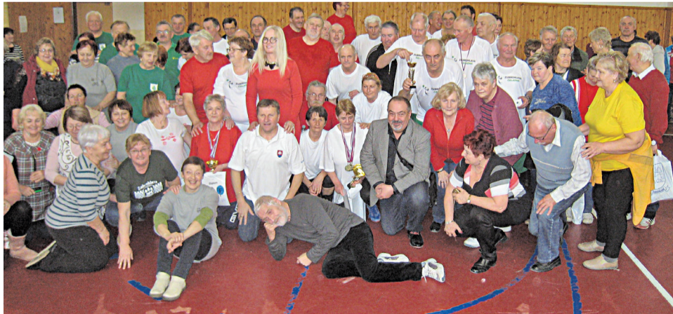
Účastníci volejbalového turnaja seniorov v Zubrohľave.