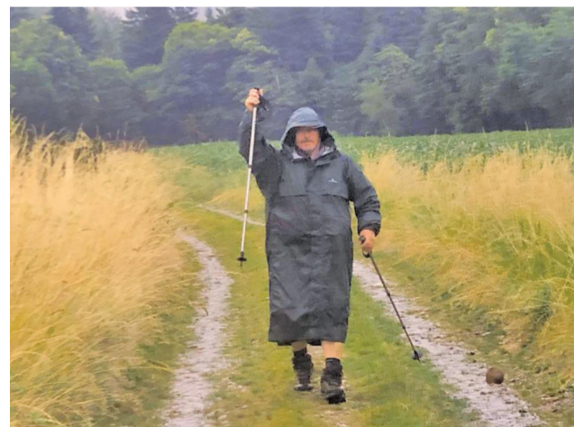
Putovanie, to je aj poznávanie samého seba...

... možno by som ešte doplnil, že tieto cesty mi dali nielen duševný pokoj a obnovili vnútornú rovnováhu, ale dost' zásadne ovplyvnili môj vzťah k svojmu okoliu, i k sebe sa-