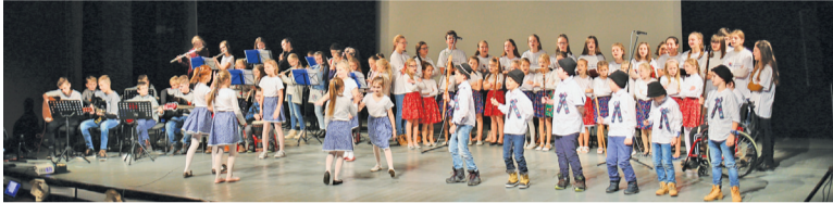
Na slávnostnej akadémii v Dome kultúry v Námestove pri príležitosti 20. výročia vzniku Cirkevnej základnej školy sv. Gorazda v bohatom programe prezentovali svoj talent žiaci školy pod vedením učiteľov.