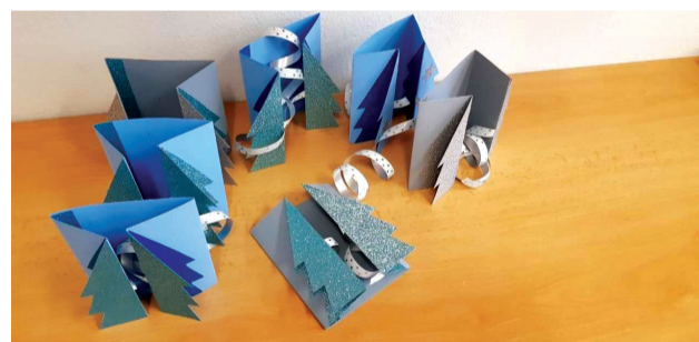
Autormi papierového lesa deti zo ZÚ Zázračný ateliér.