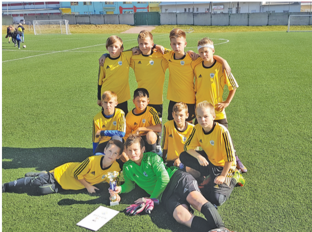
Jeden z úspešných športových kolektívov ZŠ Komenského.

Žiaci sa radi venujú aj iným športom ako je hokej, florbal, volejbal, hádzaná, basketbal,