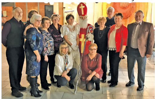
Námestovskí seniori si užili aj radosť z príchodu Mikuláša.