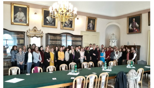
Začínajúca školská sociálna pedagogička