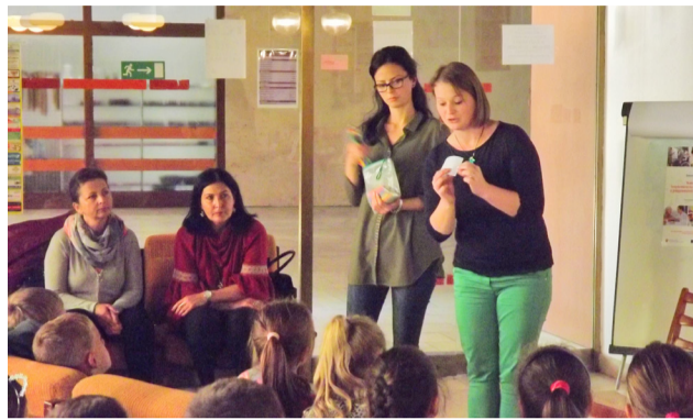
Žiaci a ich učiteľky zo ZŠ Klin počas prednášky pracovníčok z Centra pedagogicko-psychologického poradenstva a prevencie v Námestove.

Pribudli aj nové knihy s tematikou šikanovania, ktoré využilo aj Centrum sociálnych služieb v Námestove. To v spolupráci s Centrom peda-