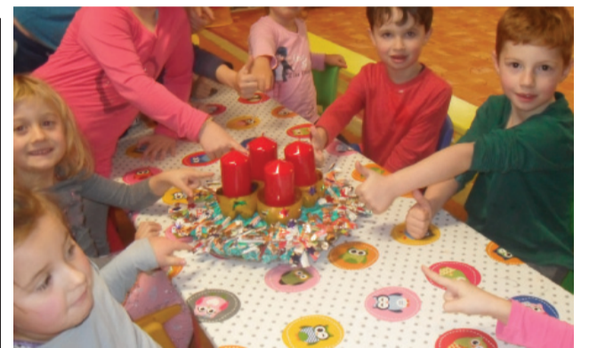
Adventný veniec- spoločná práca triedy Nezábudky