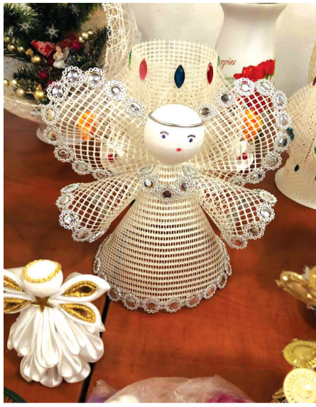
Jeden z exponátov výstavy členov Jednoty dôchodcov v Dome kultúry v Námestove.

prvé soboty, pôsty, uzdravenia, radosti z malých vecí,