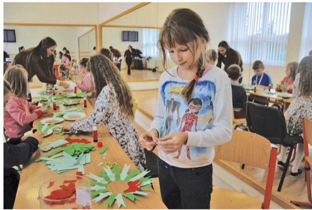
Vianočné tvorivé dielne v CVČ odhalili nejen talent.

Len raz v roku prichádza ten vzácny čas. Čas, keď sa sneh lígoce a jedlička pekne svieta a k tomu veľká radosť a žiarivce očká detí..., to je čas vianočný, na ktorý sa všetci tešíme. Každoročne sa v Centre voľného času Maják na vianočné sviatky pripravujeme v zmysle tradícií. Deti ich už dôkladne poznajú z našich tematických aktivít alebo z nocí v CVČ, kedy si rozprávame príbehy našich starých mám, priblížime si tradície vianočných zvykov v našom regióne, predstavíme si typy na pekný vianočný darček a pri svojej fantázii si aj my zaspomínáme na detské časy. Aby sme to všetko stihli, s tohtoročnými vianočnými prípravami sme začali o niečo skôr. Už v posledný októbrový týždeň sme mali pripravené vianočné ozdoby z papiera a rôznych prírodných tradičných aj netradičných materiálov, ktoré sme spolu s deťmi vlastnoručne vyrobili na tvorivých dielniach. Nasledovalo medovníkové súťaženie a pečenie oplátok, čo bola veľká zábava.