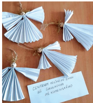
Anjelíky, deti zo ZÚ Šikulkovia.