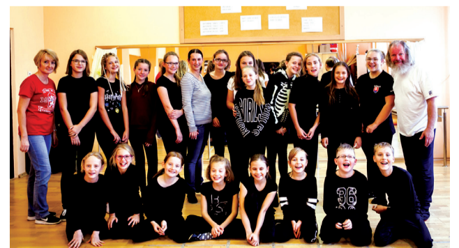
Žiaci z literárno-dramatického odboru ZUŠ Ignáca Kolčáka v Námestove, spolu so žiakmi toho istého odboru zo SZUŠ Pierrot sa učili pantomímu.