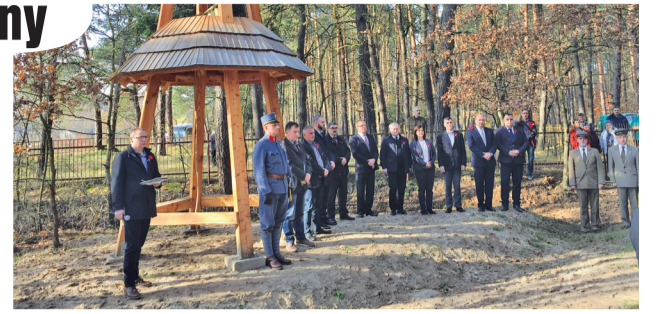
Fotografie zo spomienkového stretnutia na počesť padlých vojakov z dolnej a hornej Oravy, Poľska a iných národov, ktorí bojovali v 1. svetovej vojne.