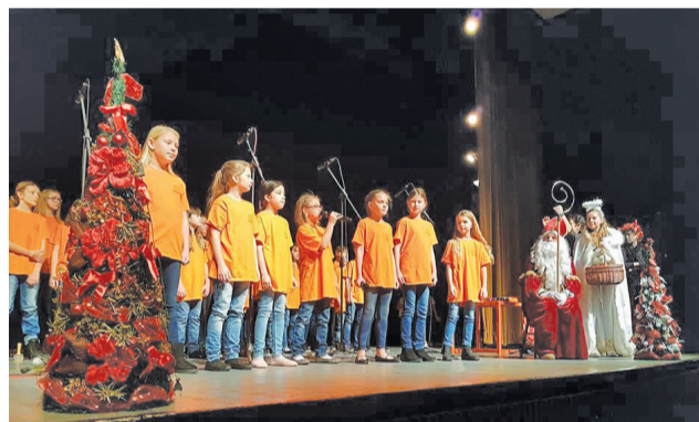
ZUŠ Ignáca Kolčáka a ZŠ Václava Havla z českých Poděbrad pripravili v Námestove deťom na Mikuláša bohatý program.