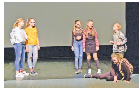
Žiaci ZUŠ. I. Kolčáka priblížili šikanu vo svete detí.

„Prvým šťastím dieťaťa je, že je milované“ (G. Bosco) (mv)