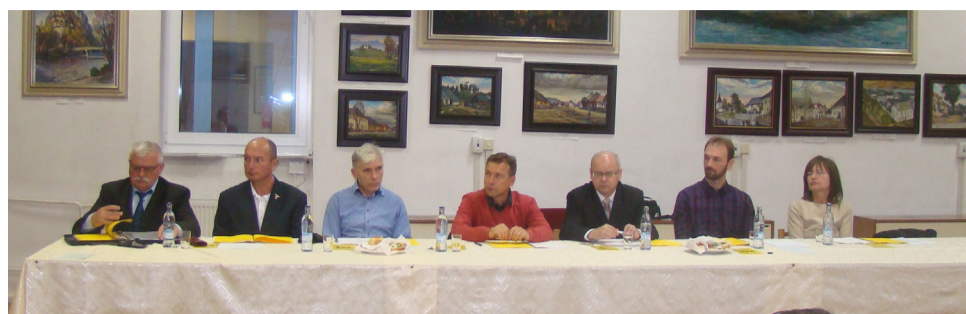
zasadnutí MsZ. Cieľom kontrol je zistiť oprávnenosť výdavkov,

lili. Hlavnému kontrolórovi, v súvislosti s návrhom rozpočtu, uložili pravidelnú mesačnú kontrolu podrobného vyúčtovania príspevkov mesta podľa jednotlivých kapitol a jednotlivých nákladových položiek bežných aj kapitálových výdavkov u príspevkovej organizácie Technické služby. Uznesením si tiež poslanci vyžiadali predkladanie písomnej správy o uvedených výsledkoch kontrol na každom