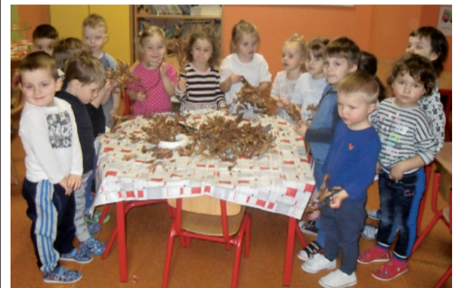
Adventný veniec- spoločná práca triedy Sedmokrásky