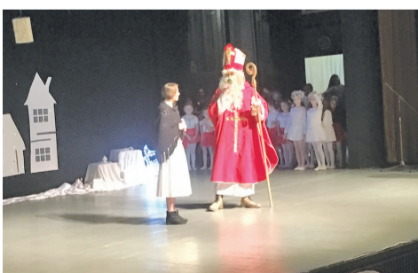
Mikuláš odmenil deti sladkosťami a Marušku jahodami.

rozprávky, ktorá v mrazivom počasi hľadala jahody, po ktorých ju poslala zlá macocha. Deti sa už nevedeli dočkať toho, aby deduška mohli potešiť programom, ktorý si pre neho pripravili. Nechýbalo pestré vystúpenie gymnastiek, tanečníčkov a tanečníkov, divadielko najmenších v anglickom jazyku, mažoretiek, ba pieklo sa aj vo Vianočnej pekárni... Mikuláš, unesený šikovnosťou detí, odkryl košík plný sladkých maškrt a za predvedené výkony ich štedro odmenil. Na-