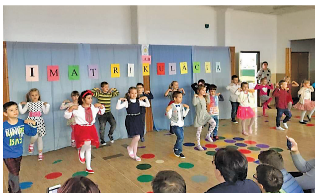
Do spoločnosti žiakov ZŠ Slniečna prváci slávnostne prijatí!

Aj tento rok sme prijímali prváčikov do spoločnosti žiakov Základnej školy, Slniečna, ktorí si pre rodičov pod vedením triednych učiteliek pripravili krátky program. Začali známou piesňou o zlatej bráne, potom recitovali, tancovali, spievali. Vyvrcholením bol slávnostný sľub žiaka prvej triedy, po ktorom ich pani riaditeľka prijala za riadnych žiakov základnej školy. V krátkom prihovore im poprial veľa úspechov v škole a radosť z učenia. Aby so svojou prácou boli spokojní nielen oni, ale aj ich rodičia. Žiaci svoj program ukončili