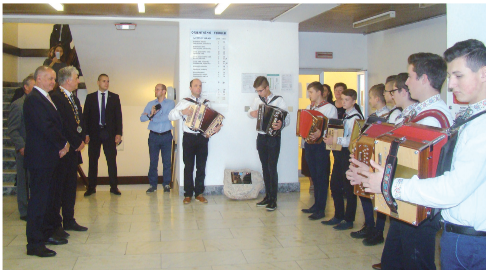
Radosť pozerať na urastených mládenčov ZUŠ, ktorí na heligónkach zanôtili zreska najvyššiemu predstaviteľovi Slovenska i mesta.

V rámci pracovných ciest po regiónoch Slovenska navštívil prezident SR Andrej Kiska 6. novembra Námestovo. Bola to jeho druhá návšteva Oravy – v októbri 2014 navštívil Dolný Kubín, Trstenú a Krivú.