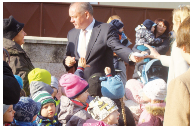
O tom, že prezident mal na návštevu nášho mesta veľmi málo času, svedčí aj táto momentka.

Po krátkom stretnutí s novinármi už prezident A. Kiska doslova bežal k autu, aby stihal ďalší naplánovaný program. Prezidentov krátky pobyt v Námestove a okolí bol určite dobrý na to, aby sa hlava štátu od predstaviteľov samospráv letmo dozvedela, ako a čím žijú ľudia v tejto časti Slovenska. V jeho nabitom programe však chýbal čas, ktorý by prezident venoval aj bežným občanom.