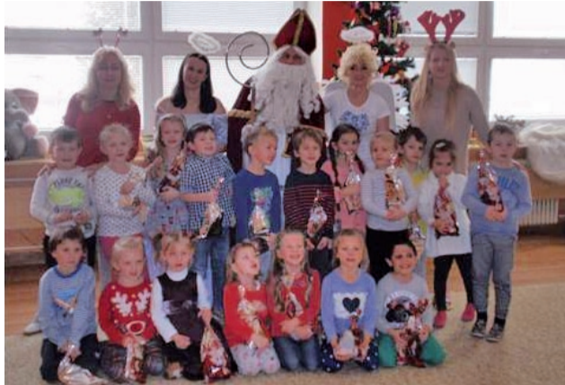
Pamiatka na návštevu Mikuláša zostane v srdciach detí určite aspoň do príchodu Ježiška.