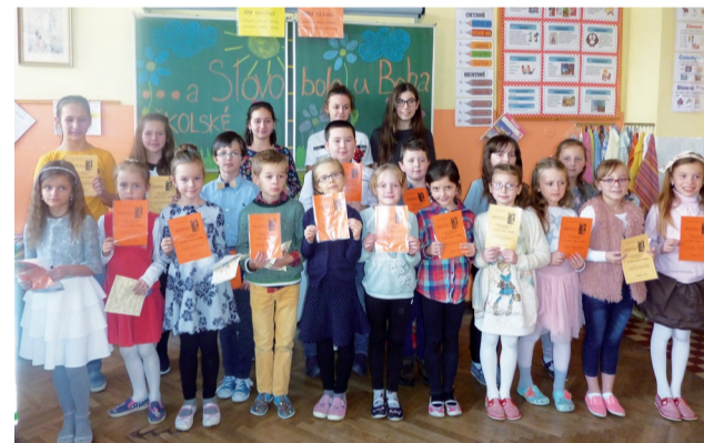
Účastníci školského kola recitačnej súťaže A Slovo bolo u Boha.