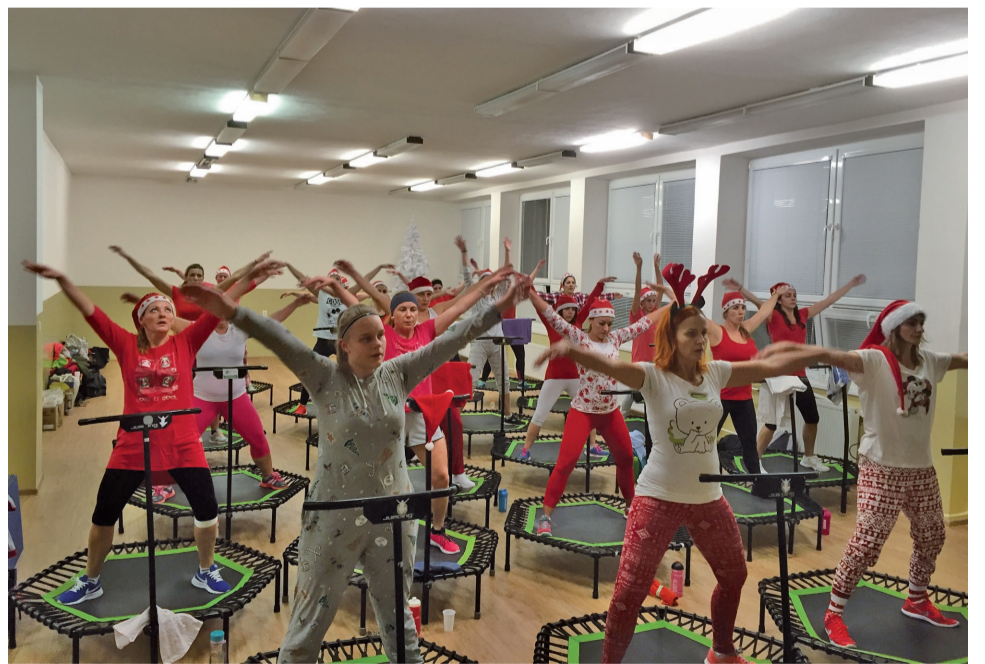
Splnenie sľubu Mikulášovi prinesie jumperkám onedlho ďalšie darčeky – posilnené zdravie a ešte dokonalejšiu figúru.

Nie je pravidlo, že sladké prevkapanie od Mikuláša poteší iba deti. Presvedčili sme sa o tom počas mikulášskej pyžamovej jumping party, ktorú si v Jumping centre v Námestove nenechala ujsť žiadna skalná jumperka. Tento 120-minútový mikulášsky špeciál skákania na trampolínach a posilňovacích cvičení, a ešte k tomu v pyžamkách dal jumperkám poriadne zabrat'. O to viac ich prekvapil príchod Mikuláša a jeho družiny s košíkom plným sladkých dobrôt. Po poctivom odcvičení si zaslúžili doplniť svoju stratenú energiu. Tak ako všetky deti, ani ony nezabudli Mikulášovi prisľúbiť, že sa budú naďalej pravidelne stretávať a pracovať na svojej kondičke. (ak)