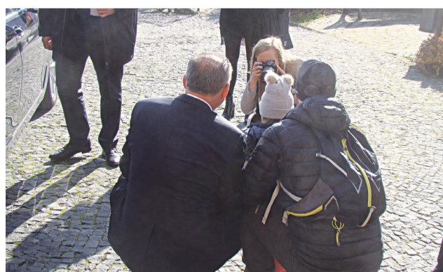
... a ešte pamiatka pre jednu mladú námestovskú rodinku.

Na nábreží priehrady, na mieste, kde extrémista napadol a zbil turistu z Dominikánskej republiky, mal A. Kiska krátku tlačovku s novinármi, a potom sa už ponáhlal, aby stihol ďalší plánovaný program v obci Klin.