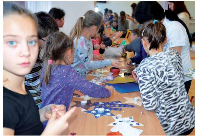
Počas dvoch piatkových popoludní vyrábali šikovné deti v CVČ Maják krásne vianočné ozdoby. Fantázii sa medze nek-

Šikovné ručičky vždy vedia vyčarovať krásne Vianoce. Vlastnoručne vyrobená dekorácia od detí poteší a s radosťou ju postavíme na čestné miesto v našej domácnosti. Počas vianočných tvorivých dielní sa stretli deti v Centre voľného času Maják, aby si vyrobili vianočné ozdoby podľa vlastnej fantázie. Pre veľký záujem sme spolu prežili dve piatkové popoludnia a otestovali si svoje zručnosti v strihaní, lepení, omotávaní, či zdobení výrobkov. Avšak, nie všetko, čo vyrobia, je vždy iba pre nich. Radosť im robí obdarovať aj iných. Deti vo záujmových útvarov vyrobili vianočnú dekoráciu – stromček z detských dlaní - pre členov Jednoty dôchodcov z Námestova. S priánim šťast-