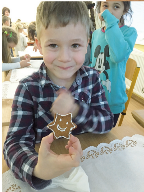
Medovníky sa nielen páčili, ale aj veľmi chutili...

nych zvykoch a tradíciách. Napríklad aj to, že so sviatkom Lucie sa odpradávná spájali rôzne ochranné kúzla a veštby, ktoré sa v detailoch líšili v jednotlivých regiónoch Slovenska. Aby sa predišlo návšteve bosorky, v