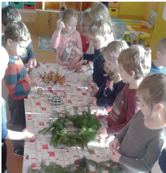
Deti zhotovujú adventné vence.