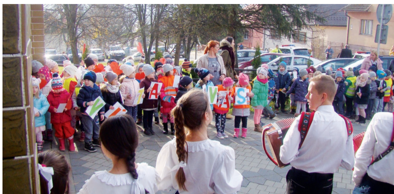
Živý „špalier“ urobili prezidentovi pred mestským úradom deti MŠ.