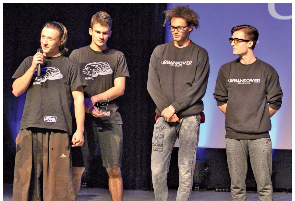
Za klub Parkour a Workout Námestovo bol ocenený trénerský kolektív URBAN POWER.