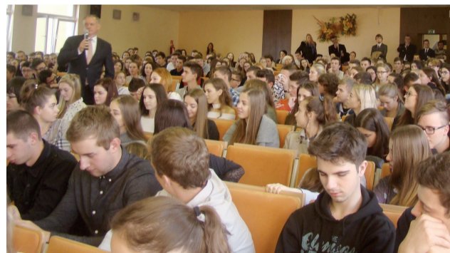
Diskusia prezidenta a gymnazistov v plnej aule bola obojstranne veľmi pútavá.

Prezident má mladých ľudí veľmi rád, aj preto navštevuje v regiónoch Slovenska predovšetkým študentov v školách. Budúce námestovské maturantky však prišli za ním k mestskému úradu, a do školy si ho chceli zaniest' aspoň na fotografiu, keďže hlava štátu návštevou poctila v meste iba gymnázium.