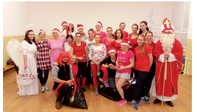
Darcovia detskej radosti z CVČ.