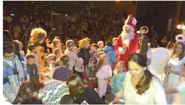
Prítomnosť Mikuláša a jeho sladké darčeky naplnili radosťou deti z CVČ Maják.

Mikuláš neváhal a napriek fujavici a brodeniu v hlbokom snehu v severských krajinách, zavítal aj do Domu kultúry v Námestove, kde ho túžobne očakávali deti z Centra voľného času Maják. Chceli sa predviesť a pochváliť nielen Mikulášovi, ale aj prítomným rodičom pestrým pásmom vystúpení, kde nechýbali spevácke, gymnastické, baletné, mažoretkovské či iné tanečné čísla. Do programu