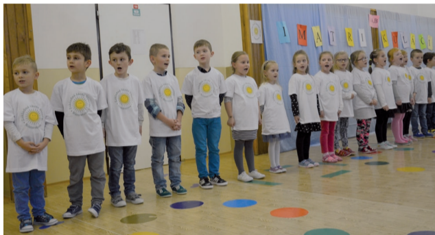
Prijímanie prvákov do cechu žiackeho.