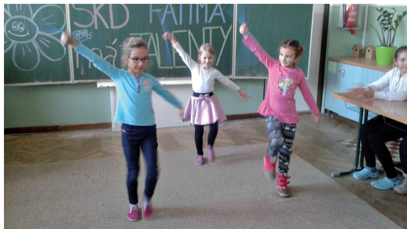
Školské talenty v tanci.

V jedno novembrové popoludnie sa všetky deti z ŠKD stretli v triede, aby ukázali svoje talenty. Prezentácii