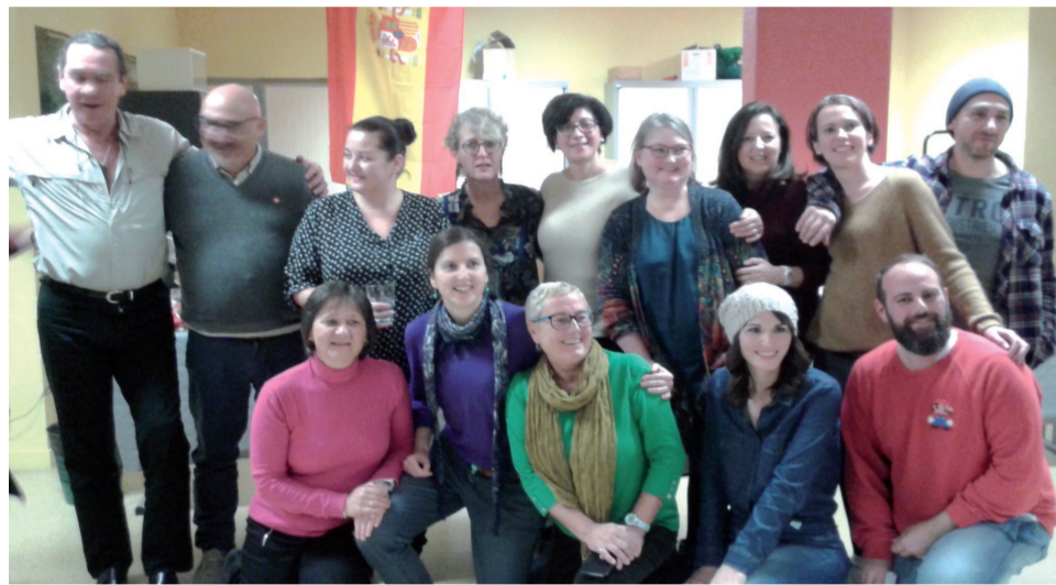
Partneri projektu Erasmus+ sa stretli vo francúzskom meste Mouvaux neďaleko Lille.