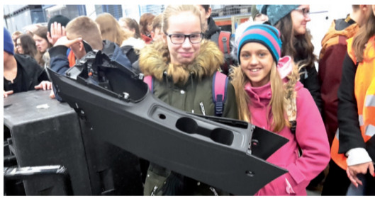
Žiakom sa deň otvorených dverí páčil, získali predstavu, ako to vyzereá v reálnom výrobnom procese v dvoch zahraničných firmách, pôsobiach na Orave.