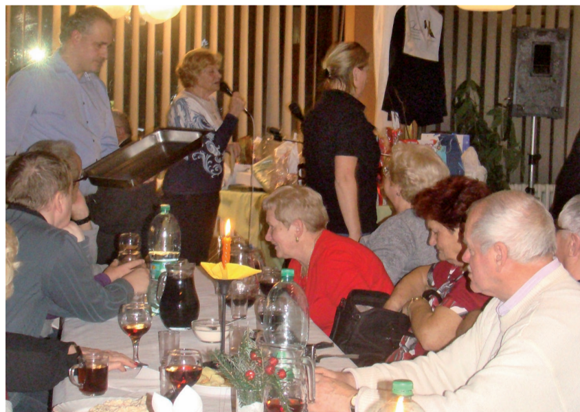
Atmosféra slávnosti, ktorú organizuje výbor JDS v Námestove pre svojich členov, býva každoročne výborná.

o pokoji. Seniori sa ani v tanci nedali zahanbiť.