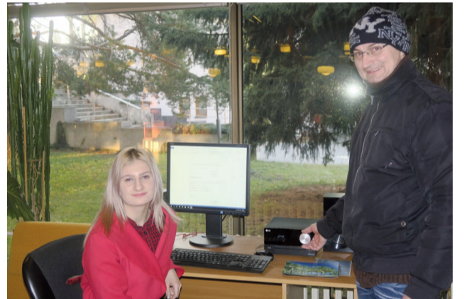
Počítačový kútik v knižnici pohotovo poslúži návštevníkom, ako v tomto prípade, keď si čitateľka (na obrázku) potrebovala napísať životopis do zamestnania. Tento čitateľ sa zas zaujímal o náš CD-mikrosystém.