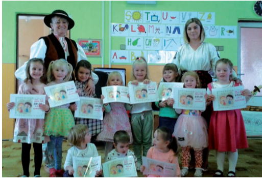
Ocenení speváci.

Deti, ktoré mali odvahu a chuť zaspievať ostatným, boli ocenené diplomom, vecnými cenami a veľkým potleskom. Ostatné deti za spoločné spevy a snahu dostali sladkú odmenu.