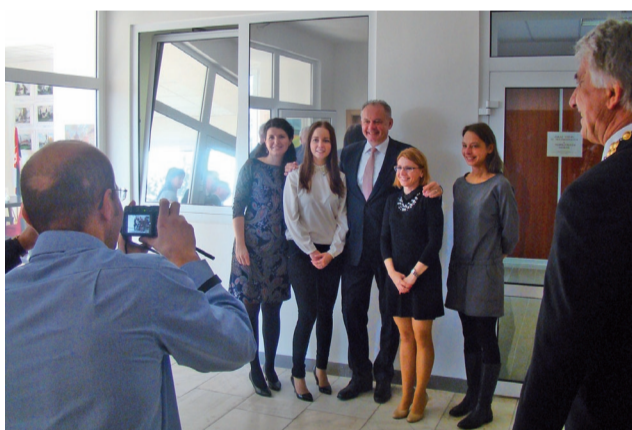
Prezident A. Kiska požiadavke o spoločnú fotografiu vyhovel veľmi rád.