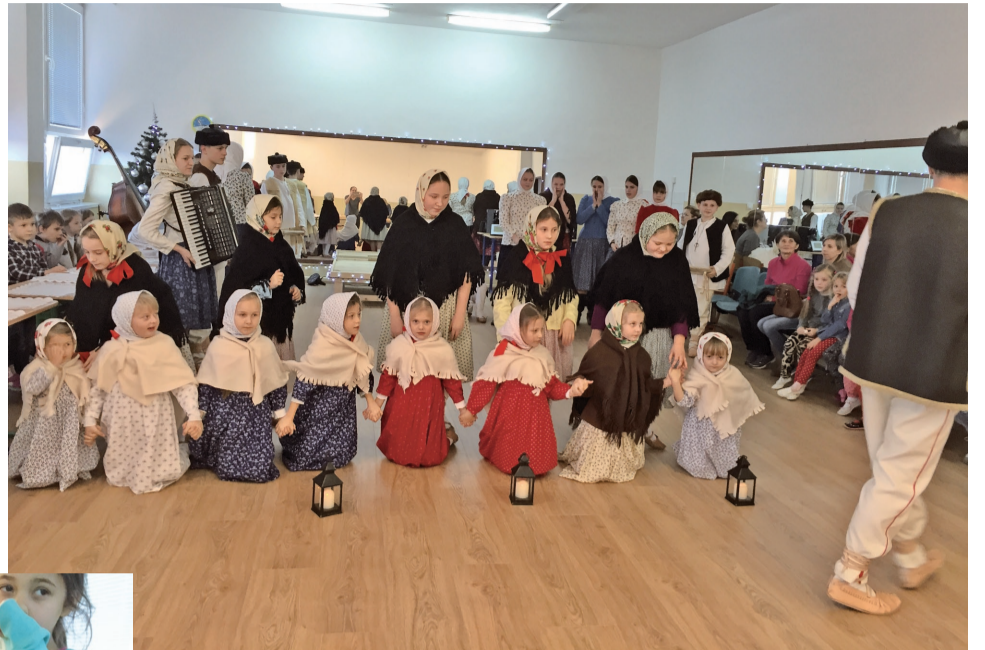
Deti z folklórneho súboru Poludienok z Lokce pripravili v CVČ Maják vianočné pásmo zostavené z prezentácie ľudových zvykov, zaužívaných v minulosti od Ondreja do Vianoc.