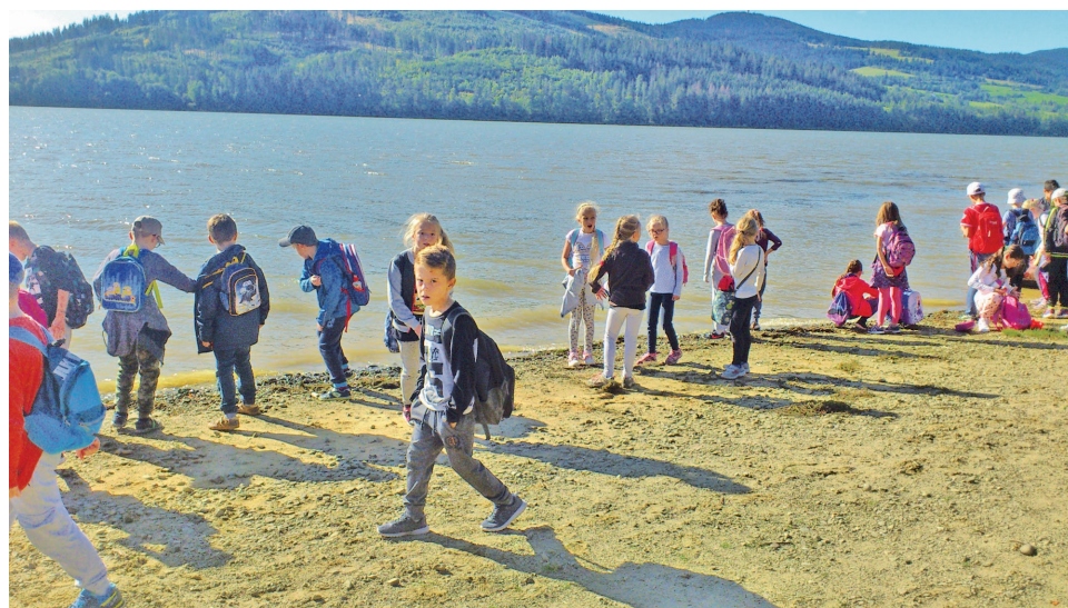
Žiaci 1. stupňa ZŠ Slniečna spojili príjemné s užitočným - počas jedného krásneho slnečného septembrového dňa sa pod vedením svojich vyučujúcich vybrali na turistiku, aby bližšie spoznali mesto.