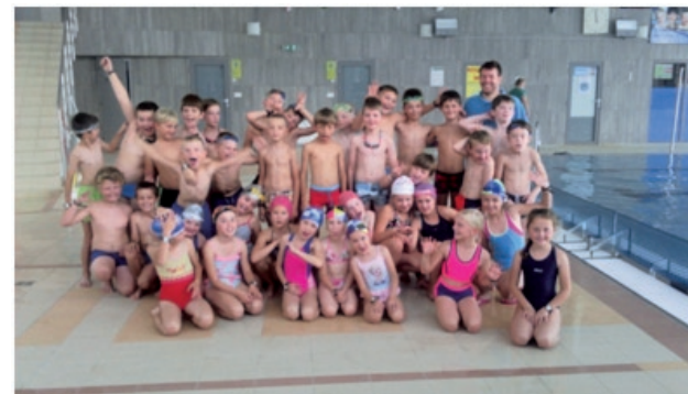
Účastníci výcviku preplávali 25 metrov dlhý bazén za výborný čas a absolvovali aj plavecký maratón.

Mali sme dobrých inštruktorov z plaveckej školy Tuličaník, ktorí sa žiakom naplno venovali a ukázali im, že sa vody netreba báť. Na záver všetci dostali mokré vysvedčenie, sladkú odmenu a to najlepšie, čo žiakov potešilo, bola vstupenka do AquaRelaxu.