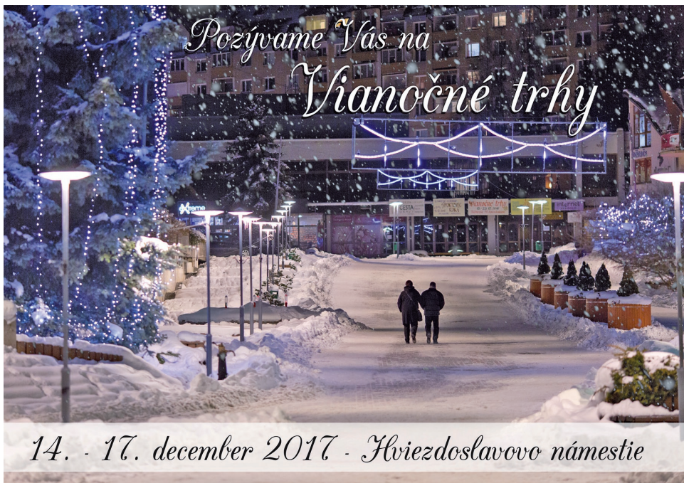
14. - 17. december 2017 - Hviezdoslavovo námestie

priehradu, Slanického ostrova a v prípade dobrého počasia aj Západných Tatier. Z atrakcie sa môžeme radovať vďaka podporenému projektu zo strany Klastra Orava o.o.cr. Celkové náklady na projekt činili 1 800 €. O výrobu nápisu sa postarala firma MB Style. (mk)