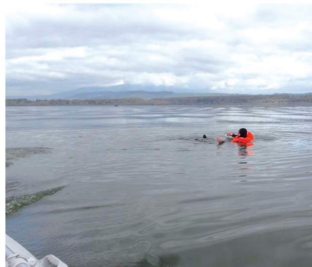
Ukážky z cvičenia na Oravskej priehrade.