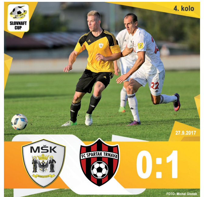
Zápas 4. kola Slovnafit Cup-u bol ozajstným športovým sviatkom.