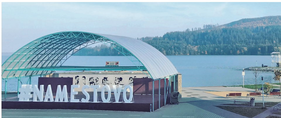
Marketingový nápis bude nastálo umiestnený na ľavej strane U-čka.

fografie sa následne šíria sociálnymi sieťami a vďaka tomu sa propaguje daný región. Nápis #NAMESTOVO bude umiestnený tak, aby sme si v jeho pozadí mohli vychutnať scenériu Oravskej