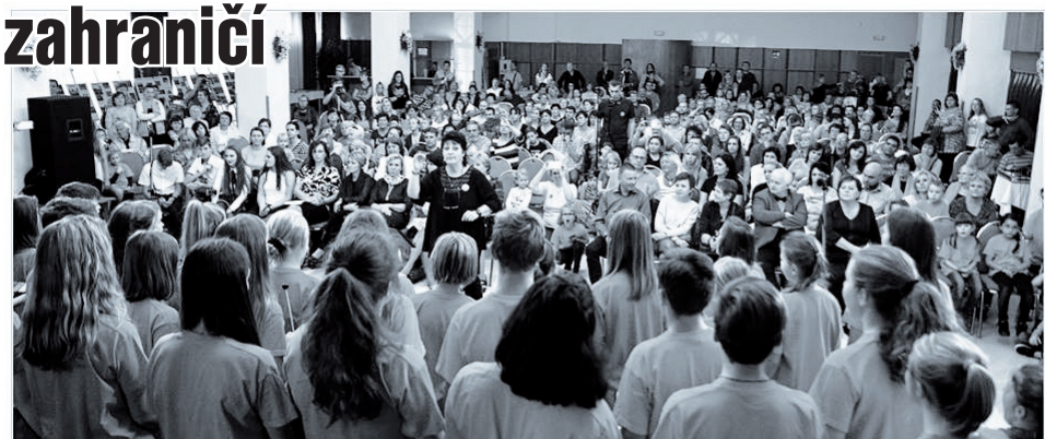
Slávnosť, ktorá zanechala v účastníkoch nezabudnuteľné zážitky.

Pozvanie zúčastniť sa tejto slávnosti prijala aj ZUŠ Ignáca Kolčáka v Námestove. Deti i dospeláci boli pozvaní na spevácku, hudobnú, výtvarnú a dramatickú dielňu. Spoločne vytvorili hudobno - výtvarno - dramatické dielo, ktoré bolo súčasťou hlavného koncer-