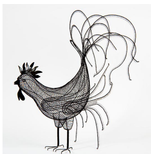
Najväčší záujem verejnosti zo Smržíkových prác pútal drôtený kohút.

na 30 percent, no aj táto tretina ponúka veľkolepú a ohromujúcu architektúru. Mesto by malo byť skompletizované do roku 2030 a už teraz je viac