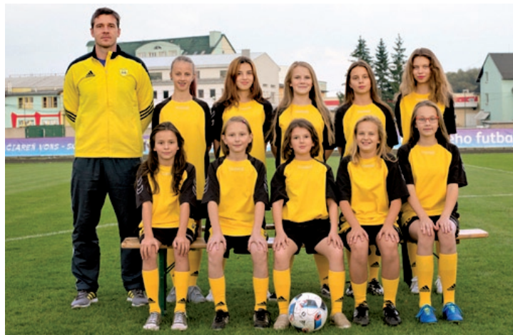
Formujúce sa futbalové družstvo dievčat MŠK Námestovo.

V prípade záujmu o prihlásenie sa do družstva dievčat a žien sa kontaktujte na tel. čísle: 0907 793 478