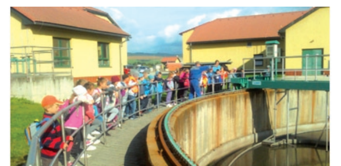
Tretiaci si pozreli čističku a dozvedeli sa, ako toto zariadenie čistí odpadovú vodu.