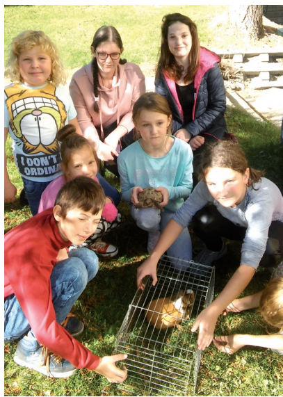
Žiaci chovateľského krúžku zažívajú pekné chvíle pri kontakte so živými zvieratami.

Cieľom krúžkov je zabezpečiť pre žiakov zmysluplné využívanie voľného času. Určite sa tu naučia niečo nové, oprášia niečo staré, alebo jednoducho urobia niečo pre svoju dušu aj svoje telo.