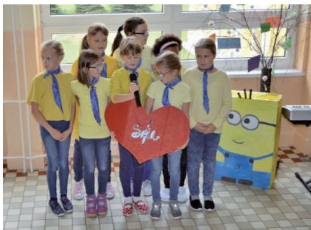
Štvrtáci si v žltých tričkách spievajú po španielsky.

Všetky výkony žiakov boli výborné. Od našich najstarších žiakov bolo milé, že svojim obrovským potleskom podporovali všetkých, hlavne tých mladších. Dodávali im odvahu, boli im oporou, a tak sa nikto nebál a nikto nemal strach ukázať to, čo si žiaci nachystali. Takto sa ukázala silná jednota celej školy. Veríme, že sa na budúci školský rok stretne zas a že opäť vymyslíme niečo nové, pekné a pútavé, čo zaujme celú školu. ZŠ na Ulici Komenského