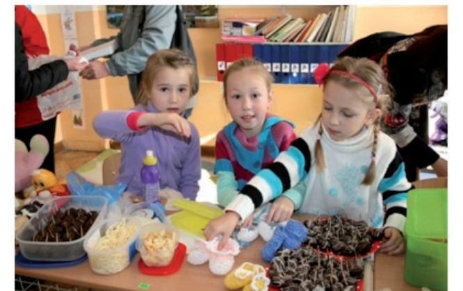
No nekúpte to...

Takým malým skutkom na podporu misií je organizovanie tradičného misijného jarmoku v Cirkevnej základnej škole CZŠ sv. Gorazda v Námestove. Tento rok 27. októbra sa uskutočnil už jeho 18. ročník. Podujatie sa začalo slávením sv. omše vo farskom kostole, potom pokračovalo predajom výrobkov v priestoroch Cirkevnej základnej školy sv. Gorazda. Kúpou výrob-