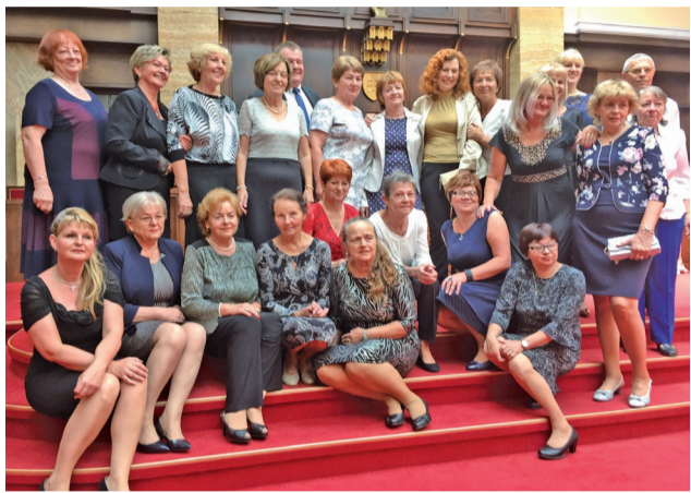
Časť kolektívu prvých absolventov Univerzity tretieho veku v Námestove pri UK v Bratislave.