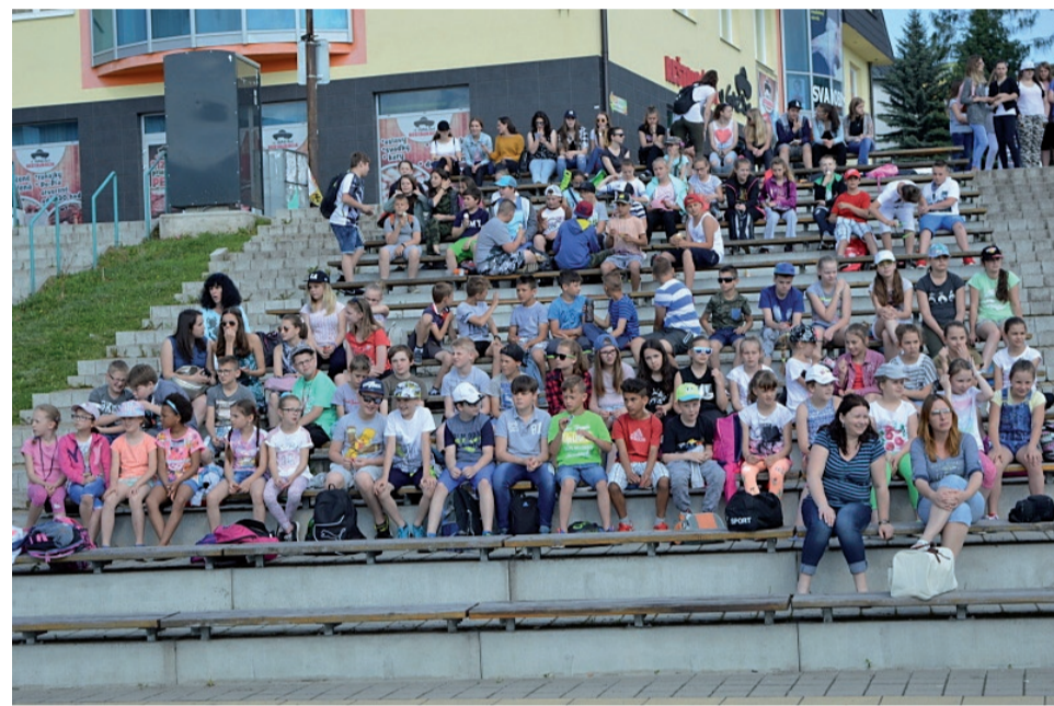
Žiaci ZŠ na Komenského ulici v očakávaní bohatého programu.

Touto cestou chceme vyjadriť vďaka CVČ a ZUŠ Ignáca Kolčáka, ktorí neodmietli a našli si čas, aby nám pomohli takéto pekné podujatie zorganizovať. CVČ ďakujeme za zábavné súťaže a ZUŠ za príjemnú hudobnú