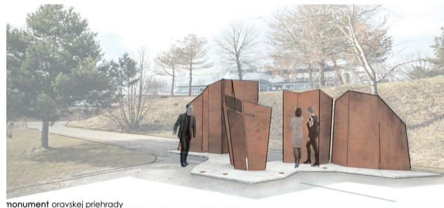
monument oravskej priehrady

Stanovisko vedenia mesta k súťaži: „Úprimne priznávame, že súťaž nenaplnila naše očakávania. Do uzávierky k nám do-