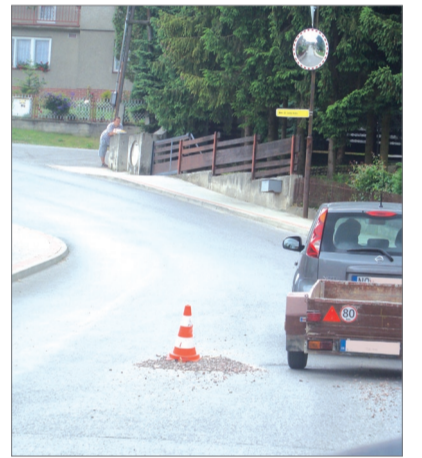
Poškodená vozovka na Mlynskej ulici.