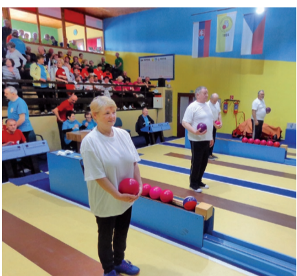
Družstvá MO a OO JDS Námestovo pred začatím súťaže.