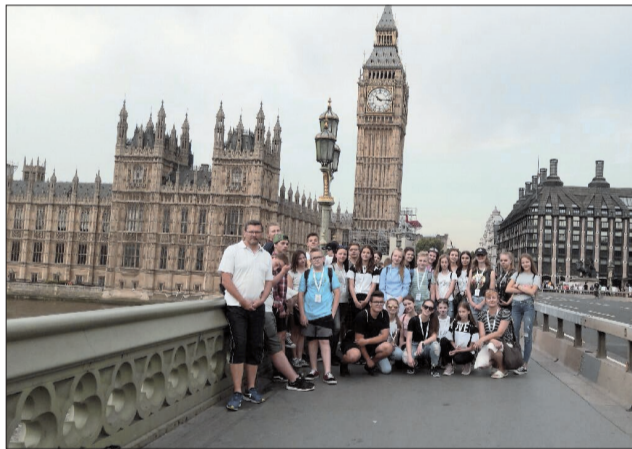
Gymnazisti pred budovou britského parlamentu.

Londýna a hor sa na nulty popoludní! Stáť každou nohou na inej pologuli našej Zeme, to sa podarí málokomu... Nastavujeme si hodinky o hodinku dozadu podľa Greenwichského času a rýchlo ďalej. Zážitok sme mali aj pri prebehnutí tunelom po-