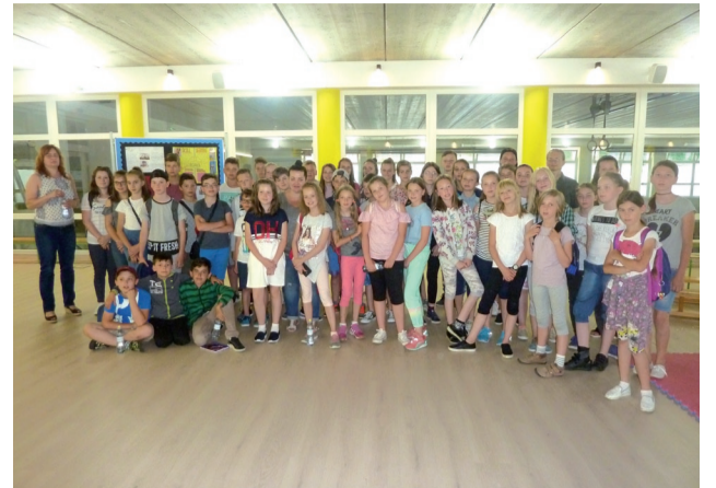
Naši žiaci v „Cambridge“.

Naši žiaci boli pozvaní stráviť v tejto škole jedno doobedie. Prizvali sme k sebe aj niekoľko žiakov zo ZŠ v Babíne a spoločne sme sa vydali na cestu. Na recepcii nás privítali milé pracovníčky školy a zaviedli nás do kongresovej miestnosti na ranné zhromaždenie celej školy. Nádherné priestory sa deťom páčili, najmä ich moderná, presklená telocvična. Počas zhromaždenia vedeného v anglickom jazyku učiteľia vyhodnocovali projekty žiakov. Boli veľmi inšpirujúce,