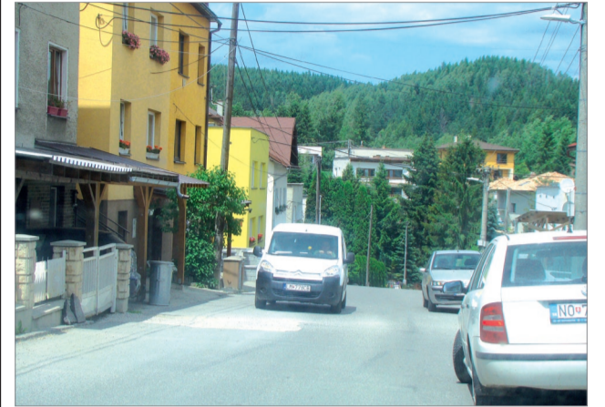
Na Sládkovičovej ulici pred opravou vozovky.

oddialuje samotnú opravu a je otázne, či najnižšia cenová ponuka je, čo sa týka kvality práce, výhra. Čo k tomu dodať? Na Slovensku je to v niektorých právnych úkonoch komplikované, ale možno aj toto krátke verej-