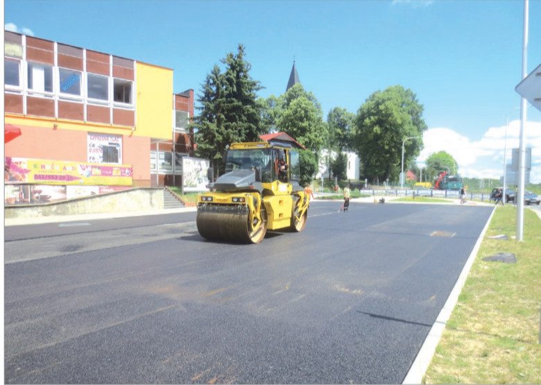
Rekonštrukciou štátnej cesty vzniklo v centre mesta viac ako 100 nových parkovacích miest. Ich úpravu a asfaltovanie však musí financovať mesto z vlastných prostriedkov.

„Od roku 1981, čo pracujem v tejto sfére, sa pripravovala plynofikácia slovenských miest a obcí, okres Námestovo však bol splynifikovaný vari ako posledný na Slovensku v roku 2001. Takže približne 20 rokov sa nerobili komplexné rekonštrukcie ciest, opravovali sa iba najnutnejšie úseky, za tie roky sa problémy nakopili a cesty v meste sú v dezolátnom stave. Od roku 2005, odkedy som vo funkcii, každoročne zrealizujeme opravu niekoľkých ciest podľa ich dôležitosti a stavu. Najprv sme urobili hlavné ťahy – sídlisko Brehy, sídlisko Stred a postupne pokračujeme