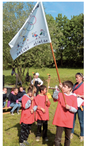
Na čele účastníkov Detských atletických hier nemohla chýbať vlajka.