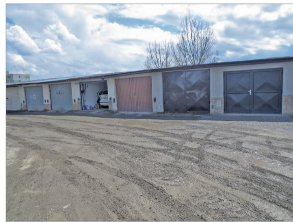
Stav prístupovej cesty ku garážam sa po začatí výstavby bytovo-parkovacieho domu veľmi zhoršil.

Situácia s parkovaním motorových vozidiel na sídlisku Brehy je čoraz horšia. Vedenie mesta sa snaží túto situáciu riešiť už cca 10 rokov. Prebehlo niekoľko výberových konaní na parkovací dom, no ani jedno sa neskončilo úspešne.