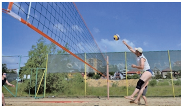
Pohľad na domácich účastníkov turnaja v akcii.