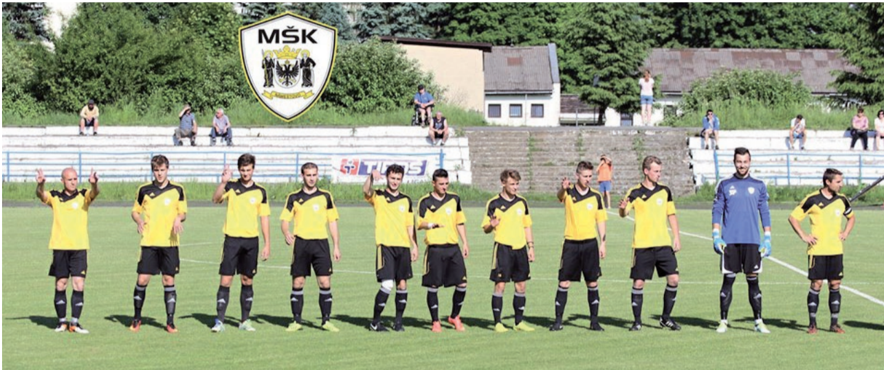
Družstvo dospelých obsadilo v sezóne 2016/17 konečnú šiestu priečku.