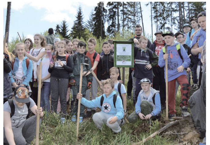
Osadená tabuľka bude informovať, že časť lesa pod Magurkou vysadili žiaci CZŠ v Námestove.