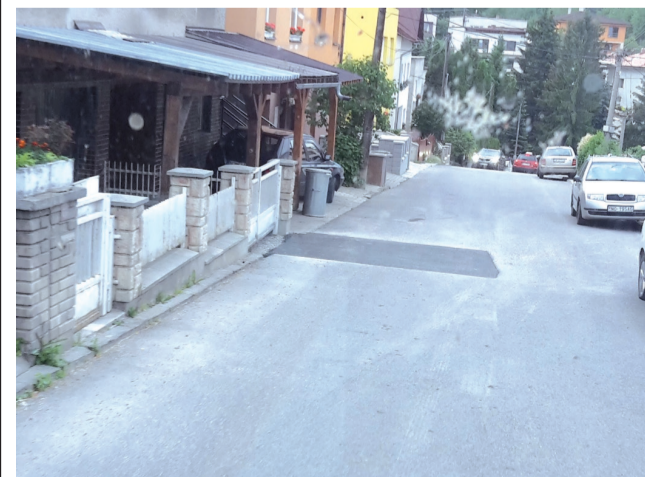
Na Sládkovičovej po oprave 27. júna.