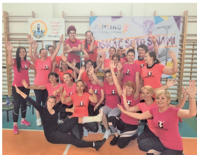
Učarovala im trampolína a piaty rok cvičenia na nej zanechal na cvičenkách určite pozitívne stopy.

Kto ešte nepočul o jumpingu – ide o aeróbne cvičenie na trampolínkach, ktoré posilňuje všetky svalové partie tela, nezaťažuje kĺby, zvyšuje pulzovú frekvenciu, spaľuje veľké množstvo energie, ale hlavne, vracia nás do detských čias. Inak tomu nebolo ani v sobotu 17. 6., keď sa konal I. ročník Jumping show, kde sme počas troch hodín „hoppkania“ doslova vyžmýkali všetko, čo nepatrí do zdravého organizmu. Postaralo sa o to šesť skvelých inštruktorov z rôznych jumping centier okrem susedných z Trstenej, Námestova, Dolného Kubína – Bziny k nám zavítali aj hostia z Čadce a Žiliny. To, čo sa ozývalo z telocvične pri Základnej škole na Komenského ulici, by rozihralo žilky každému okoloidúcemu. Po piatich rokoch cvičenia jumpingu v našom Jumping centre v Námestove, ktoré je súčasťou Centra voľného času Maják, sme sa rozhodli spojiť krásu tela a duše a pokračovať v tom, čo sme začali v roku 2002 a ťahali celých 10 rokov s medzi-