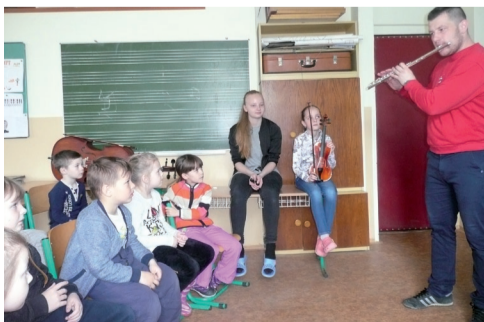
V ZUŠ I. Kolčáka sa deti zoznámili s dychovými hudobnými nástrojmi.