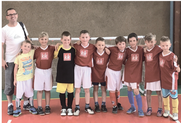
Naši najmladší futbalisti priniesli z Kubína turnajové víťazstvo.