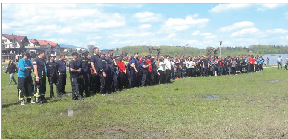
Štrnásteho mája sa v Námestove konala okresná súťaž družstiev DHZ, ktorej sa zúčastnilo 40 kolektívov, z toho 11 družstiev žien a 4 mužstvá nad 35 rokov.