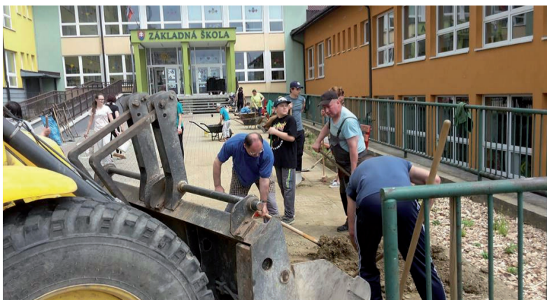
Učiteľia, žiaci a rodičia dali v jednu májovú sobotu nový vzhľad okoliu svojej školy.