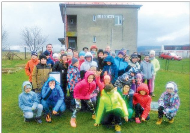
Deti na návšteve meteorostanice v Liesku.