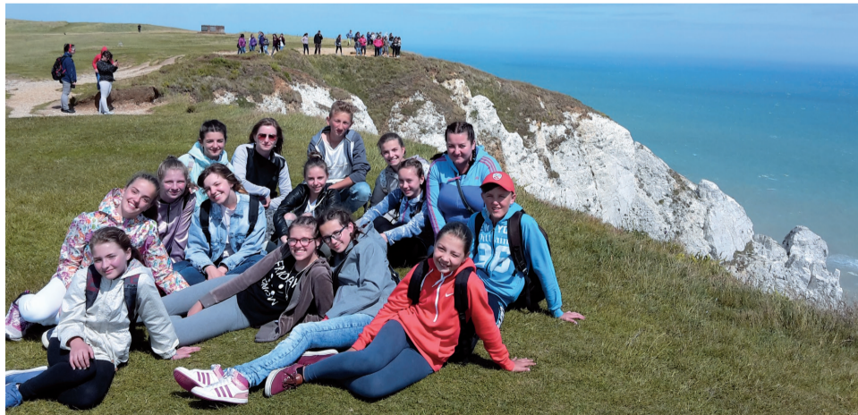
Pri známych útesoch.

Žiaci našej školy absolvovali 6-dňový autobusový zájazd do južného Anglicka. Program bol veľmi pestrý a navštívili sme: Brighton, Hastings, Portsmouth,