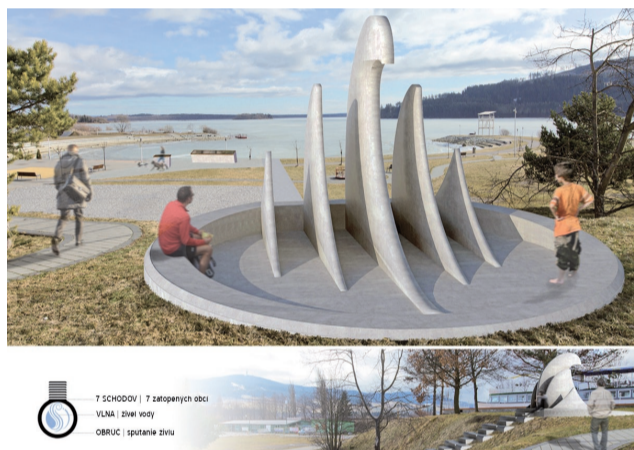
Návrh č.8 obsadil v súťaži tretiu priečku.

tiacich priamo do nebies, ako symbol piatich zaniknutých obcí, nesúci odkaz trpkéj histórie, duši zosnulých aj nádeje do budúcnosti. Ide o veľmi zaujímavú ideu a atraktívny pohľad