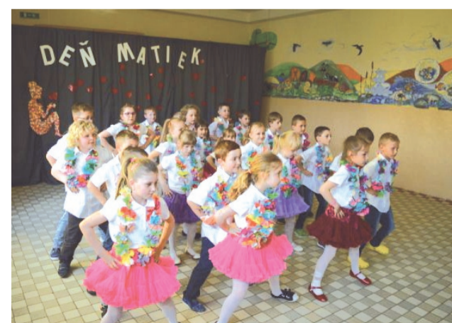
Z vďaka všetkým mamám...

Prváci sa predstavili veselým tancom, druháci zarecitovali básničky, tretiaci majstrovsky zvládli tanec na ľudovú notu, štvrtáci predviedli spartakiádu a