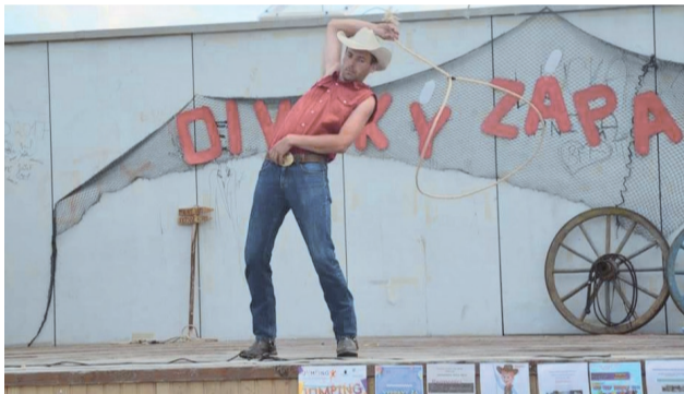
Ukážky s lasom boli pre deti veľmi zaujímavé.

Takmer ako na Divokom západe sa cítili deti, ktoré sa zúčastnili osláv Dňa detí vo westernovom štýle. Prvá júňová nedeľa na Nábřeží Oravskej priehrady patrila všetkým, ktorí sa chceli aspoň na malú chvíľu stať kovbojmi a naučiť sa niečo nové o týchto silných a odvážnych mužoch, ktorí zväčša pozerali na svet z konského sedla. Náročné westernové zručnosti prítomným predvedlo westernové zoskupenie Túlavi vlci. Okrem zaujímavých ukážok s lasom a bičom si pre deti pripravili aj detské ródeo a nechýbala ani strelba z westernovej vzduchovky a luku. Ďalším hosťom podujatia bola tanečná skupina Harlekýn z Nižnej. Tanečnice svojím dynamickým vystúpením rozprúdili krv prítomných