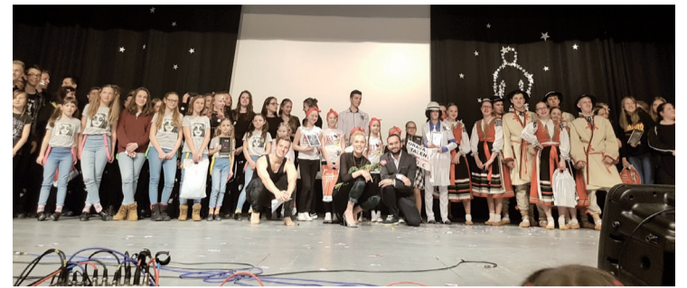
Účastníkov súťaže Orava má talent súťaživosť medzi sebou nerozdelila, naopak, vzájomne sa podporovali a vytvorili nové priateľstvá.