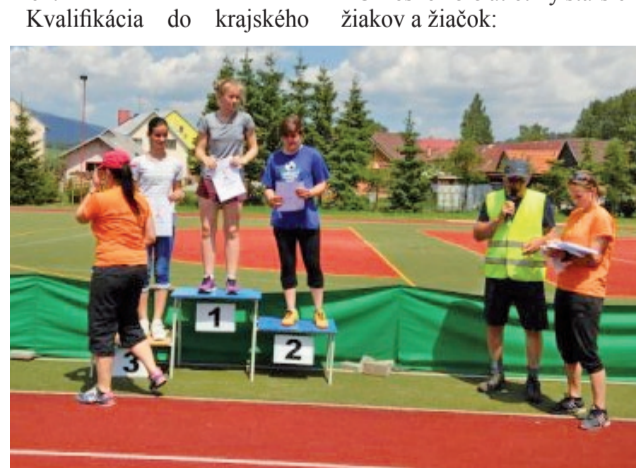
Úspešní športovci ZŠ na Komenského ulici.

V máji a júni sa konali rôzne športové súťaže, v ktorých dosiahli žiaci ZŠ na Komenského ulici pekne úspechy. Vo veľmi silnej konkurencii škôl z oravského regiónu v okresných a krajských súťažiach sa im podarilo vybojovať miesta na stupienkoch víťazov. V skratke prinášame tie najvýraznejšie z nich: