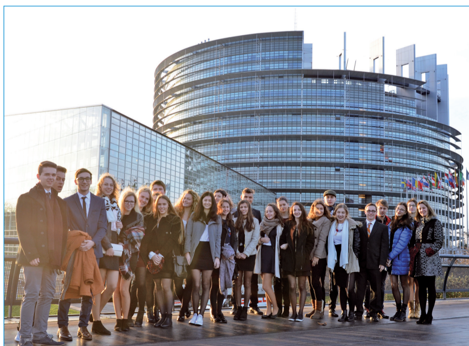
Pred Európskym parlamentom.

svoje nemecké jazykové znalosti. Každého asi potešilo aj múzeum Porsche či návšteva hradu. Deň D - návšteva parlamentu. Bol to nezabudnuteľný zážitok - pracovať s rôznymi Európanmi, alebo ich počúvať v rokovacej sále. Za svoju ťažkú prácu sme dostali aj certifikáty a trička na pamiatku. Bol to neopísateľný zážitok. A ten najpozitívnejší deň bola návšteva bombastického zábavného parku Europa Park, kde sme si mohli pomiešať všetky svoje myšlienky, navštíviť väčšinu európskych krajín, spoznať ich zvyky a ochutnať ich kuchyňu. Nik neodišiel naprázdno, všade boli stánky so suvenírmi. A nakoniec nikto nemohol odísť bez toho, aby neochutnal tú typickú nemeckú Currywurst s pečivom. Proste jedna báseň. A v sobotu večer sme už len cestovali domov na Slovensko plní vedomostí, radosťou a nových zážitkov a skúseností.