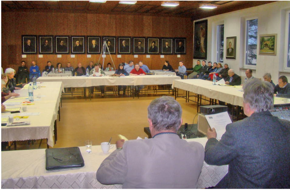
Rokovacia sála mestského zastupiteľstva je ako jeden veľký pracovný stôl, zložený z poslancov, vedenia mesta, pracovníkov úradu i občanov v početnom zastúpení. Na tomto stole bola aj tentoraz vážna téma – budovanie inžinierskych sietí pre individuálnu bytovú výstavbu, ktorá ľudí zaujíma vari zo všetkých tém najviac a na rokovanom stole zastupiteľstva bola za ostatné roky už veľa ráz. Ešte tam zostane, poslanci sa k nej vrátia na pracovnom rokovaní.

Do rozpočtu bola zaradená žiadosť riaditeľov základných škôl, žiadajúcich o spolufinancovanie projektu z výzvy, ktorú vyhlasuje ministerstvo školstva. Výška jedného projektu, o ktorú budú žiadať je 250 000 eur. Spolufinancovanie je vo výške 5%, čo činí 12 500 eur na jeden projekt. Spo-