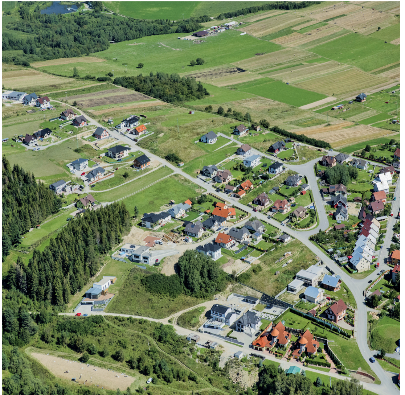
Výstavba inžinierskych sietí pre IBV je veľmi nákladná a neefektívna, hustota zástavby je malá, trvá dlho, náklady na údržbu a prevádzku sú každoročne veľké.