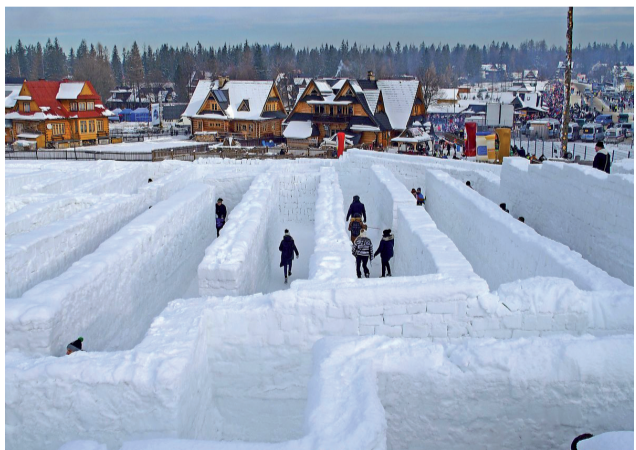
Zakopanský zimný labyrint, atrakcia, ktorou sa poľské zimné turistické centrum výrazne zviditeľnilo.

Ďalšie informácie poskytneme na uvedených kontaktoch: telefón: 043/5581241, 0905943340 email: zsnobrehy@mail.t-com.sk