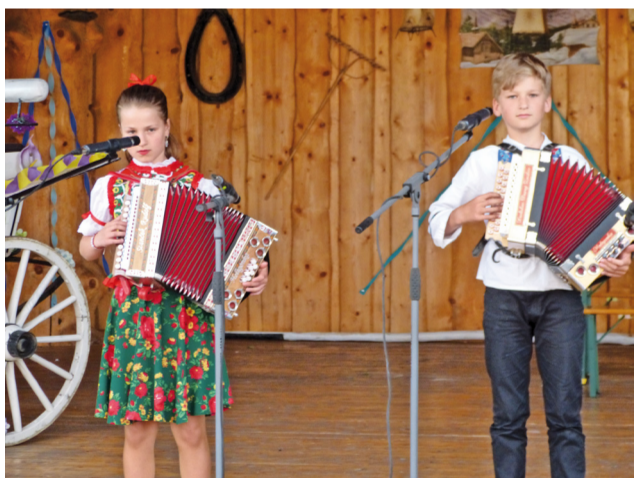
Heligonkári zo ZUŠ I. Kolčáka aj počas prázdnin obveselovali srdcia návštevníkov rôznych kultúrnych podujatí.