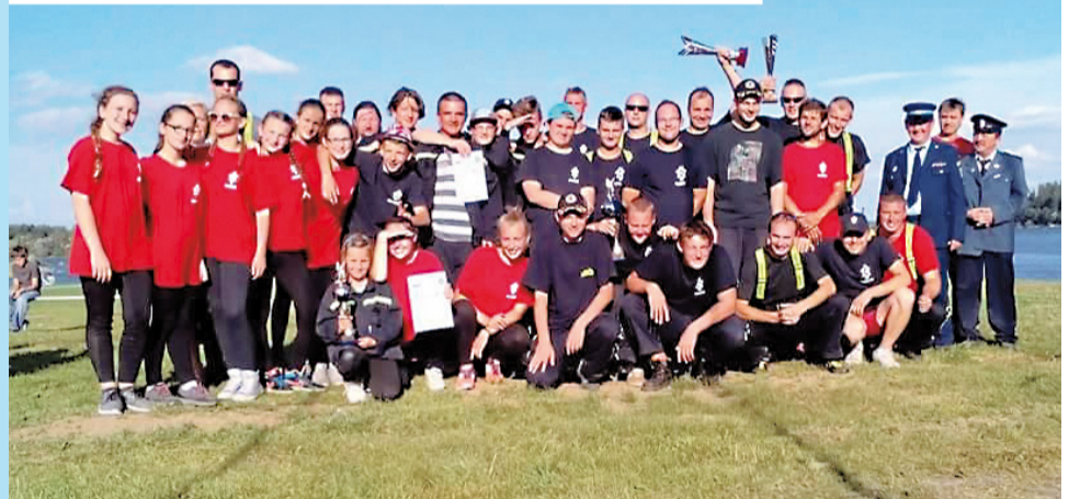
Členovia DHaZZ Námestovo bodujúci v súťažiach – na fotografii družstvá detí, mužov, mužov nad 35 rokov a bývalí členovia zboru.

Hasiči divákovi predviedli, ako sa bojovalo s požiarmi pred sto rokmi - na požiarnej striekačke - „starej dáme“ z roku 1927 ťahanej koňmo.