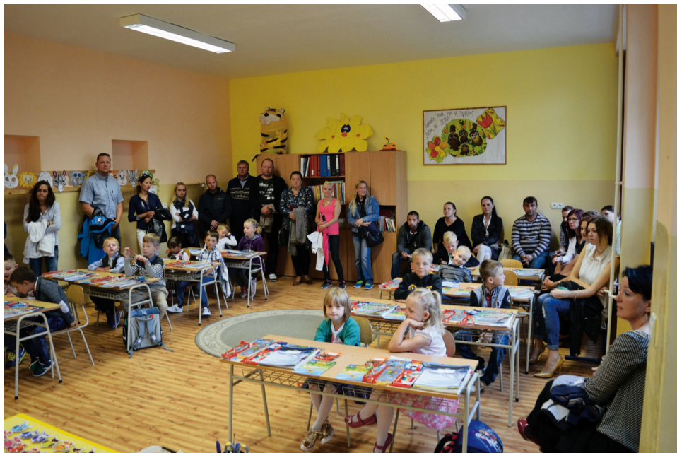
Prváčikovia prišli do svojej vyzdobenej triedy prvýkrát ešte v sprievode rodičov.

Piateho septembra sa mnohým deťom začal nový život. Privítali nový školský rok. Do ZŠ na Komenského ulici pribudlo 29 prvákov. Prvý deň s očakávaním sedeli v laviciach a v ručičkách zvierali kytičky kvetov. Nedočkavo čakali na svoje učiteľky. Na začiatku ich privítal riaditeľ školy