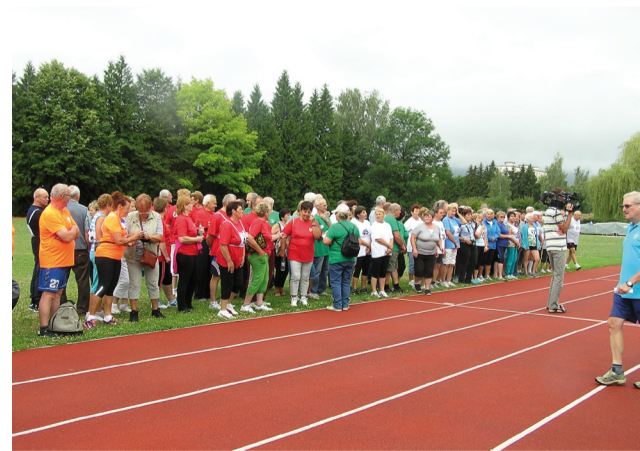
Účastníci krajských športových hier v Martine.