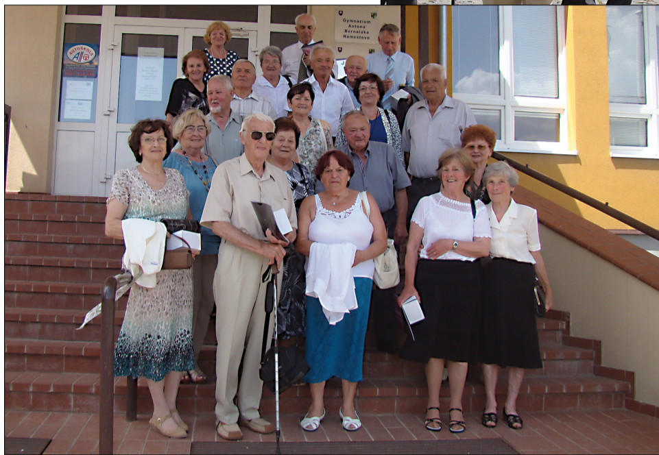
Prví absolventi Jedenásťročnej strednej školy v Námestove – Gymnázia Antona Bernoláka.

výchove. Že priehradou sa zmenila aj Orava, že sa naučí využívať prírodné podmienky a vodu, že sa tak podstatne zmení životný štýl v tomto regióne. Nebudem hodnotiť,