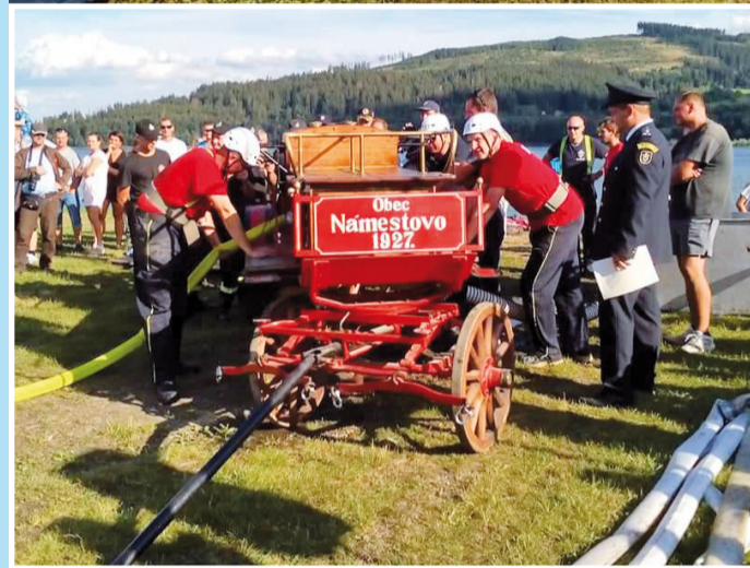
Požiarneho útoku mužov Námestova v kategórii nad 35 rokov, ktorí v súťaži získali 2. miesto.