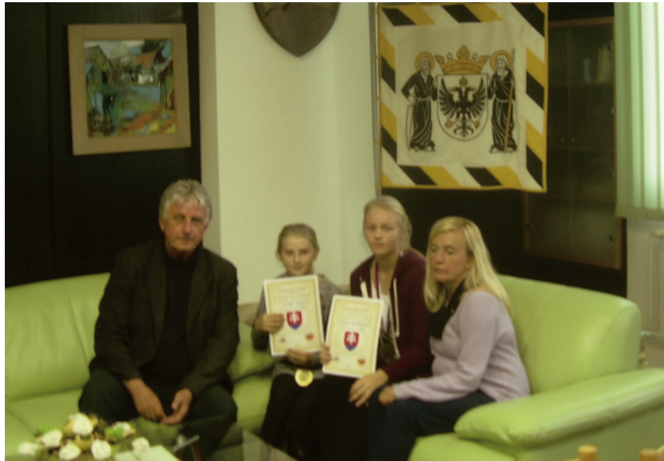
Prácu i výsledky víťazných turistiek a ich trénerky ocenil aj primátor mesta.