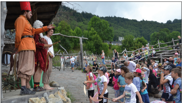
Leto v CVČ Maják bolo plné dobrodružstiev.

výletu do rozprávkovej krajiny v Habakukoch, podnikli sme „mokrú“ výpravu do susednej krajiny, vžili sme sa do kože indiánskych bojovníkov. Leto