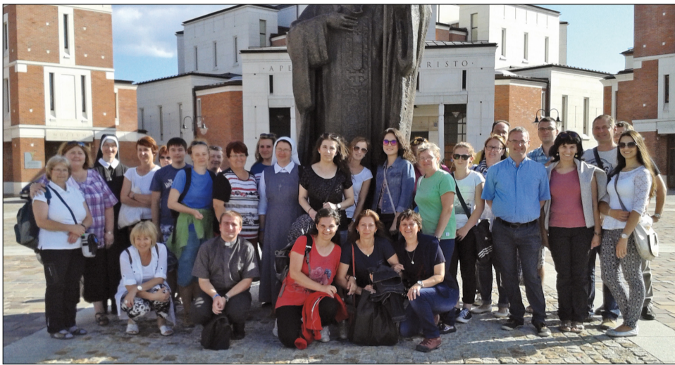
Účastníci púte k žriedlu Božieho milosrdenstva do Krakova.