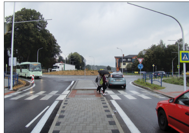
Súčasný pohľad na križovatku.