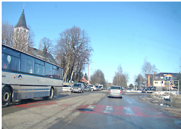
Pohľad na križovatku pri kostole pred rekonštrukciou.