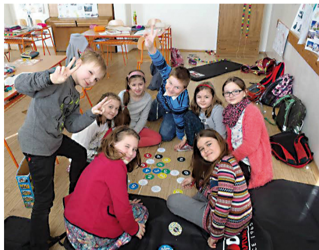
ZŠ na Slnčnej ulici je škola plná aktivít.

V popoludňajších hodinách sú k dispozícii tri oddelenia ŠKD a 20 záujmových krúžkov. Škola sa môže popýšiť peknými a priestranými učebňami, o ktoré sa delí so Základnou umeleckou školou a aj moderným športovým areálom.