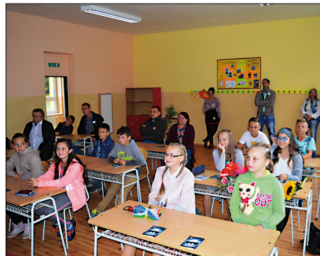
Športová trieda so zameraním na futbal a gymnastiku.