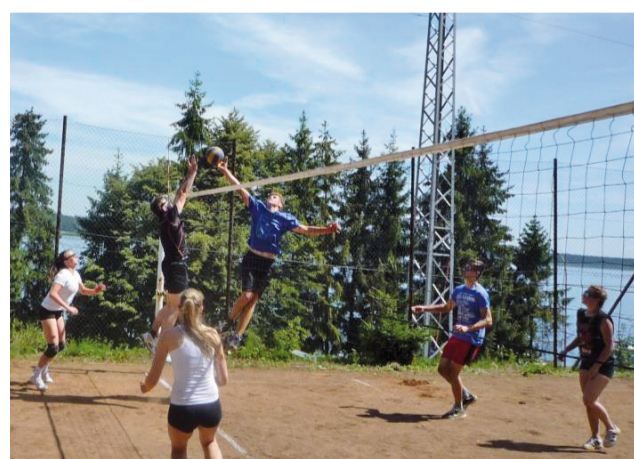
V zápale hry.