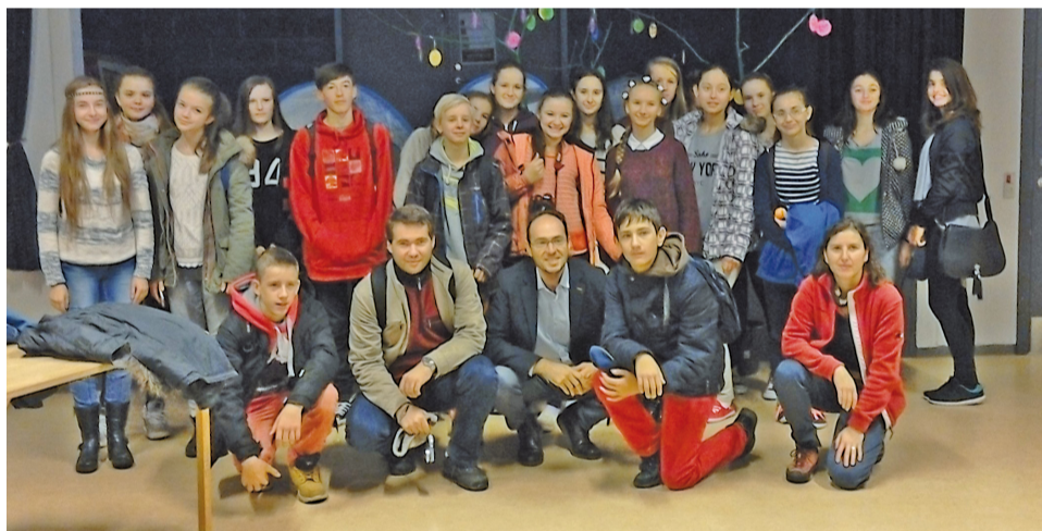
Účastníci výmenného pobytu si z Dánska priniesli veľa zážitkov, poznatkov a precvičili jazyk.