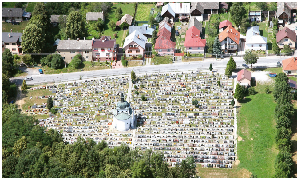
Letecký pohľad na cintorín v Námestove z roku 2013.