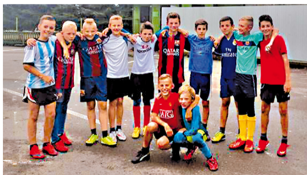
Družstvo U13 na tréningovom výbehu v prírode.