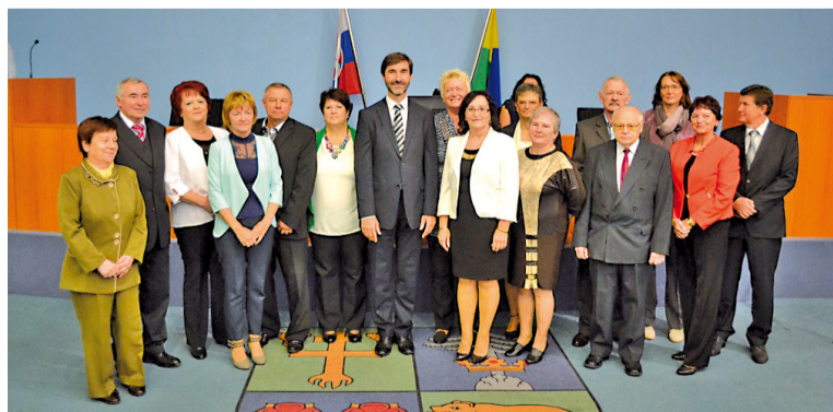
Pracovníci v zdravotníckych zariadeniach v zriaďovateľskej pôsobnosti ŽSK, ktorých prácu ocenilo vedenie Žilinskej župy. Polovica z nich sú Oravci.