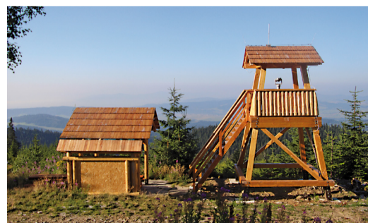
Rozhľadňa s ďalekohľadom, náučný chodník Slaná voda - Babia hora.