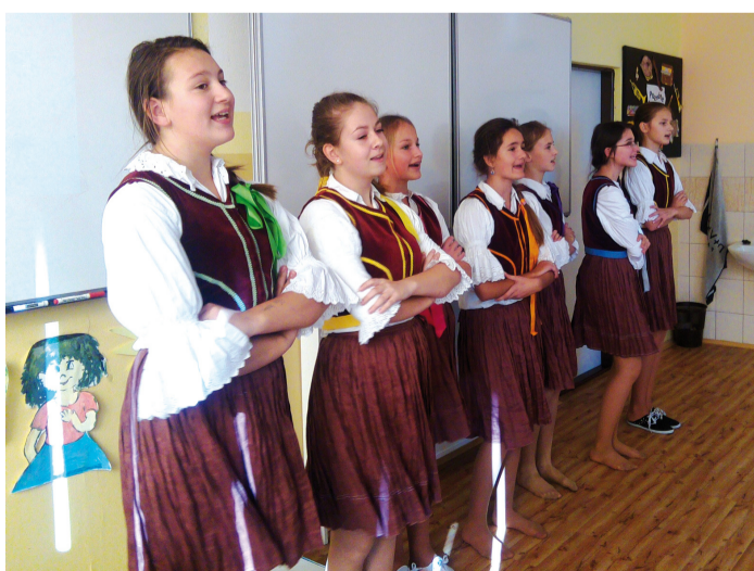
Deviatky zaspievali spolužiakom dobové piesne v dobových krojoch.

riešení vedomostných úloh vystriedali súťaže zamerané na rýchlosť a postreh. Poskladat názov prvých novín napísaných v slovenčine či portrét Ľ. Štúra, čítať štúrovčinu alebo hra Milionár podnietili v žiakoch súťaživosť, spoluprácu a navodili aj uvoľnenú atmosféru. Deviatacke zborové „Mor ho“ sa ozývalo celou školou a „Kopala studienku...“ na záver hodiny bola skvelou bodkou narodeninovej oslavy hodnej osobnosti, akou bol a stále je Ľudovít Štúr.