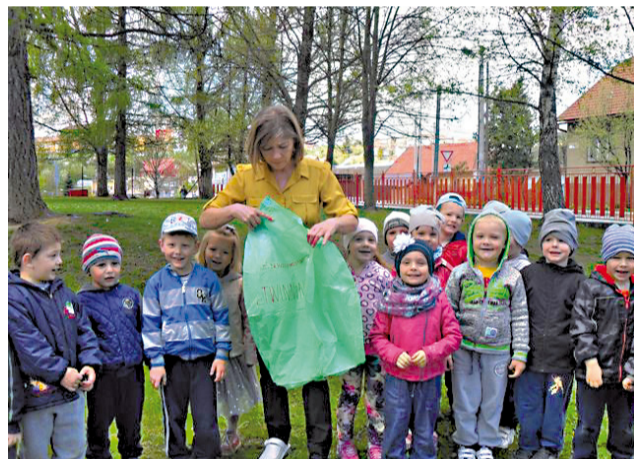
Do programu medzinárodných internetových partnerstiev škôl sa pred rokmi zapojila aj MŠ na Bernoláčkovej ulici a deti i učiteľky majú z toho osôh i radosť.