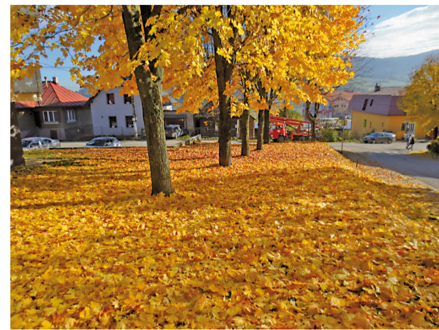
Zlatý koberec z padnutého lístia pohľadza dušu.

zberom lístia. Zosekané vetvy stromov na malé kúsky sú na manipuláciu, prepravu, ale aj premenu na kompost omnoho praktickejšie. Do budúcnosti