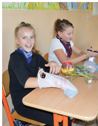
Šikovné dekoratérky.

Komenského ulici sa stretli v populárnych hodinách, aby využili