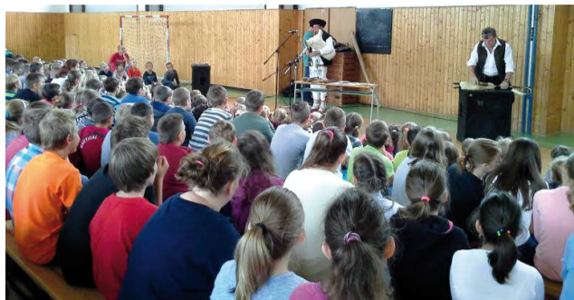
Gajdy poznali už starí Gréci. S týmito i ďalšími ľudovými hudobnými nástrojmi sa žiaci ZŠ na Slnecnej ulici bližšie zoznámili na nedávnom výchovnom koncerte.