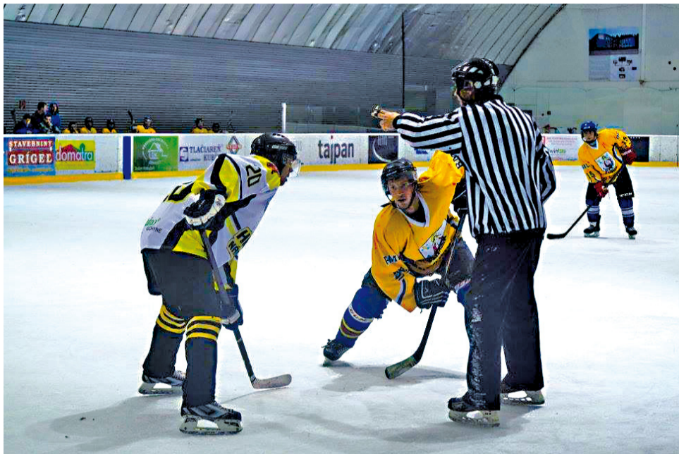
Zápasové buly medzi hráčmi Liesku (v žltom) a HK MTS Námestova (v bielom). Po konečnej sŕeňe sa z víťazstva tešili hráči Námestova v pomere 7:5.