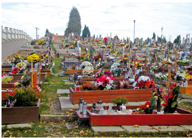
Hoci sa cintorín pomaly zaplňa, miesta pre zosnulých je na ňom prakticky stále dosť i pre ďalšie generácie.

V roku 2009 si mesto dalo spracovať Účelovú mapu cintorína, so zakreslením všetkých hrobových miest. V tom čase bolo 716 jednohrobov, 483 dvojhrobov, 32 trojhrobov a 3 štvorhroby, čo spolu predstavovalo 1790 hrobových miest. Celý cintorín má plochu 13184 metrov štvorcových. Keď počítame ročne priemerne 40 pohrebov, k uvedeným