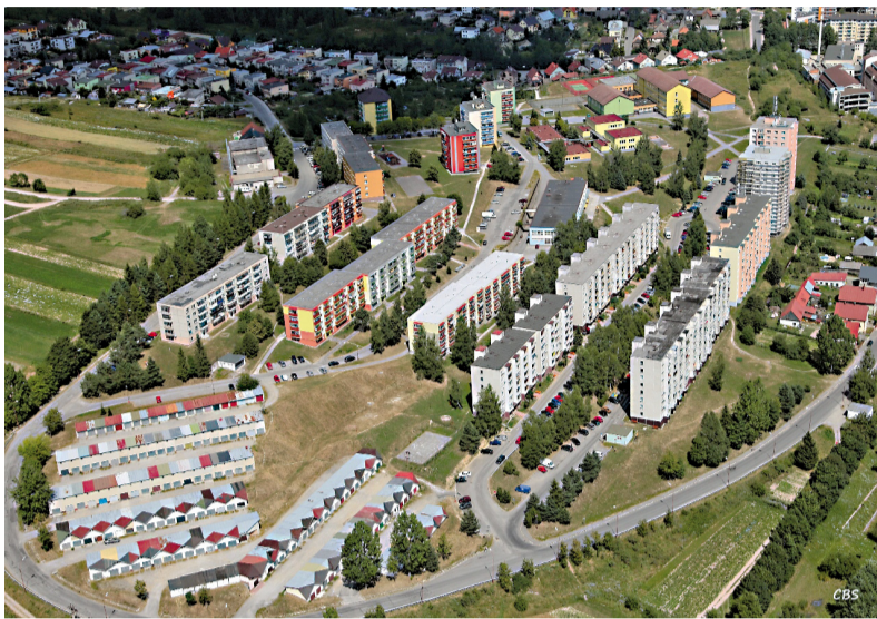
Bytový podnik Námestovo plánuje v roku 2016 na Sídlišku brehy kompletnú výmenu všetkých rozvodov a odovzdávajúcich staníc. Na tomto sídlisku má sídlo najväčšia kotolňa bytového podniku.