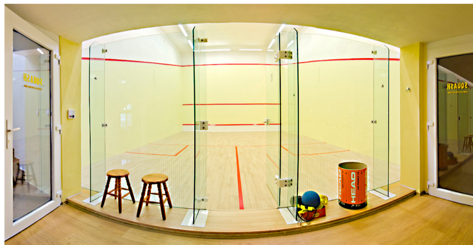
Takto vyzerá squashové ihrisko v penzióne Korytnačka. Pri návšteve vám radi požičajú aj potrebné vybavenie.