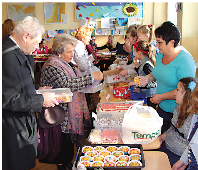
Myšlienka podpory misií prostredníctvom misijného jarmoku ľudí oslovuje stále viac.