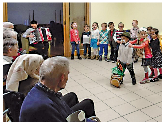
Najviac vedieť potešiť srdcia starých práve najmenšie deti. Z vystúpenia predškolákov z MŠ na Komenského ulici.

prírody, ale krásni starí ľudia sú umelecké diela.“ Všetkým už od mala deťom túto myšlienku a udržiať ju v nás si túto peknú tradíciu, no nielen v mesiaci október, ale i vo všedné dni.