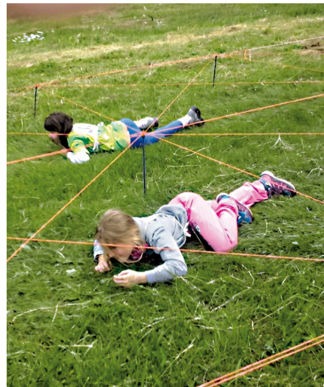
Podliezanie pod lanami je jedna z najobľúbenejších detských disciplín.

Ak vás zaujíma, ako vlastne vyzerá taká súťaž PTZ, vedzte, že ide o beh lesom, ktorý je označený farebnými stužkami. Jednotlivci plnia počas behu úlohy na jednotlivých stanovištiach a odpoveď si zapisujú do štartovného preukazu, niektoré