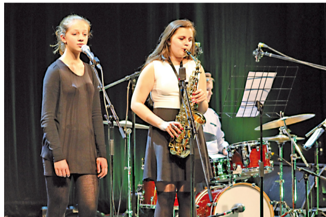
Na Orava Jazz festivale sa už tradične prezentovali aj talentovaní žiaci ZUŠ I. Kolčáka.