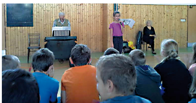
Opera a opereta nie je nudný hudobný žáner ani pre deti a mládež, ak je podávaný zaujímavo.

koncertu Gajdovačka sme sa o tomto tradičnom ľudovom nástroji, ako aj o fujare, píšťalke či píšťalke dvojačke mohli dozvedieť viac.