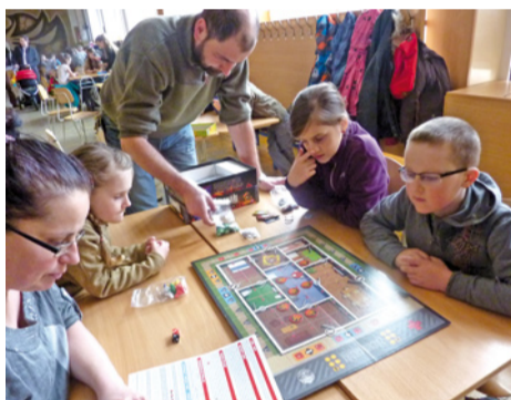
Po hrách počas nedeľného popoludnia deti odišli domov, ale hry v školskom klube zostali. Vďaka sponzorovi budú deti tešiť aj naďalej.

Nášmu sponzorovi a všetkým, ktorí boli súčasťou tejto perfektnej nedele ĎAKUJEME !!! (czš)