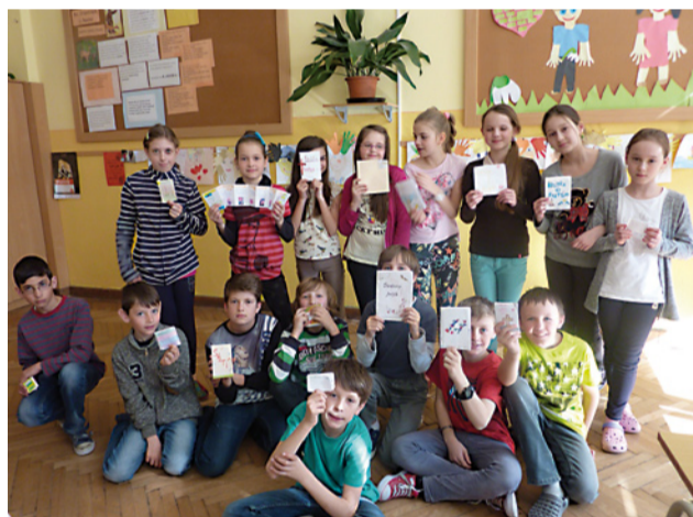
Piataci so svojimi knižnými výtvarmi.

Úlohu splnili všetci žiaci a ich práce boli v triedach vystavené na nástenkách. (MK)