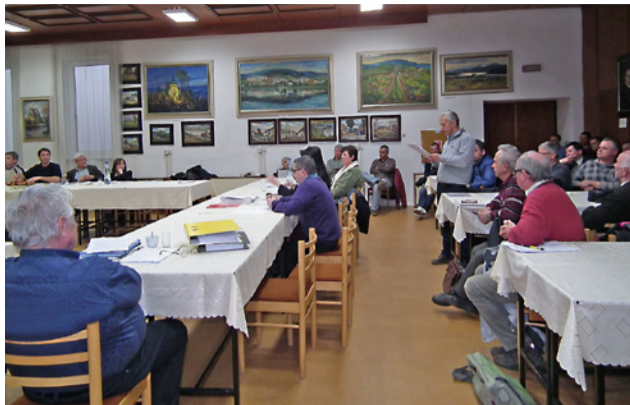
Na trikrát rokovalo MsZ o územnom pláne mesta - za aktívnej účasti členov urbáru.

Začiatkom tohto roka sa konečne celý proces ukončil a bolo potrebné záverečné schválenie spracovaného dokumentu mestským zastupiteľstvom. Na rokovaní zastupiteľstva 11. 3. sa však dostavili noví predstavitelia námestovského Urbáru, ktorí chceli zásadným spôsobom zasiahnuť do schvaľovaného dokumentu a to tým, že žiadali vylúčiť rekreačnú zónu Grúniky, nachádzajúcu sa v katastrálnom území Námestovské Pilsko, kde má Urbár svoje pozemky a kde sa už v súčasnosti nachádza lyžiarske stredisko. Nekompromisné a často emotívne vystúpenia zástupcov urbáru zneistili aj poslancov mestského zastupiteľstva v tom, či je možné takýto zásah do