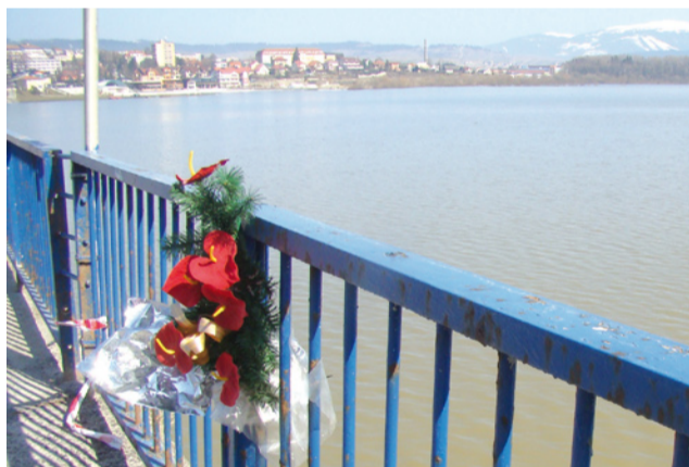
Podobných pietnych miest, v podobe krížov a umiestnených kahancov je na priehradnom moste a blízko neho niekoľko.

miestnosti sa niesla pieseň od Zuzany Smatanovej a Adama Ďuricu - miesta a chodba s čakajúcimi i podporujúcimi stíchla a všetci s prižmúrenými očami pozorne načúvali tónom jej vystúpenia. Napokon sa otvorili dvere a z nich to jemne žieňa vyšlo s úprimným úsmevom. Aj keď nikomu z účastníkov v ten deň nebolo oznámené, či uspel, teda postupuje, alebo naopak, zvíťazili všetci - nad samými sebou. Hoci tu prišlo, a takto isto zvíťazilo, len pár z talentovaných Oravcov.