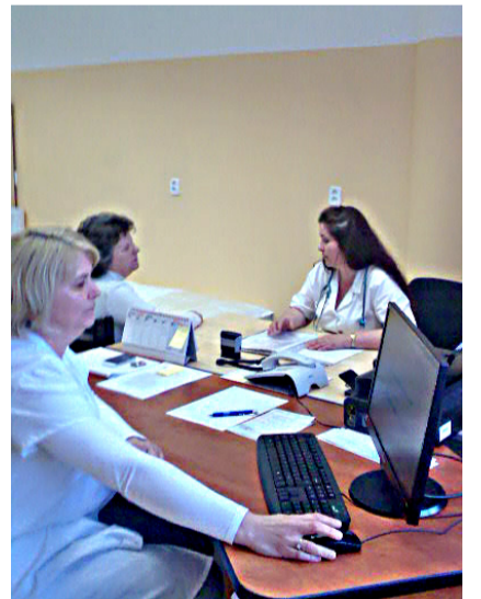
Ošetrovanie pacienta na nefrologickej ambulancii.

Pacienti z Námestova zatiaľ navštevujú stredisko dialýzy v Trstenej, ktoré prevádzkuje spoločnosť B. Braun. Naším cieľom je umožniť im lepší prístup k zdravotnej starostlivosti, ktorú potrebujú, priamo v mieste ich bydliska. Aj keď nám predstavitelia spoločnosti B. Braun navrhovali, aby sme sa vzdali nášho zámeru otvoriť dialýzu v Oravskej poliklinike Námestovo, pretože prevádzka bude podľa ich argumentácie nerentabilná,