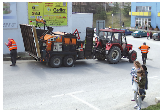
„Žehlička“ na opravu ciest.