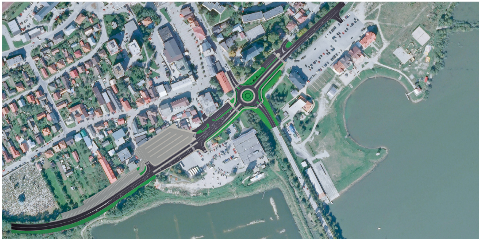
Vizualizácia hlavného cestného ťahu Námestovom.