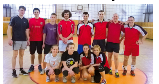
Na fotografii Taktic (2. m) a Drzakamenci (8. m)

1-8, 2-7, 3-6 a 4-5. Po odohraní dvoch vzájomných zápasov postúpili do semifinále víťazi štvrtfinálových súbojov. Semifinále sa hralo už systémom na dva hrané zápasy a na tri víťazné sety. Zo semifinálových duelov vzišli dvojice družstiev, ktoré hrali o 3. a 1. miesto. Bronzovú medailu si v zápase proti Tornádu vybojovali Celebrity po výsledku 3 : 0 (22,22,15). Putovný pohár víťaza mestskej