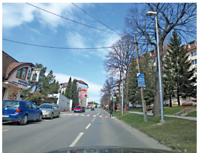
Blízko priechodu pre chodcov pri kultúrnom dome bol pre lepšie osvetlenie postavený nový stĺp s výložníkom a reflektorom.