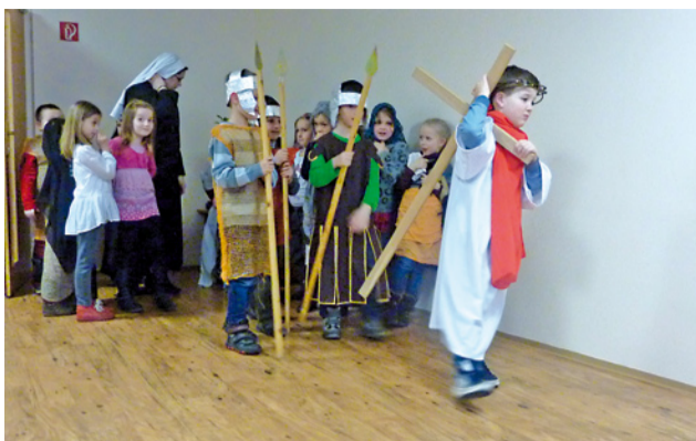
Pohľad na krížovú cestu, originálnu tým, že ju „hrali“ - pr- váci!

Pred Veľkou nocou počas pôstneho obdobia si žiaci z 1. B triedy CZŠ sv. Gorazda pod vedením triednej pani učiteľky sr. Kristiány nacvičili hranú krížovú cestu. Každý jeden prváčik svoju úlohu zahrál perfektne. Nebolo to len divadielko, ale aj modlitba. Krížovú cestu sa s nami modlili okrem žiakov primárneho stupňa aj naši starkí v CSS v Námestove. Bola to pekná príprava na najväčšie sviatky zmŕtvychvstalého Pána.