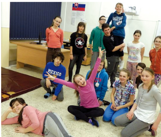
Šiestaci a siedmáci po duchovnej obnove boli síce fyzicky unavení, ale plní radosti a energie.