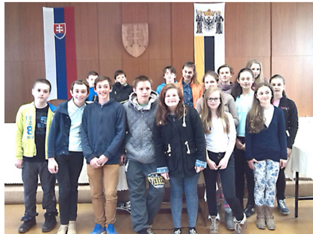
Žiaci v zasadačke mestského úradu.