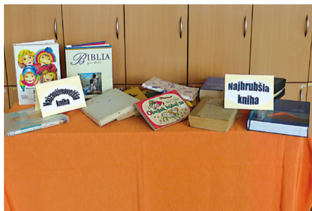
Kráľovné súťaže – knihy.