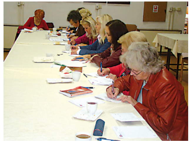
Prvý ročník štúdia Univerzity tretieho veku majú jej študenti v Námestove práve za sebou.

Kto si chce udržať mladého ducha, nech príde medzi súčasných študentov školy. (da)