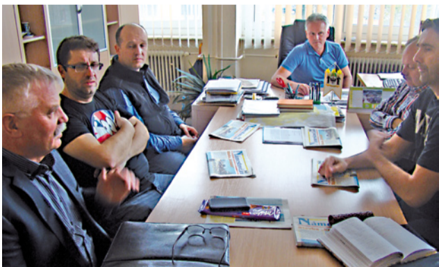
Redakčná rada sa tradične schádza v priestoroch kancelárie prednosta MsÚ, zasadá dvakrát ku každému vydaniu novín.

Redakčná rada sa venovala obsahovej štruktúre novín a rubrikám, ktoré by mohli obohatiť stránky Námestovčana, zodpovednosti a úlohám členov rady pri naplnení obsahu novín a schválila termíny vydania Námestovčana v roku 2015. (r)