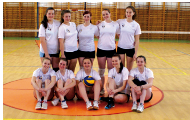
Časť družstva žien TJ Oravan Námestovo v OVL žien.