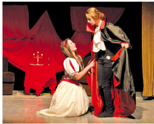
Z absolventského vystúpenia „Keď gróf rozkáže čarovat“.

Náš najmladší odbor (otvorený v r. 2007) vychováva z detí a mladých ľudí budúcich amatérskych divadelníkov, režisérov, dramaturgov, recitátorov, moderátorov, no predovšetkým vzdelaných a aktívnych účastníkov a spolupracovníkov kultúrneho života spoločnosti. Rozhľadných a náročných divákov a aktívnych čitateľov.