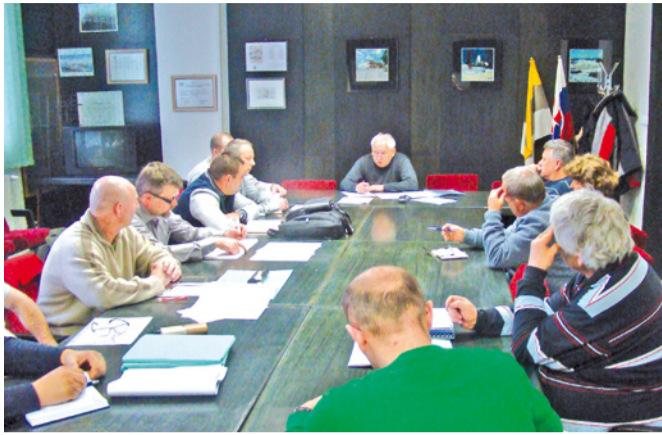
Hlavnou problémovou témou kontrolného dňa 31. marca bola vysoká hladina priehrady.

Ľudia v Námestove i na celej Bielej Orave čakali najmä na kruhovú križovatku pri kostole v Námestove, ale i odľahčenie SAD a kvalitnejšiu komunikáciu mestom celých osem rokov, až sa – vo februári 2015 dočkali kladného rozhodnutia: Ide sa budovať! A keď stavbári rozbehli práce, vplyvom dlhodobějších lejakov a bohatej snehovej nádielky na prelome zimy a jari sa zdvihla hladina Oravskej priehrady. O vyše metra, čo znamená, že v nádrži pribudlo o viac ako 60 miliónov m 3 vody! A to stavbárom spôsobuje problém pri budovaní 350 metrov dlhého oporného múru a posúvaní súčasnej komunikácie o cca 12 metrov smerom k priehrade pozdĺž celou vodnou nádržou. Konštatovali to zainteresovaní na kontrolnom dni v Námestove v posledný marcový deň. A akoby sa príroda chcela vysmiať plánovaným termínom všetkým - ktorí chcú cestu budovať i tým, ktorí ju chcú čo najskôr užívať, z oblohy sa začal sneh počas kontrolného dňa priam kydať, ako možno nikdy počas tejto zimy, a nasledujúce dni sa mu takmer úplne pripodobnili. Snehové