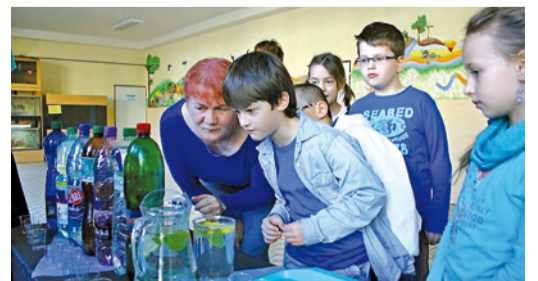
Aj ochutnávku minerálnej vody sme si na ZŠ Komenského pripomenuli Svetový deň vody.