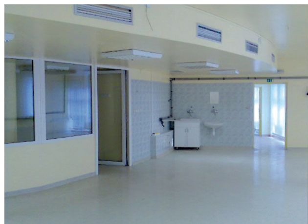
Dialyzačné pracovisko Oravskej polikliniky.

uistili sme ich, že pokiaľ sa nám bude dariť poskytovať služby a hospodáriť aspoň tak, aby sme pokryli náklady, budeme spokojní. Prvoradým motívom na zriadenie tohto pracoviska nie je výška zisku. Ľudia v Námestove dialýzu potrebujú a my robíme všetko pre to, aby sme pacientom regiónu mohli poskytnúť čo najdostupnejšiu kvalitnú zdravotnú starostlivosť.“ (lá)