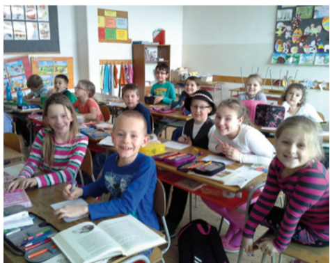
Maratón čítania rozprávok sa deťom páčil.