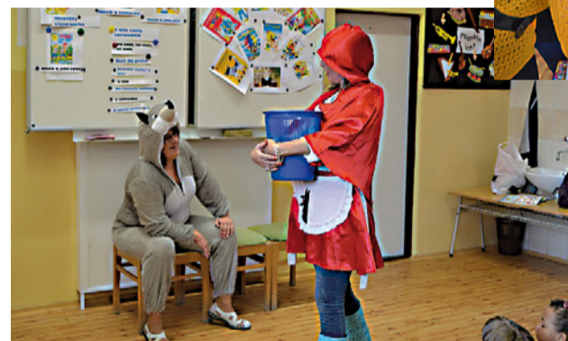
Pani učiteľky hrajú rozprávky naopak

ni zahrali rozprávky naopak pani učiteľky, ale oni ich hneď opravili a prečítali ich správne. (Veď sú to najšikov-