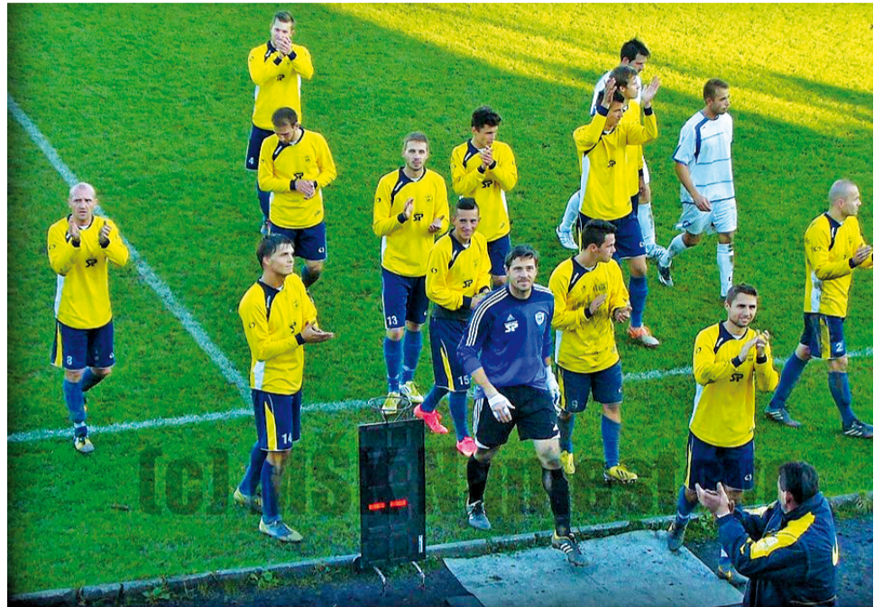
Hráči A-mužstva po poslednom zápase ďakujú fanúšikom MŠK.