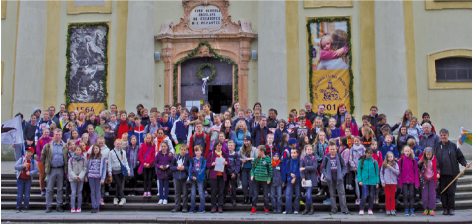
Na púti do Šaštína bolo do 150 účastníkov, žiakov a učiteľov CZŠ sv. Gorazda.

Nech nás, naše rodiny aj všetkých dobrodincov sprevádza mocný príhovor našej Nebeskej Matky! (CZŠ)