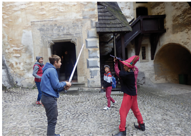
Chlapci ako stredovekí rytieri.

Teplé jesenné dni sú ako stvorené na prechádzky do prírody, či na rôzne výlety po kultúrno-historických pamiatkach. Túto možnosť žiaci zo ZŠ Slnačnej využili na začiatku školského roka niekoľkokrát. Prvým cieľom ich cesty boli naše čarovné a neopakovateľné Roháče, ktoré tvoria typickú vysokohorskú skupinu s dokonale vyvinutými glaciálnymi formami. Deviatci tak zažili neobyčajnú hodinu geografie. Po náučných turistických chodníčkoch mohli obdivovať krásy prírody, kochať sa čistotou horských plies a dýchať jedinečný vzduch. Mladší spolužiaci – siedmci sa vybrali na Oravský hrad, kde aspoň na chvíľu sa k nim priblížila