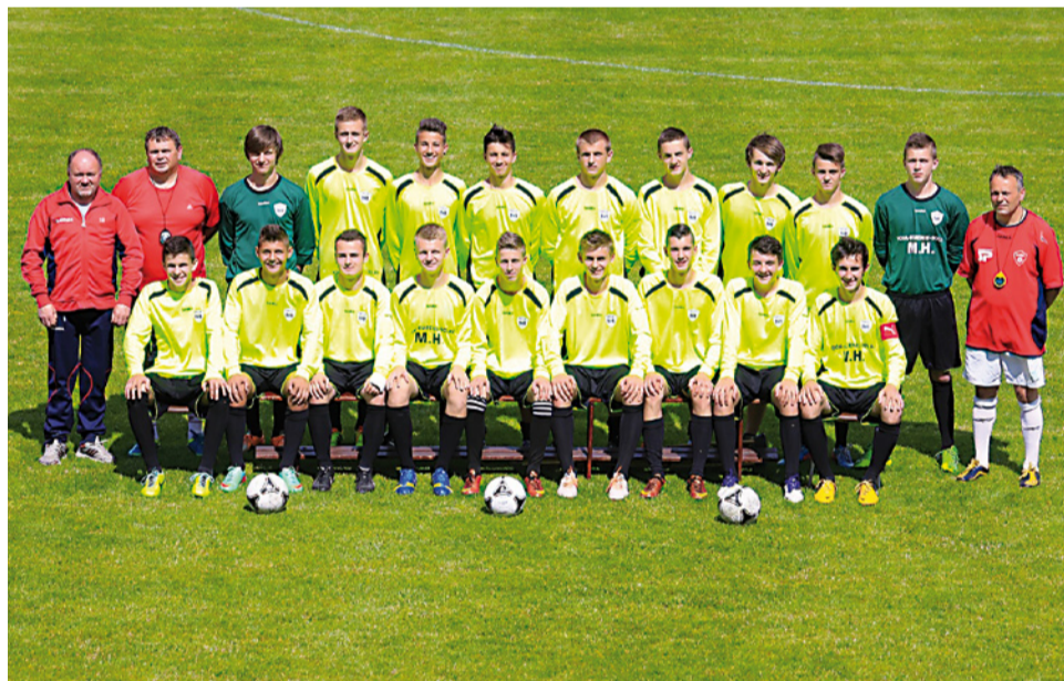
Futbalisti mladšieho dorastu 43 majstrovských zápasov neprehrali.