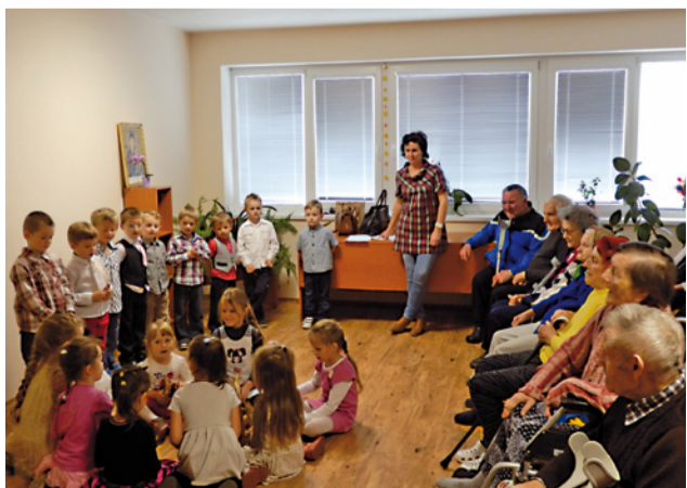
Výstupenie detí z MŠ Komenského pri príležitosti Mesiaca úcty k starším.