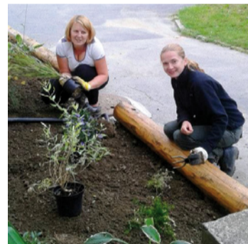
Kvety a estetika trávnikov boli v rukách žien, členiek RC Drobček