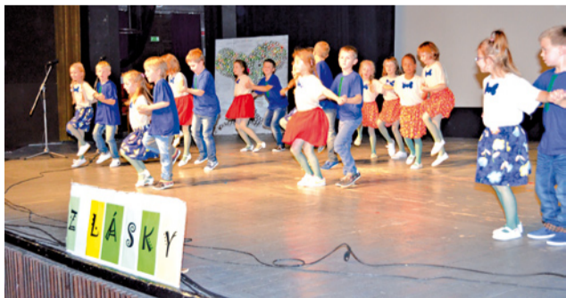
Deti zúčastnili zo symbolickej kytice, plnej zábavy pre starých rodičov.

Touto milou slávnosťou sme chceli vyjadriť našim seniorom úprimné poďakovanie za ich prácu, pomoc pri výchove detí a vnúčat, za ich