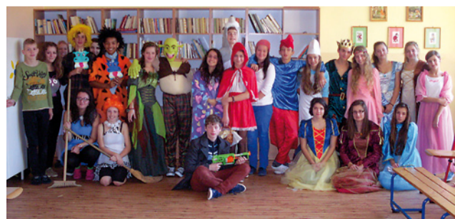
V knižnici ožili rozprávkové bytosti.

Veríme, že aj takýmto formami práce prebudíme u žiakov hlbší záujem o čítanie a o knihy.