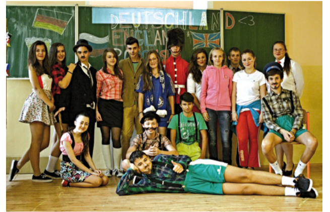
Rôzne jazyky v rôznych kostýmoch a – zábava.

Žiaci druhého stupňa prezentovali angličtinu, nemčinu a ruštinu ako jazyky, ktoré sa učia a ako jazyky národov bohatých na kultúru. V pries-