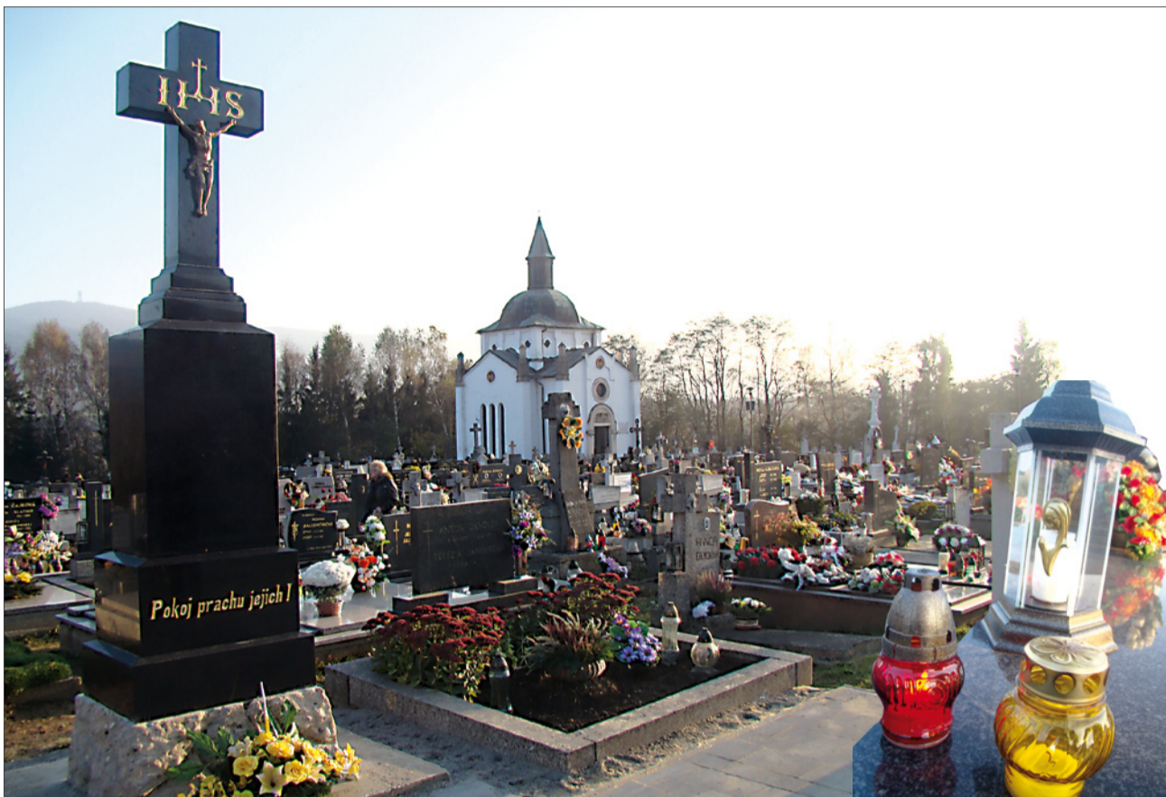
Majestátny kríž a za nim v širokom zástupe stovky našich drahých zosnulých. Aká symbolika...