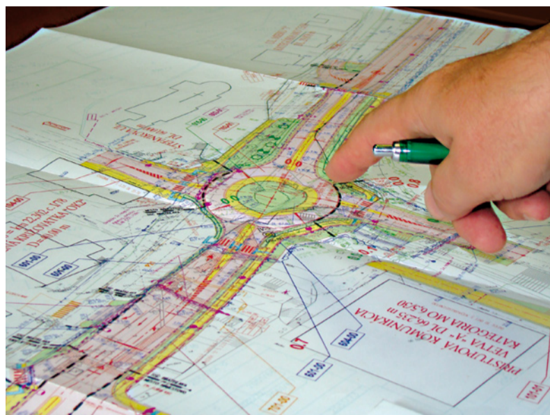
Je to „čierne na bielom“. Po ôsmich rokoch sa dielo Námestovo - Prietah podľa tohto koordinačného výkresu stavby začína budovať.

týmto zariadeniam. Preto sme požiadali o posunutie cesty o cca 12 metrov smerom k obchodnému domu Terno a posunutie kruhovej križovatky tak, aby bola Štefánikova ulica napojená kolmo do kruhovej križovatky a priechod pre chodcov zostal na pôvodnom mieste. Naše požiadavky mali riešiť aj ďalšie problémy - vozidlá zo strany od kruhovej križovatky pod kostolom v pôvodne riešenom projekte nemohli odbočiť k obchodnému domu Terno, ale sa museli ísť otáčať na ďalší kruhový objazd, ktorý je plánovaný na začiatku mesta, čo bolo pre nás absolútne neprijateľné. Dlhú dobu naše dokazovanie a presvedčovanie, ale dnes môžem povedať, že to malo význam. Nový prezentovaný projekt zohľadňuje všetky požiadavky, ktoré sú doriešené k spokojnosti nášho mesta. Takéto dielo sa nerobí na rok, ale s výhľadom najmenej na 30 rokov, a preto je namieste ho vybudovať tak, aby občania boli s ním dlhodobo spokojní. Neraz sme pritom na rokovaní počuli, že Námestovo nie je pupkom Slovenska, a že takých, podstatne vážnejších problémových miest, kde sú problémy v doprave od rána do