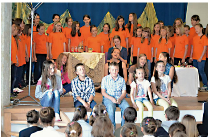
Aktéri muzikálu Neberte nám princeznú.