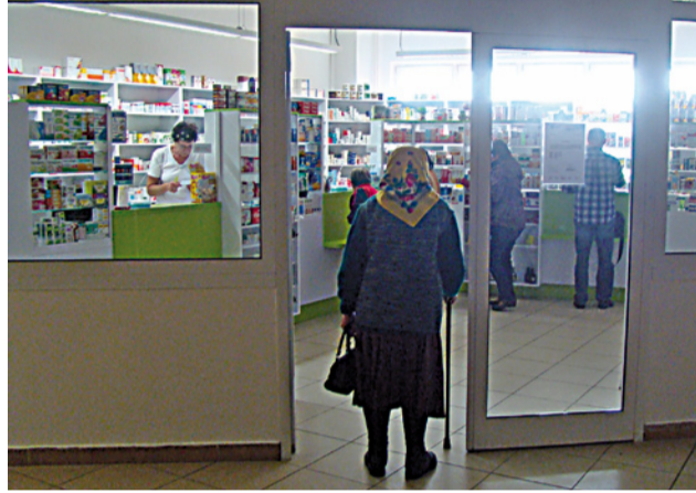
Do novootvorenej Lekárne Poliklinika prichádzajú pacienti po lieky aj zo vzdialenejších ambulancií.

Okrem toho sme predminulý týždeň otvorili novú zubnú ambulanciu, pretože veľa pacientov si sťažovalo, že tieto služby sú časovo nedostupné, že v zubných ambulanciách treba dlho čakať. Podarilo sa nám získať dobrú lekárku, ktorá bude objednávať pacientov presne na hodiny. V minulosti rovnakým spôsobom pracovali