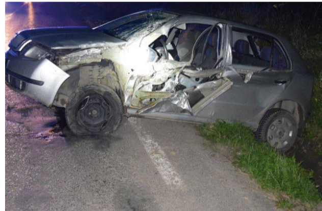
Zo Škody Fabia opitá vodička, našťastie, vyviazla iba s menšími zraneniami. Nemusi sa to však skončiť vždy iba zničením vozidla a škrabancami na tele šoféra...

Polícia žiada všetkých účastníkov cestnej premávky, aby sa