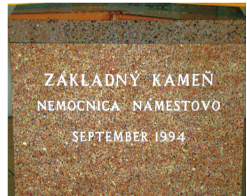
Základný kameň budúcej nemocnice pred 20 rokov.

Dostali sme ho písomne, podpísané generálnym riaditeľom VŠZP,