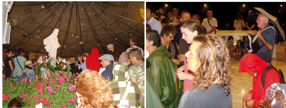
Silná búrka, ktorá sa v jeden večer strhla počas sv. prijímania, prinútila tisíce ľudí utekať do svojich prístreškov. Niekoľko stoviek sa bežalo skrýť pod prístrešok blízko oltára a sochy Panny Márie, kde za normálnych okolností majú prístup iba kňazi. Čím silnejšie udierali hromy a blesky, tým hlasnejšie sa sv. ruženec modlili a spievali ľudia, nalepení na seba ako jeden obrovský koláč. Niektorí, zo strachu pred búrkou, aká určite nebýva často, vliezli pod obrovský mramorový oltár...