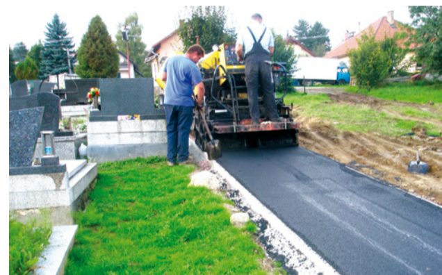
Pokládka asfaltového povrchu na nový chodník v cintoríne