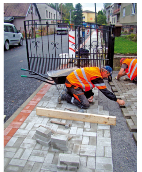
Pracovníci liptovskomikuláškovej firmy, no bydliskom Oravci, pri kladení zámokovej dlažby na chodník dbajú aj o to, aby vjazd z chodníka do dvorov bol plynulý.

U p r i m n o u chválou nešetřila ani pani Pavlína: „Najprv sa na nás nakontakto-