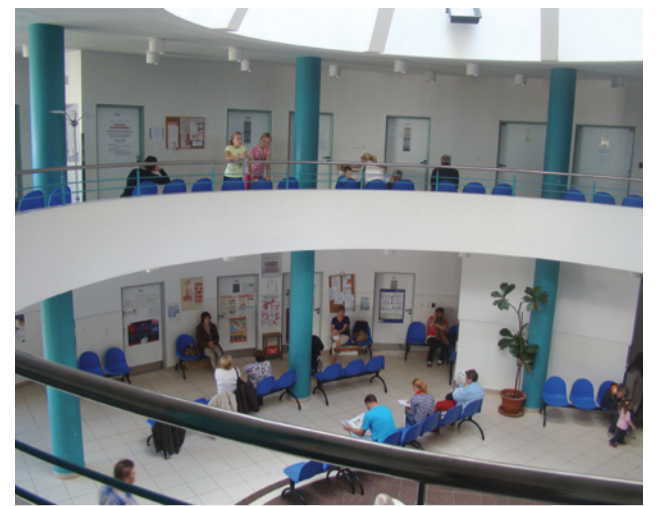
Oravská poliklinika v Námestove je jednou z najkrajších, ak nie najkrajšia v širokom okolí.

Procesu za zachovanie dialýzy ten postoj ľudí veľmi pomohol. Aj napriek tomu, že toľkí sa zapojili do petície, príliš som neverila tomu, že to bude mať úspešný koniec. Skutočne ma oslovil záujem ľudí a hoci dialyzačných pacientov zatiaľ nie je veľa, ich nasadenie a bojovnosť mňa samotnú veľmi povzbudili.