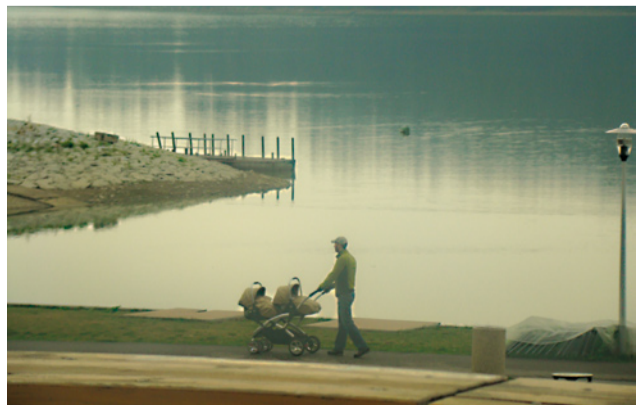
Jesenné sviatočné ráno na brehu priehrady.