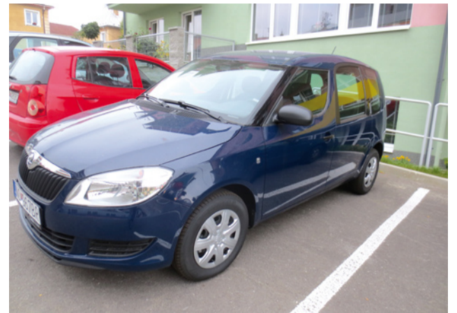
Tmavomodrá Škoda Roomster už slúži domovu pre seniorov.

Koncom roka 2013 vypracovalo vedenie mesta spolu s vedením mestskej organizácie Centra sociálnych služieb v Námestove žiadosť o získanie dotácie na kúpu motorového vozidla pre domov pre seniorov. Žiadosť bola zaslaná na Ministerstvo práce sociálnych vecí a rodiny SR. Maximálna dotácia z ministerstva mohla byť 9 tisíc eur, spoluúčasť mesta minimálne 10%. Začiatkom roka prišla z ministerstva potešiteľná správa, dotácia v maximálnej výške bola mestu schválená. Následne kúpu predložilo vedenie mestského úradu na schválenie poslancom mestského zastupiteľstva. Tá na svojom zasadnutí 25. júna 2014 k uvedenej dotácii schválili príspevok mesta vo výške dvetisíc eur, spolu bolo