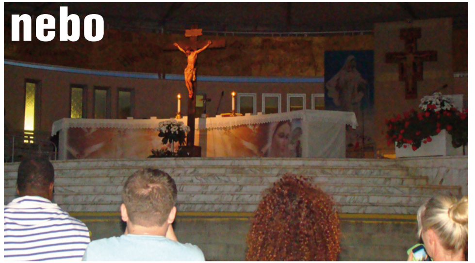
Silným vnútorným zážitkom i osobným dotykom Boha je večerná adorácia pred krížom na obrovskom voľnom priestranstve pri hlavnom oltári.