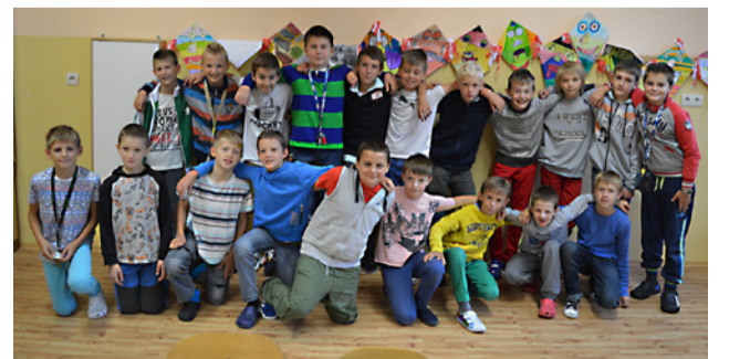
Naši nádejní reprezentanti.