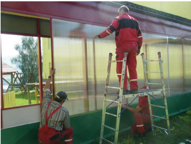
Pracovníci technických služieb pri oprave pergoly na MŠ Brehy.