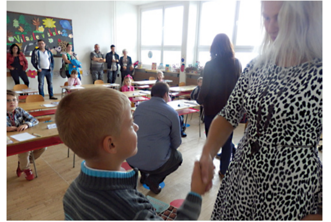
Prvý kontakt so školou bol pre prváčikov určite príjemným prekvapením, zvlášť, ak ich povzbudzovali pani učiteľky.