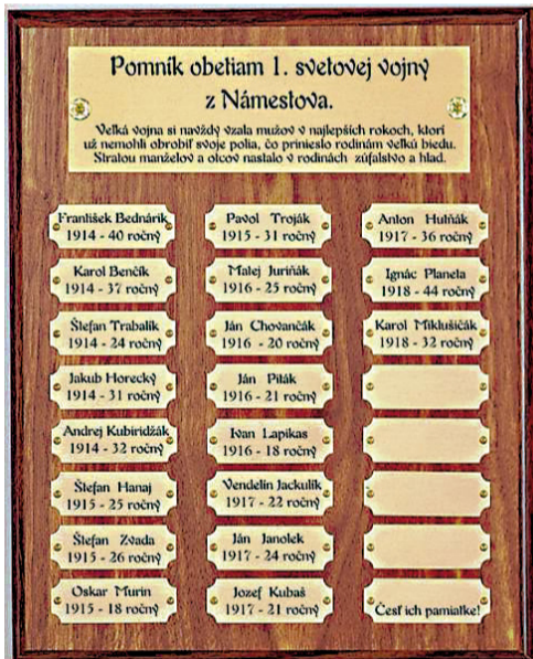
Padlí v prvej svetovej vojne. Česť ich pamiatke!

Dnes nahlas uvažujem o tom, či jedna pamätná tabuľa s menami padlých občanov mesta - umiestnená na čestnom mieste, je pre nás až takým problémom... Alebo je problémom náš nezaujem, prípadne naša neúcta k