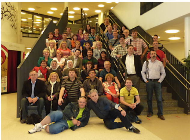
Riaditelia cirkevných základných škôl z celého Slovenska vo Fínsku určite porovnávali aj podmienky v slovenskom a fínskom školstve.