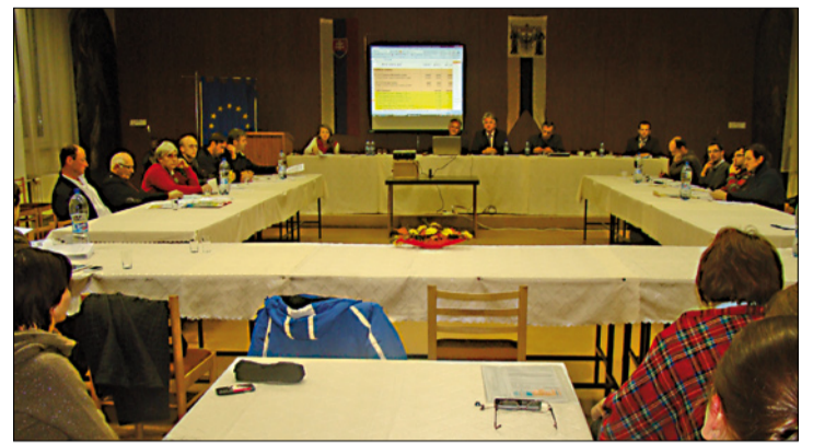
Pohľad do rokovacej sály, v ktorej sa začiatkom októbra uskutoční posledné rokovanie MsZ vo volebnom období 2010 – 2014.

Týkalo sa určenia počtu volebných obvodov, počtu poslancov a rozsahu výkonu fun-