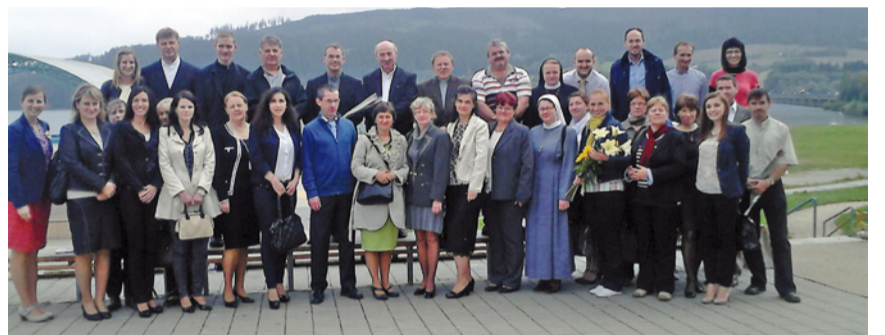
O duchovný rast detí na CZŠ sv. Gorazda sa bude starať tento kolektív pedagógov, kňazov, rehoľných sestier a katechéto.

Aby sa nám to všetkým darilo, začíname tento nový školský rok sv. omšou a prosbou, aby nám Pán Boh pomáhal a