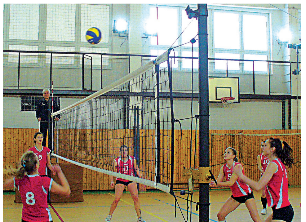
Záber zo súboja námestovských kadetiek (vpravo) proti predposlednej Novoti. Na domácej palubovke zvíťazili v 11. kole hladko dvakrát 3:0.