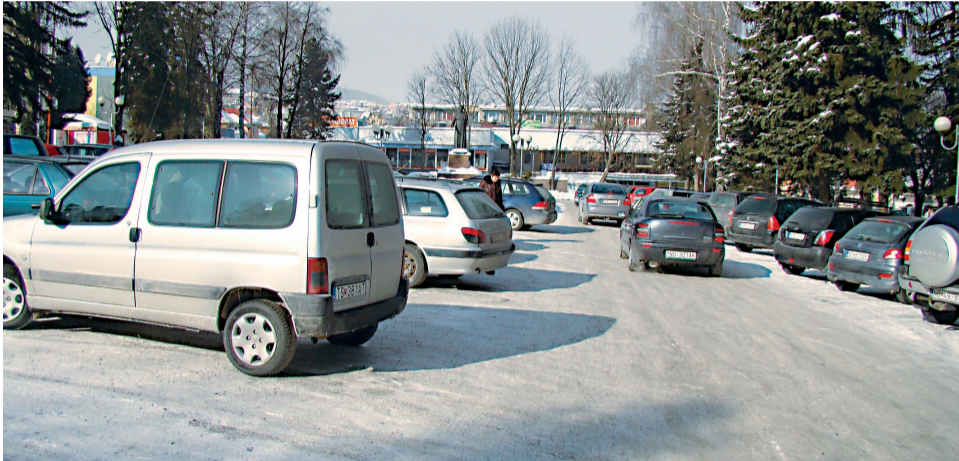
Parkovisko na Bernolákovom námestí je plné takmer po celé dni.