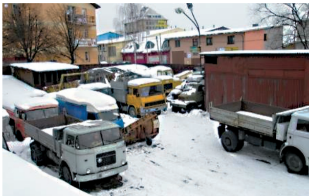
Komunálna technika Technických služieb mesta Námestovo ešte z čias „hlbokého socializmu“...

Hoci, musím povedať, že to nemali jednoduché. Naš vozový park – nakladače, honky, posypacie vozidlá, traktory – má priemerný vek 30 rokov, takže z tohto hľadiska to bolo dosť zložitá. Možno povedať, že stroje dva dni pracovali a štyri dni sme ich opravovali. Hoci sú garážované, našarovali sme ich, vyšli na cesty,