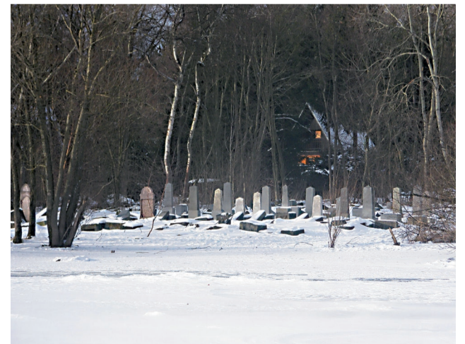
Židovský cintorín neďaleko Studničky v Námestove v súčasnej podobe.