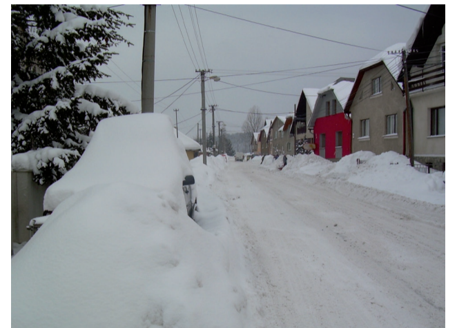
Námestovské ulice týchto dní.