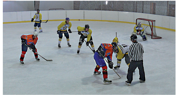
Ostatný vzájomný súboj MTS a Námestova skončil výhrou tretieho tímu tabuľky.