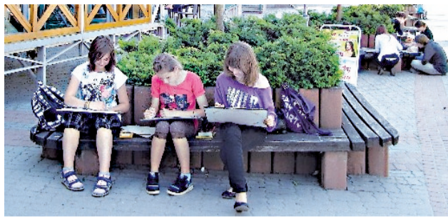
Tvorivé dielne žiakov v Námestove počas GVN 2011.