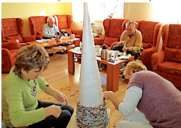
Pri zaujímavých aktivitách trávia čas klienti Domu Charitas v Námestove.