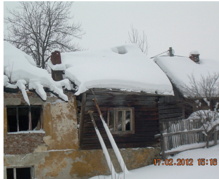
Vydržia ešte do jari...?

Nielen mestská polícia prijala s nevôľou informácie o existencii služieb rôzneho druhu v Urbárnem dome. Za chrbtami ľudí, ktorí pracujú v tomto biznise, vidieť nielen špinavé ruky pruskowskej mafie z Poľska.