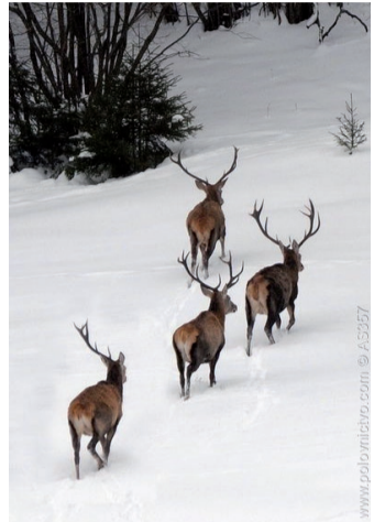
Fioto: int. poľovníctvo