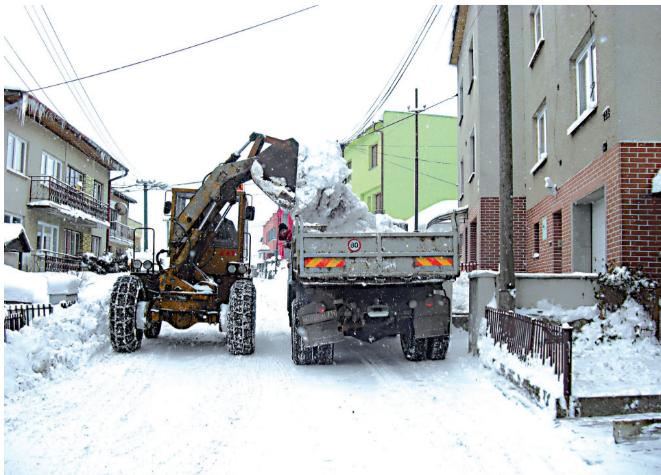
Bohatá snehová nádielka prinútila koncom januára Technické služby sneh z ulíc odvázať. Z Kamenickej, L. Štúra, Kukučínovej, J. Kráľa, Mlynskej, Okružnej, Hviezdoslavovej, Slnecnej, Bernolákovej ulice a Hviezdoslavovho námestia i všetkých parkovísk. Neustále narastajúci počet vozidiel si vyžaduje aj zvýšené náklady na zimnú údržbu. Dobrou organizáciou práce a pod novým vedením technické služby náročnú situáciu zvládli.

Hovorí sa, že nová metla dobre metie a tak sa prirodzene očakáva, že na TS bude tím pracovníkov pod Vaším vedením robiť možno efektívnejšie, lepšie... Čo by ste teda chceli na TS