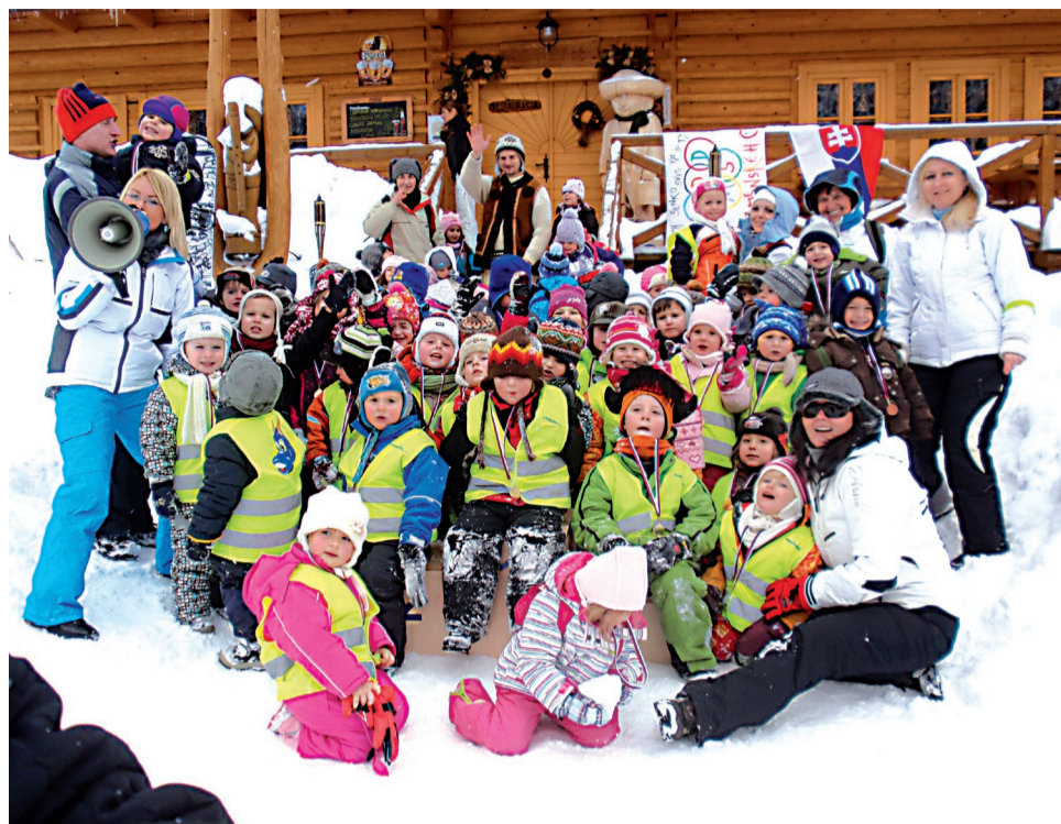
Malí účastníci veľkých olympijských hier z MŠ na Komenského ulici.