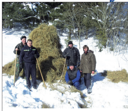
Len čo chlapi od kopy odišli ďalej, pribehli k senu srnky.

bola návšteva skupiny srniek, ktorým potrava prišla evidentne vhod. Určite boli poriadne vyhladované, lebo len čo sa chlapi presunuli od zloženej hromady sena o pätnásť metrov ďalej, aby urobili ďalšiu „jedáleň“ pre zvieratá, už sa k tej prvej priblížili vyhladované srnky. Nevadila im prítomnosť ľudí a na kvalitnom, nasolenom sene si pochutnávali. Pohľad na ne bol potešujúci aj pre chlapi od DHZ Námestovo i ľudí, ktorí práve prechádzali okolo a ochotne pomohli pri práci hasičom.