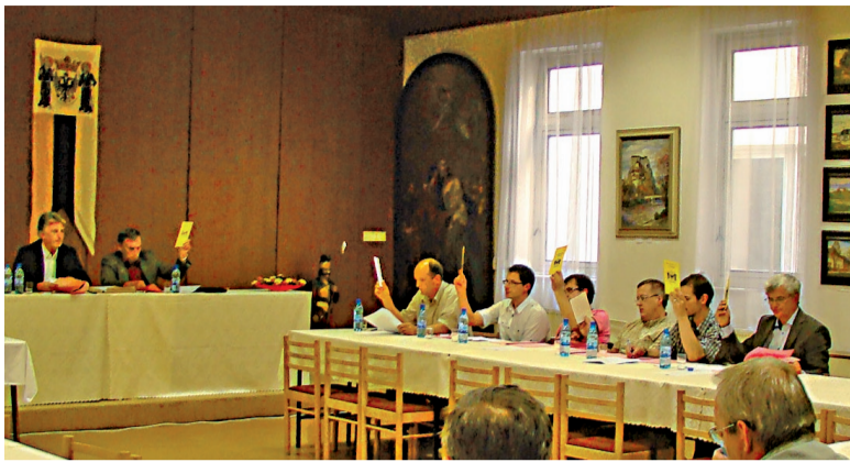
Poslanci zahlasovali za rozpočet 2012 jednohlasne.

Časť finančných prostriedkov z rozpočtu mesta sa použije na rekonštrukcie mestských budov, ciest a chodníkov. V Materskej škole na Brehoch sa opraví dlažba pergól. Rekonštrukciou prejde aj hospodársky pavilón v Materskej