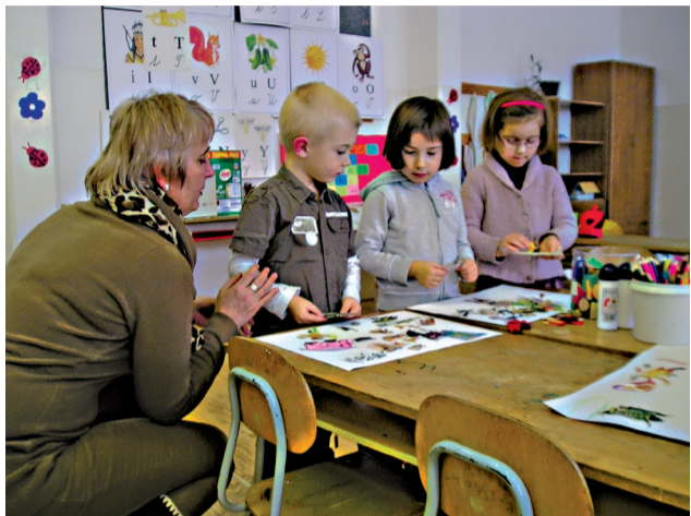
Predškoláci sa v ich budúcej škole prezentovali svojimi schopnosťami a talentom.

Tri dni, v ktorých prebiehal zápis na našej škole, boli