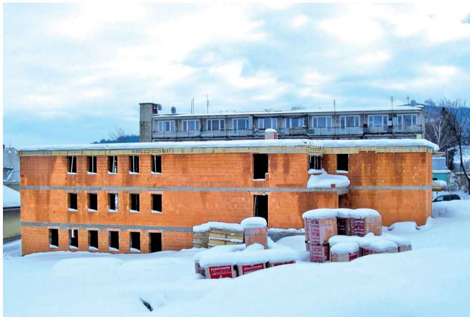
Domov pre seniorov by mal byť dokončený do konca roka 2012.

dvore v Námestove. Hlavným cieľom bolo spevnenie plochy na hale, oplatenie, nové elektrorozvody a dažďová kanalizácia. Z piatich cenových ponúk bola najvýhodnejšia ponuka Stavebného podniku v cene 135 256,02 €. Na zberný dvor bol zakúpený kolesový traktor, čelný nakladač a jednonápravový trojstranný sklápač zo spoločnosti Ag-ra z Martina v hodnote 57 427,60 €. Okrem toho sa zakúpil baliaci stroj, pásový dopravník, kovové pracovné stoly a oceľové kontajnery z firmy Omoss za 64 045,20 €. V minulom roku prebehli aj súťaže na štrkovú úpravu miestnej komunikácie na ulici Lesná na Čerchliach, na ktorú