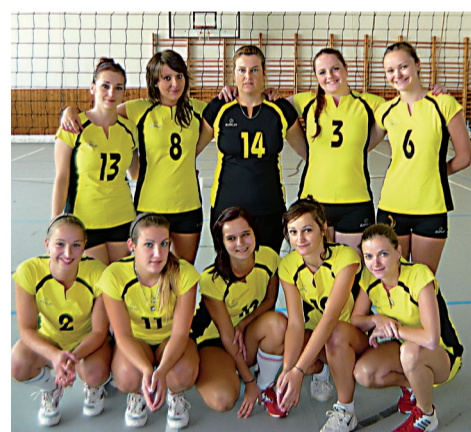
Ženské družstvo volejbalového oddielu TJ Oravan Námestovo zbiera v stredoslovenskej I. lige skúsenosti. Neskôr by ich chcelo zúročiť a dosahovať lepšie výsledky.

Priebežné poradie: 1. Liptovský Hrádok 52:10 - 49 bodov, 2. Považská Bystrica 47:15