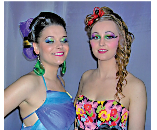
Výsledok práce vizážistiek...

Odborníkov – vizážistov vychovávame v študijnom odbore kozmetik. Žiačky svoju šikovnosť predvádzajú na rôznych podujatiach a súťažiach zameraných na módu, kozmetiku a vizáž napr. súťaž Esthetiques, Módna