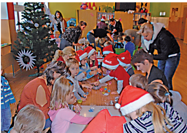
Tvorivá činnosť malých Mikulášov a ich rodičov i učiteľiek.