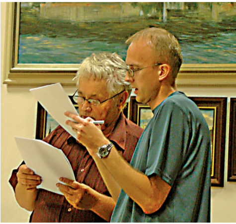
Spolupráca pri tvorbe znenia uznesenia.

po 15,00 h vo výške 2 €/1h a cez víkendy a sviatky vo výške 3 EUR/1h. Taktiež boli schválené zmeny príslušných všeobecne záväzných nariadení mesta. Pre žiadateľov dotácií z rozpočtu mesta sa doplnili povinné prílohy k žiadostiam. Nájomné za prenájom mestského pozemku sa premenovalo na dočasné parkovanie motorových vozidiel. Výška úhrady však ostala nezmenená. Zmenil sa cenník služieb prevádzkového poriadku cintorína. Od 1. januára 2012 sa nájomné za miesto na dvojhrob stanovilo na 12 €/rok a za miesto na jednohrob 3 €/rok. Nájomné je