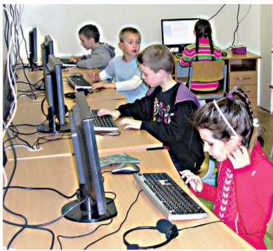
Odborná počítačová učebňa.

Obnova zahŕňala zateplenie budov ZŠ, výmenu okien a vonkajších dverí, zriadenie odbornej počítačovej učebne a jazykovej učebne, každá je vybavená 16 počítačmi pripojenými na internet, interaktívnou tabuľou s dataprojektorom a vizualizé-