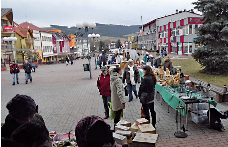
Tohtoročné vianočné trhy v Námestove.