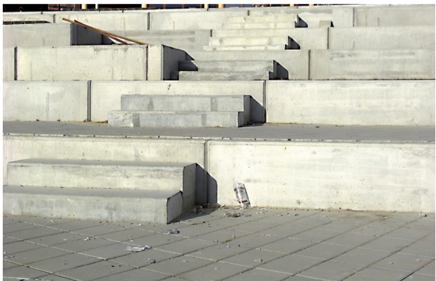
Po diskotékach na nábreží priehrady zostávajú odpadky a rozbité fľaše z alkoholu.