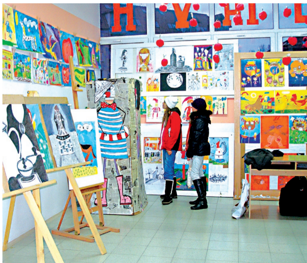
Výstava v OD Klinec potrvá do 9. januára.