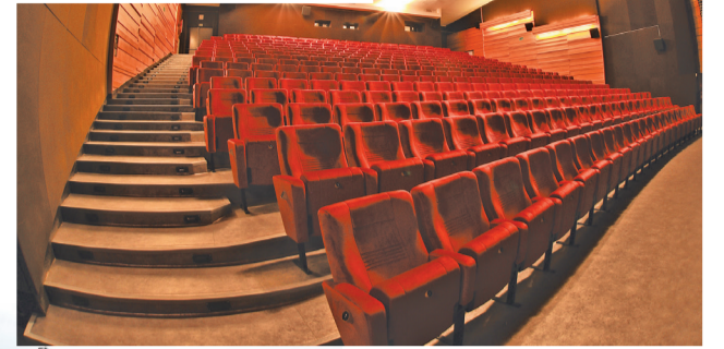
Nová kinosála DKN.

prvkov. Išlo o ulice Okružná v dĺžke cca 730 m a Štefánikova 200 m. Na Severnej ulici došlo k rozšíreniu asfaltovej vozovky o rozme-