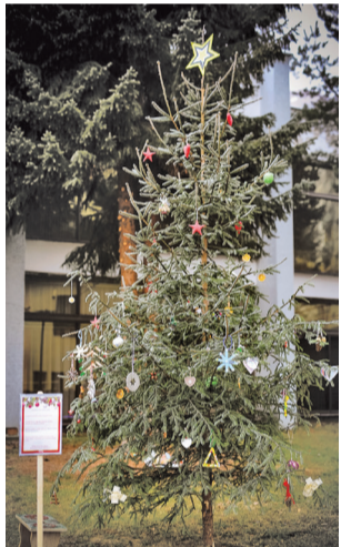
Originálne ozdoby na stromčeku vďaka vám pribúdajú každý deň. Zapojilo sa už viac ako 20 rodín a dokonca aj skupiny žiakov zo ZŠ a MŠ.