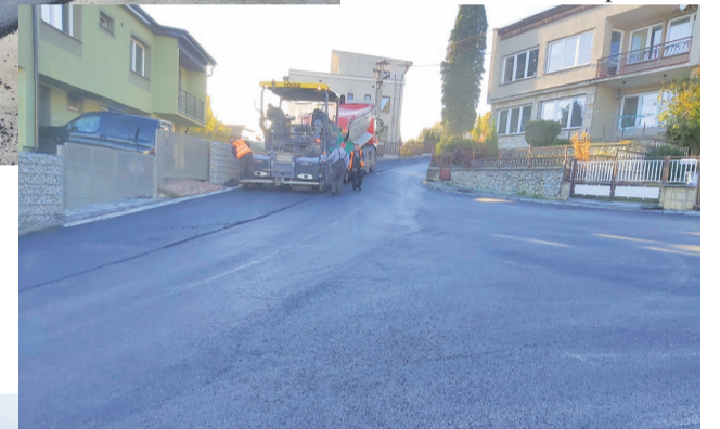
Štefánikova ulica.

cich priestor bez rekuperácie a s poškodenými ohrievačmi. Rekuperáciou sa dosiahne úspora tepelného výkonu minimálne 70 %.