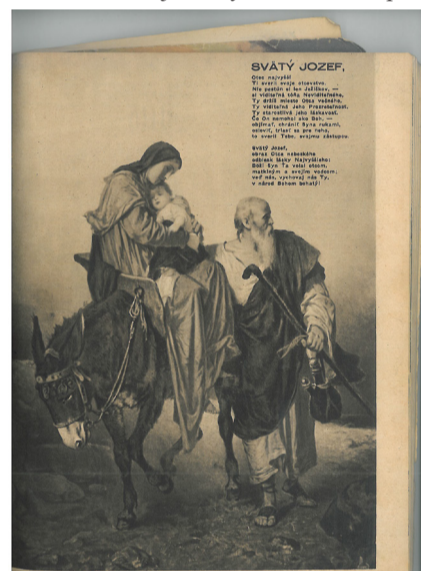
Svätý Jozef – Misionársky kalendár na rok 1944.

Ponavštevovať miesta mojich vychádzok a pre-