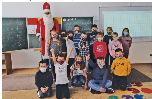
Pri dobrých deťoch Mikuláš vyprázdnil svoje vreco s darčekmi.