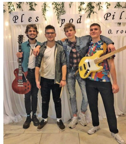
Kapela Sun Employees

núkol takúto skúsenosť. Naše deti a pedagógovia odvedli kus práce. Speváckemu zboru Altebasso, školskej kapele Sun Em-