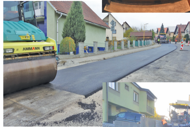
Práce na Okružnej ulici.

komunikácie Ulice Červeného kríža a Kliňanskej cesty, ktoré budú realizované budúci rok. Vďaka verejnému obstarávaniu klesla cena diela v prieme-