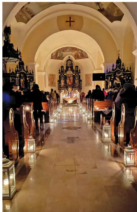
Počas roratnej sv. omše.