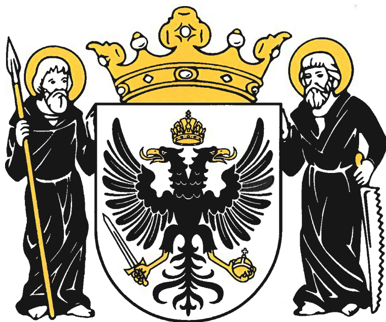
Príloha č. 1: Erb Mesta Námestovo